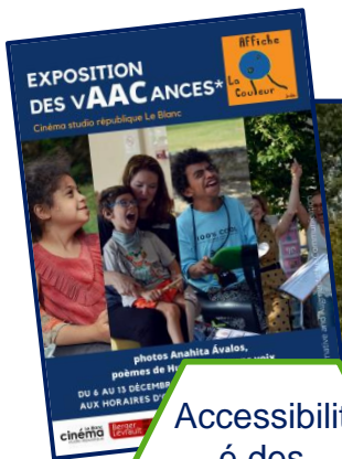
Accessibilité des espaces naturels