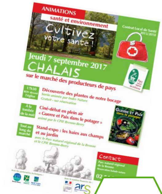
Animations santé- environnement =483 pers.