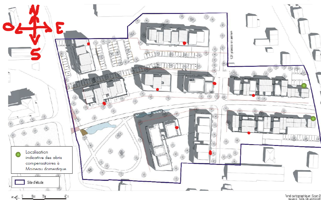
Figure 3 : Localisation indicative des abris de compensation sur le plan masse