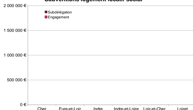
Subventions logement locatif social

Le visa du contrôleur budgétaire régional sur le BOP étant obtenu, des premières subdélégations de crédits sont en cours. Elles permettront de financer 45% de l'objectif de production de logements sociaux "ordinaires" et la totalité des logements en structures. Elle permettra également de financer la bonification incitative à la production de petits logements de type T1 ou T2 mise en place en 2016.