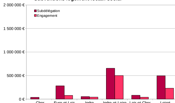
Subventions logement locatif social

Les engagements ont progressé de 15 points sur juillet et août. Tous les départements hormis le Cher ont commencé à financer des opérations, l'Indre et l'Indre-et-Loire étant les plus avancés.