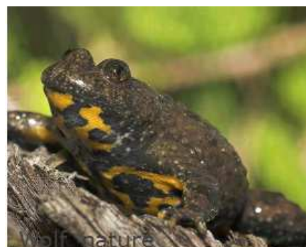
Sonneur à ventre jaune