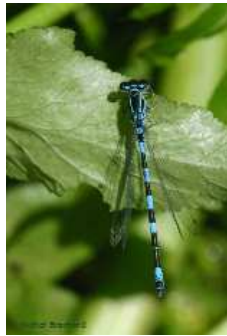
Agrion de mercure