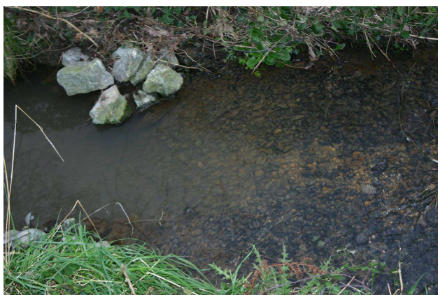
Nature du lit : sous berges graviers