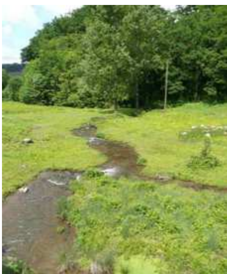
Cours d'eau permanent