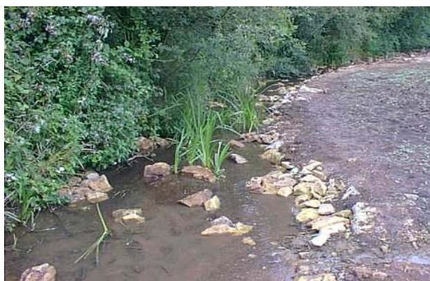
Nature du lit : vase, blocs