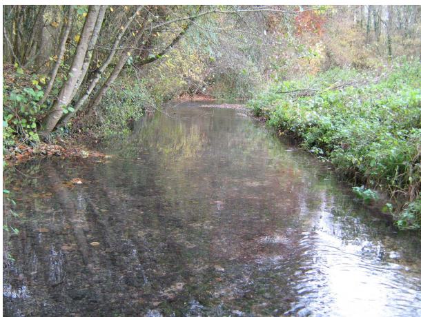
Notion de berge arborescente et graviers