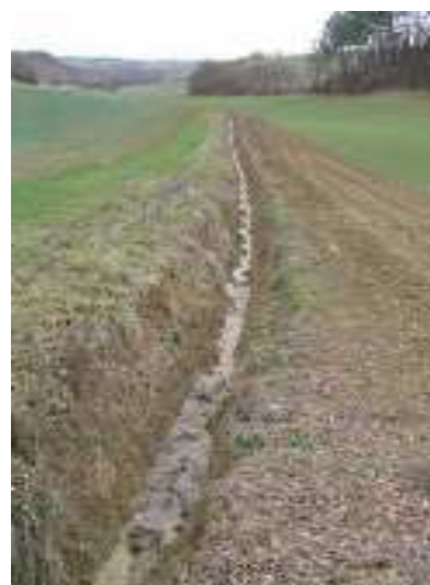
Cours d'eau recalibré