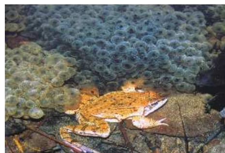
Grenouilles et pontes