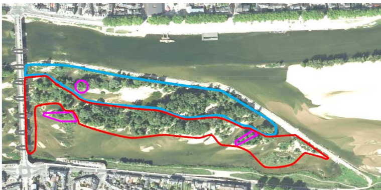
— Abattage et débroussaillage — Coupe sélective et débroussaillage — Zone protégée (castors)

Les arbres seront abattus et découpés en tronçon sur l'île, puis évacués par camion, via le quai des Tourelles et le quai des Augustins vers un terrain, où ils seront broyés. Les copeaux seront ensuite acheminés vers la filière de recyclage (chaufferie industrielle).