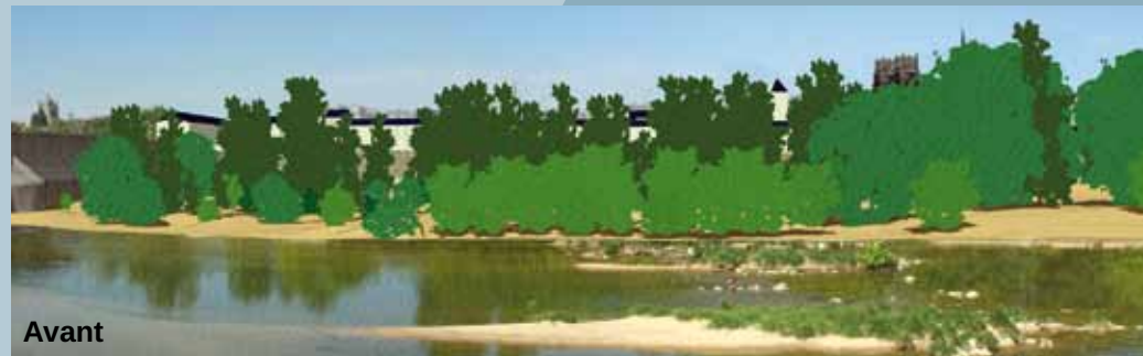
Vue depuis le quai du Fort des Tourelles, rive gauche.