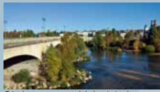
DREAL Centre Développement actuel de la végétation au niveau du pont George V