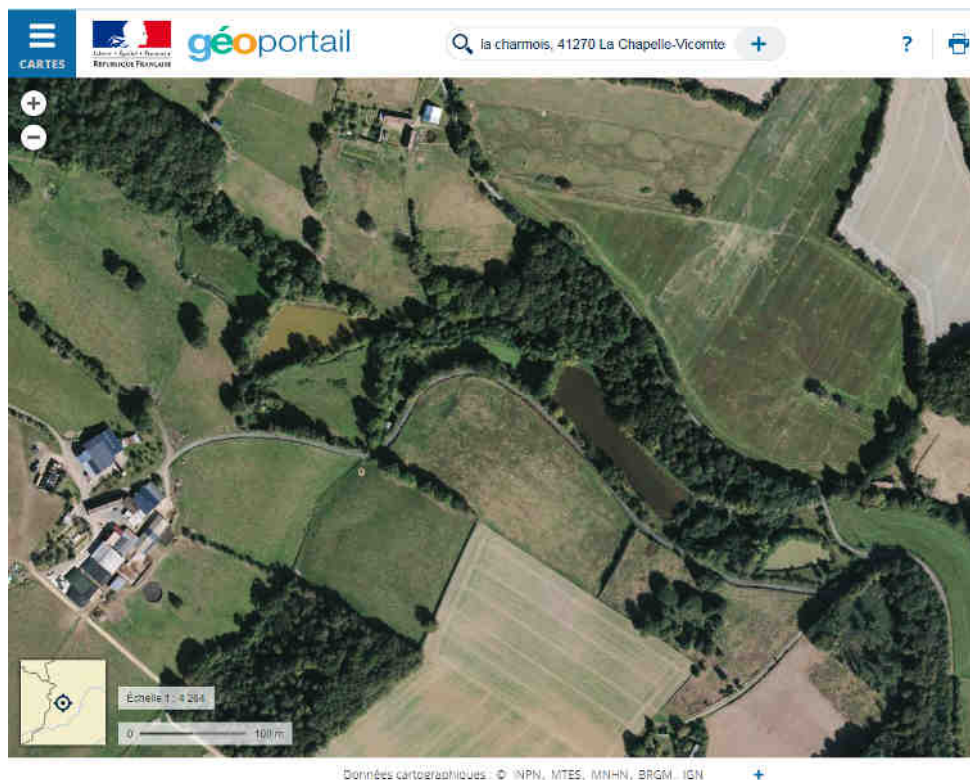
Photographie aérienne extraite du site Géoportail le 25août 2017 permettant de situer le projet dans son environnement proche et lointain