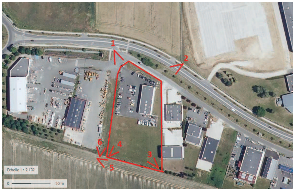
Vue aérienne du projet