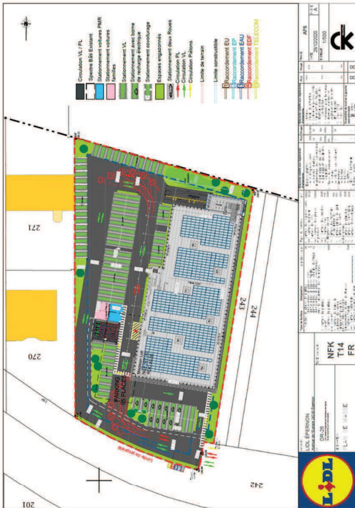
Plan de masse du projet