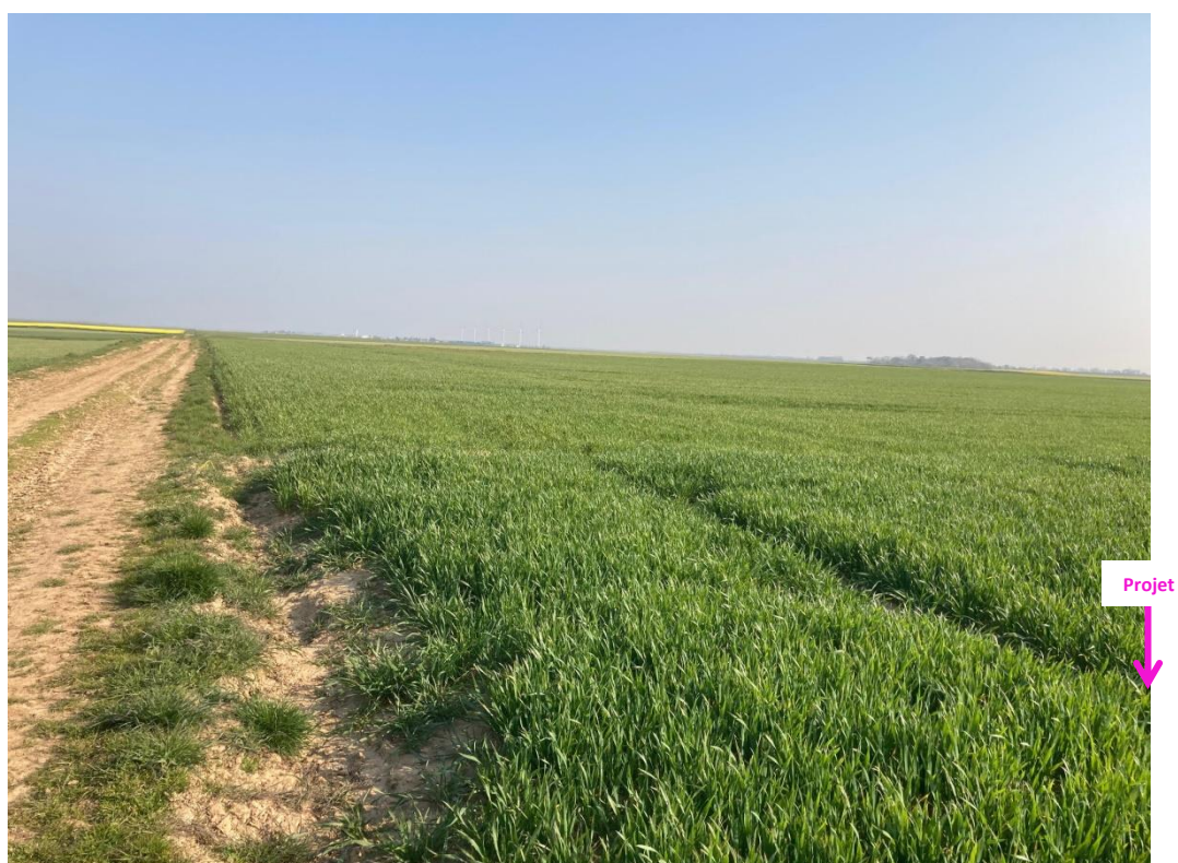
Photographies du 15/04/2021 permettant de situer le projet dans son paysage lointain