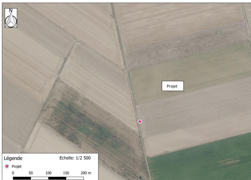
Photographie aérienne extraite de la BDORTHO IGN de 2015 permettant de situer le projet (en rose) dans son environnement proche