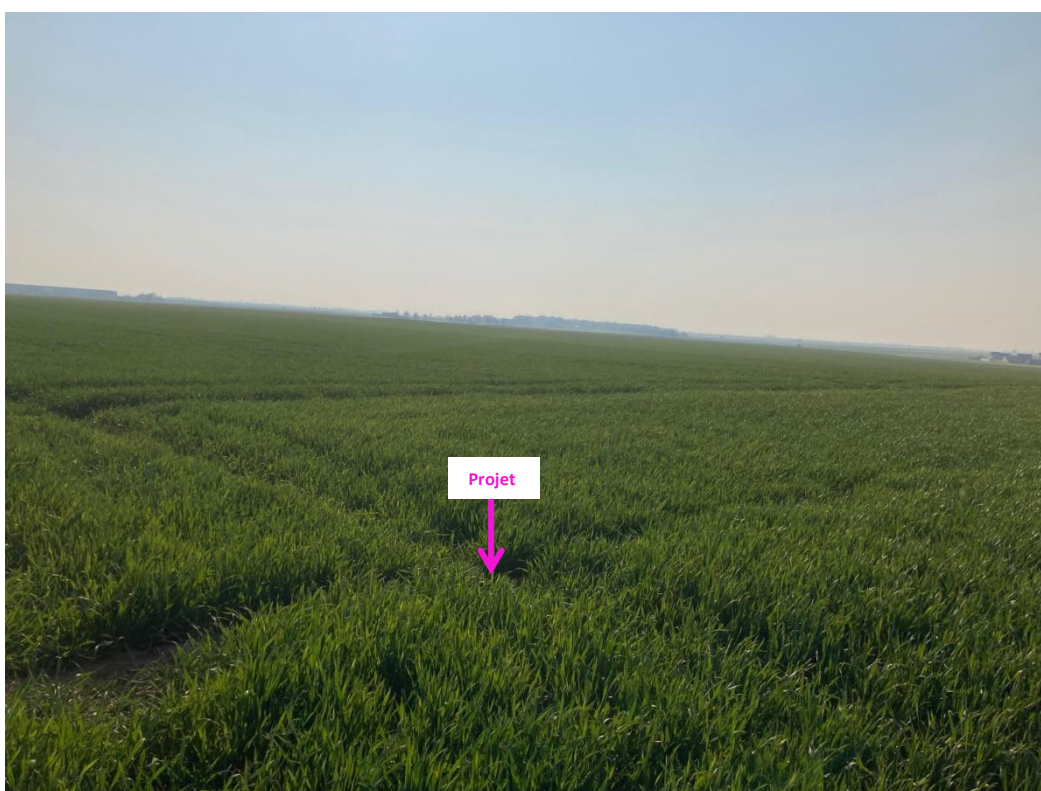
Photographies du 15/04/2021 permettant de situer le projet dans son paysage lointain