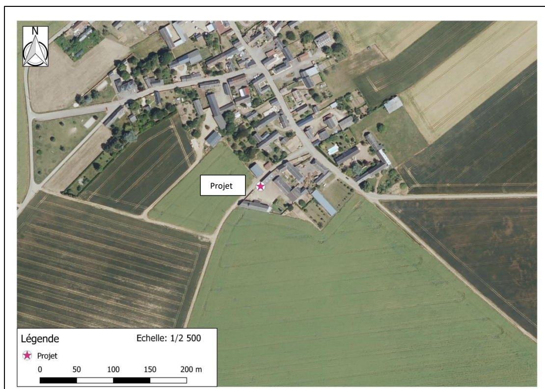
Photographie aérienne extraite de la BDORTHO IGN de 2015 permettant de situer le projet (en rose) dans son environnement proche