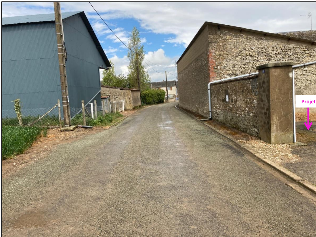
Photographies du 06/05/2021 permettant de situer le projet dans son paysage lointain, prise par la Chambre d'agriculture du Loiret