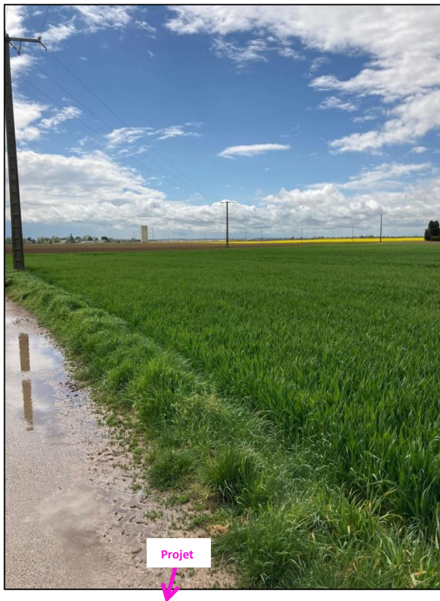
Photographies du 06/05/2021 permettant de situer le projet dans son paysage lointain, prise par la Chambre d'agriculture du Loiret (Vues dos au projet)