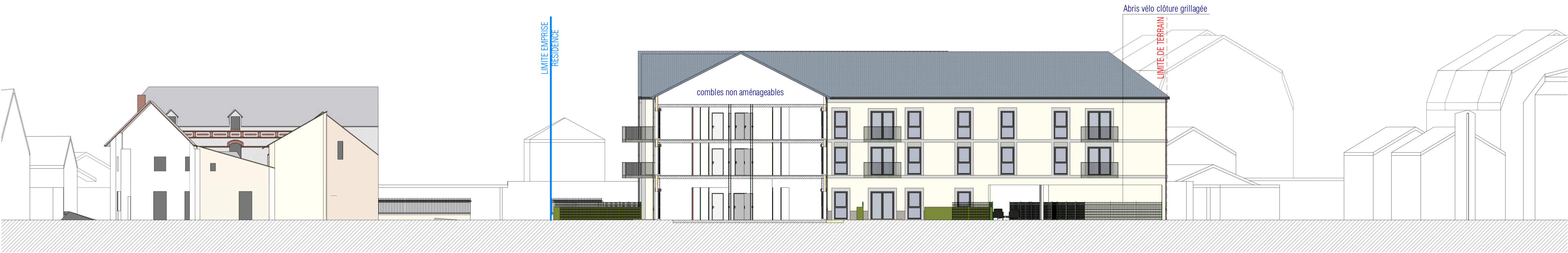
3 PC - Façade sur coeur d'îlot Ech : 1 : 200