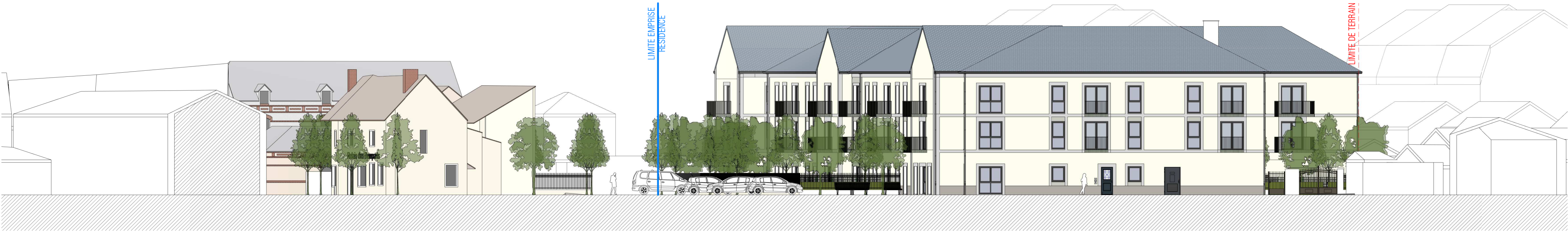
2 PC - Façade sur la rue des remparts Ech : 1 : 200