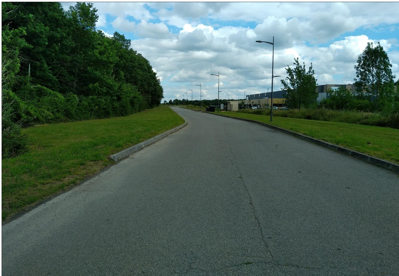
Figure 14 : Prise de vue n°14