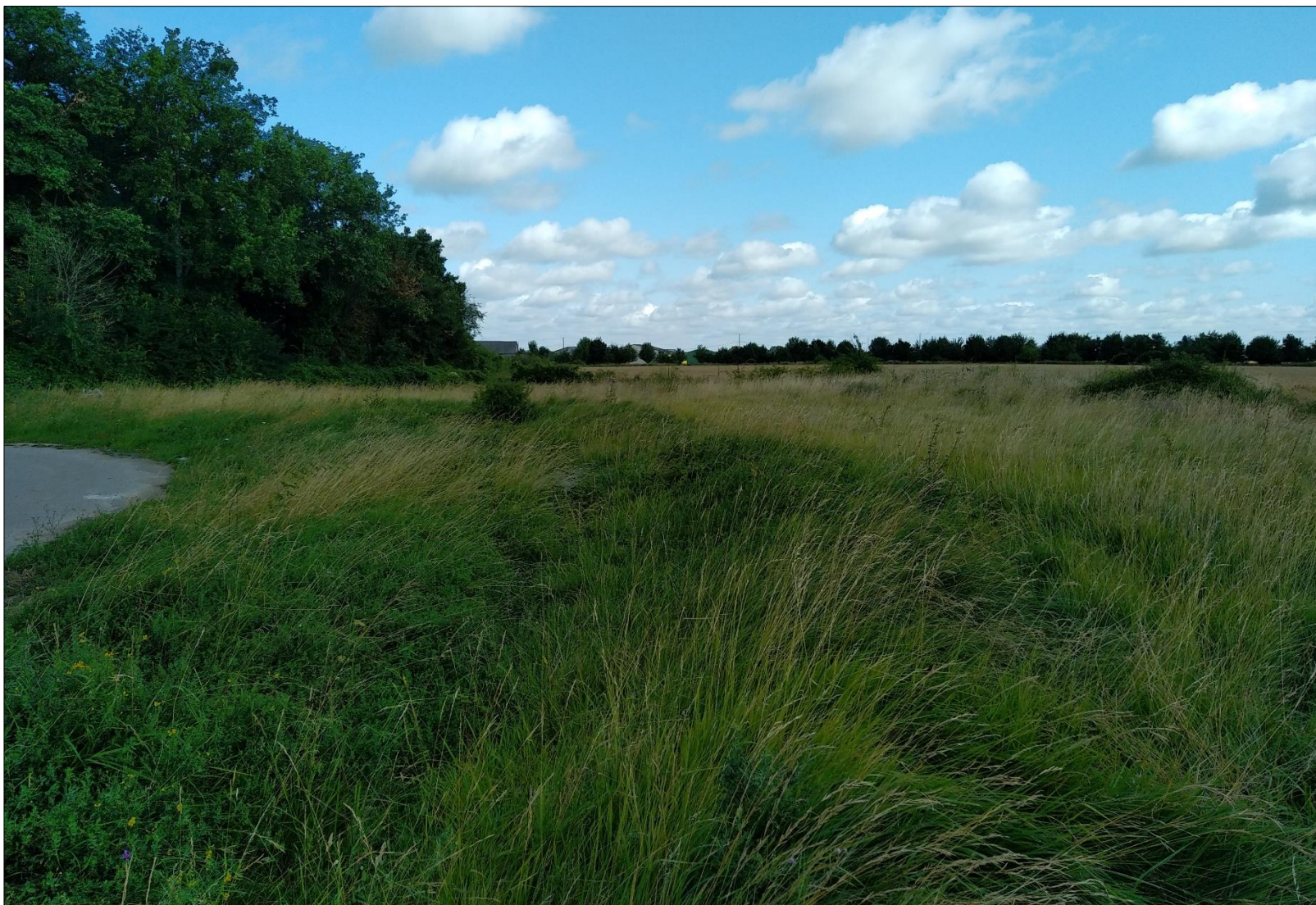
Figure 12 : Prise de vue n°12