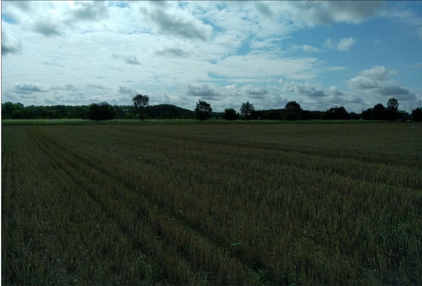
Figure 1 : Prise de vue n°1