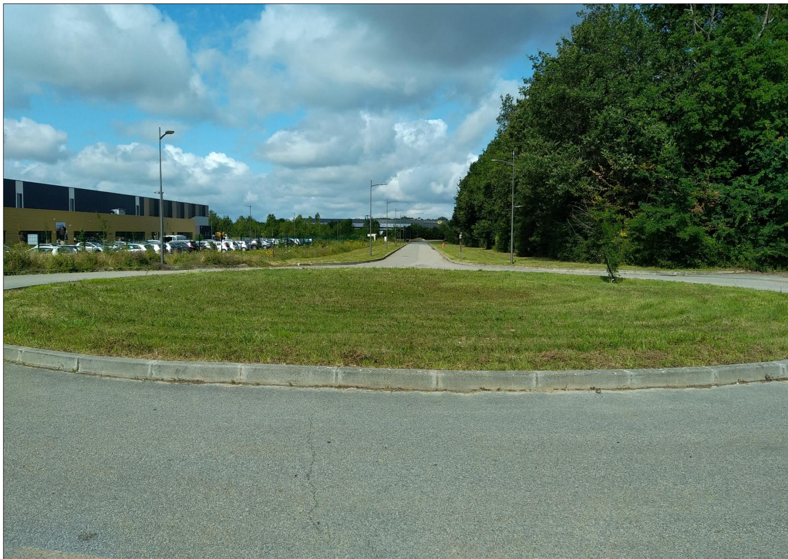
Figure 13 : Prise de vue n°13