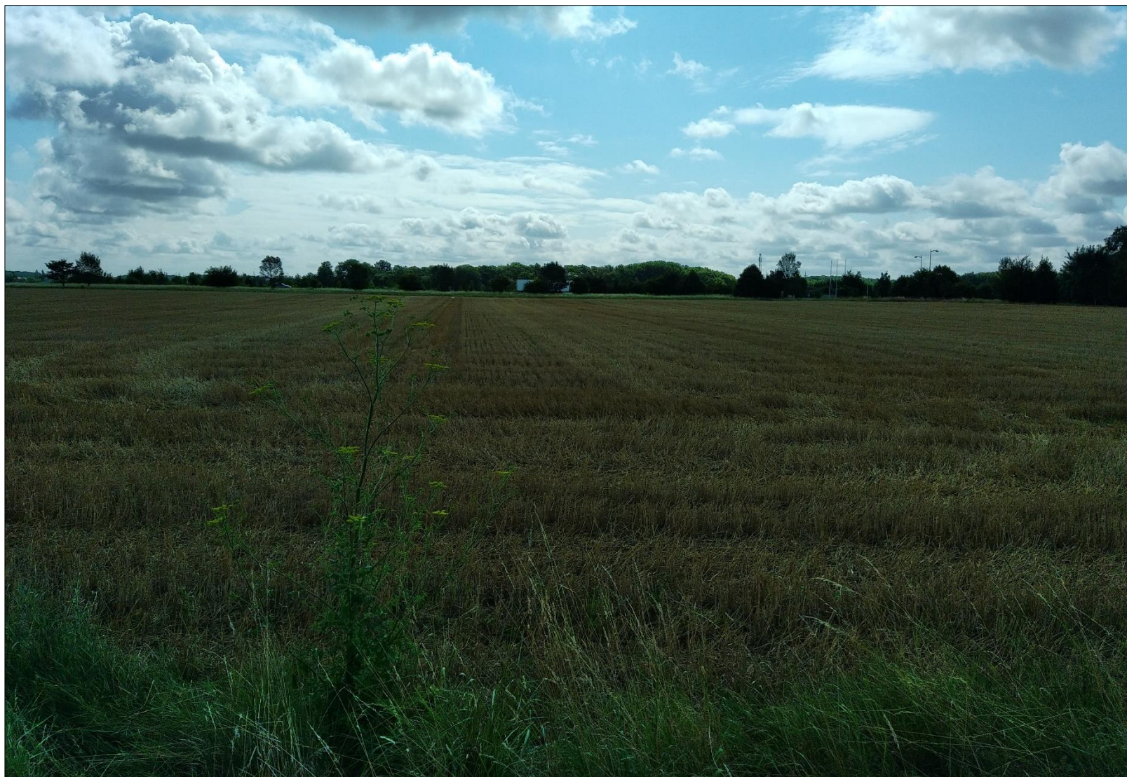
Figure 10 : Prise de vue n°10