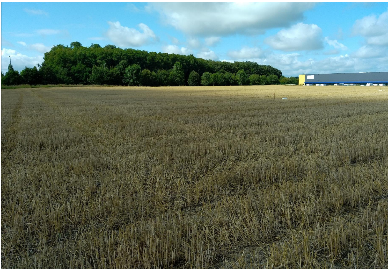
Figure 4 : Prise de vue n°4