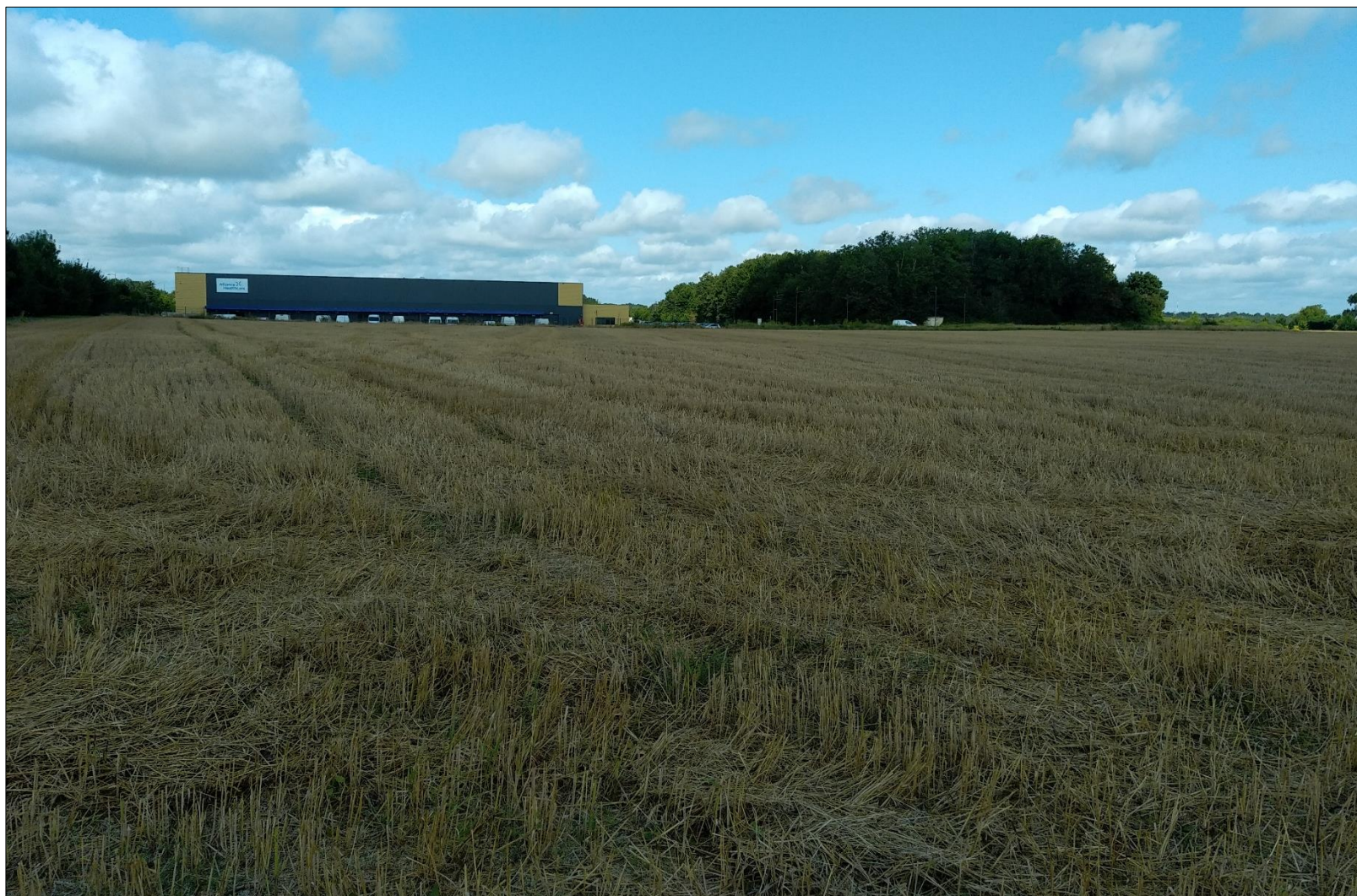
Figure 5 : Prise de vue n°5