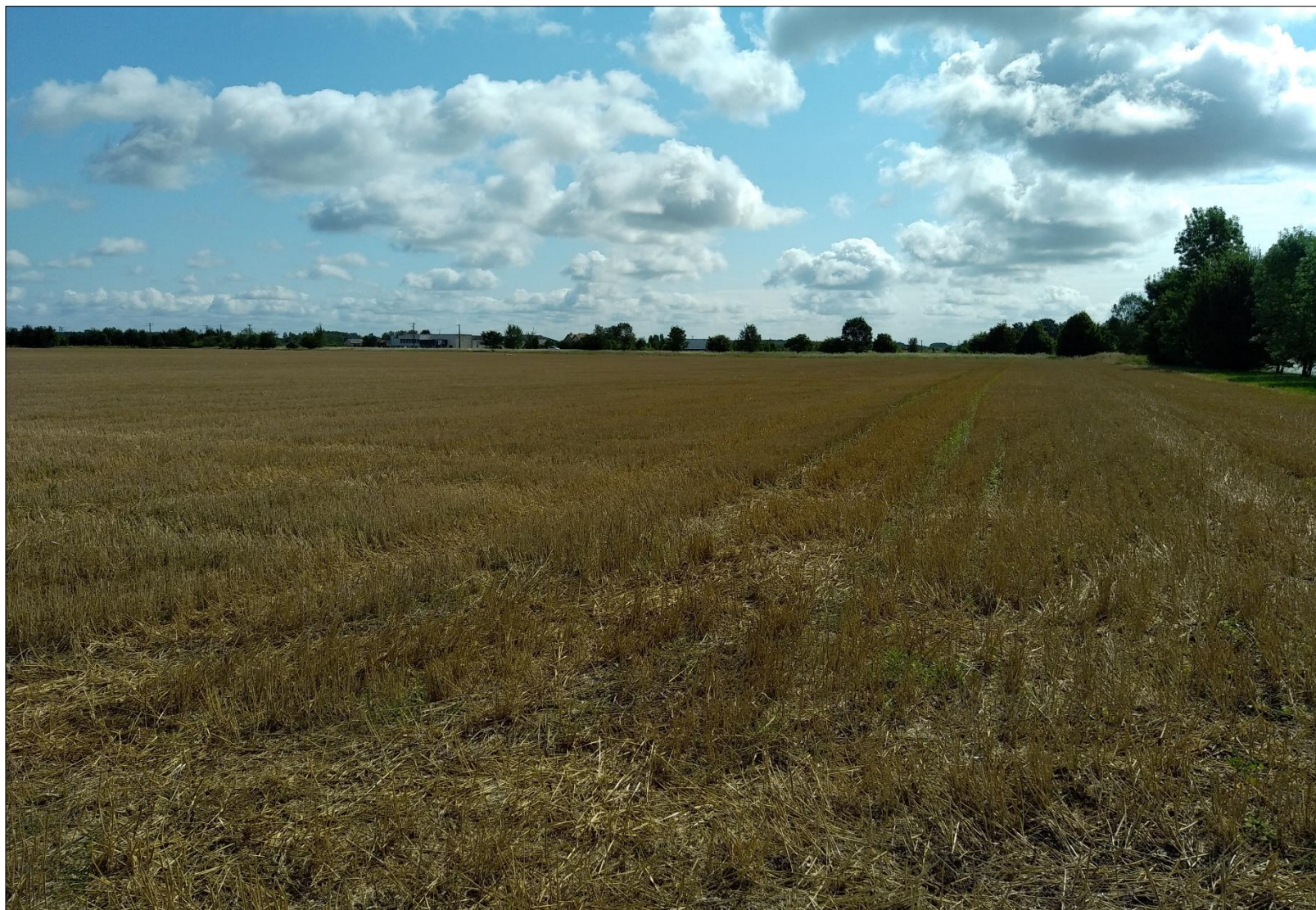
Figure 8 : Prise de vue n°8