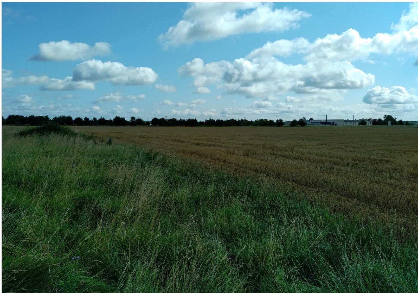
Figure 11 : Prise de vue n°11