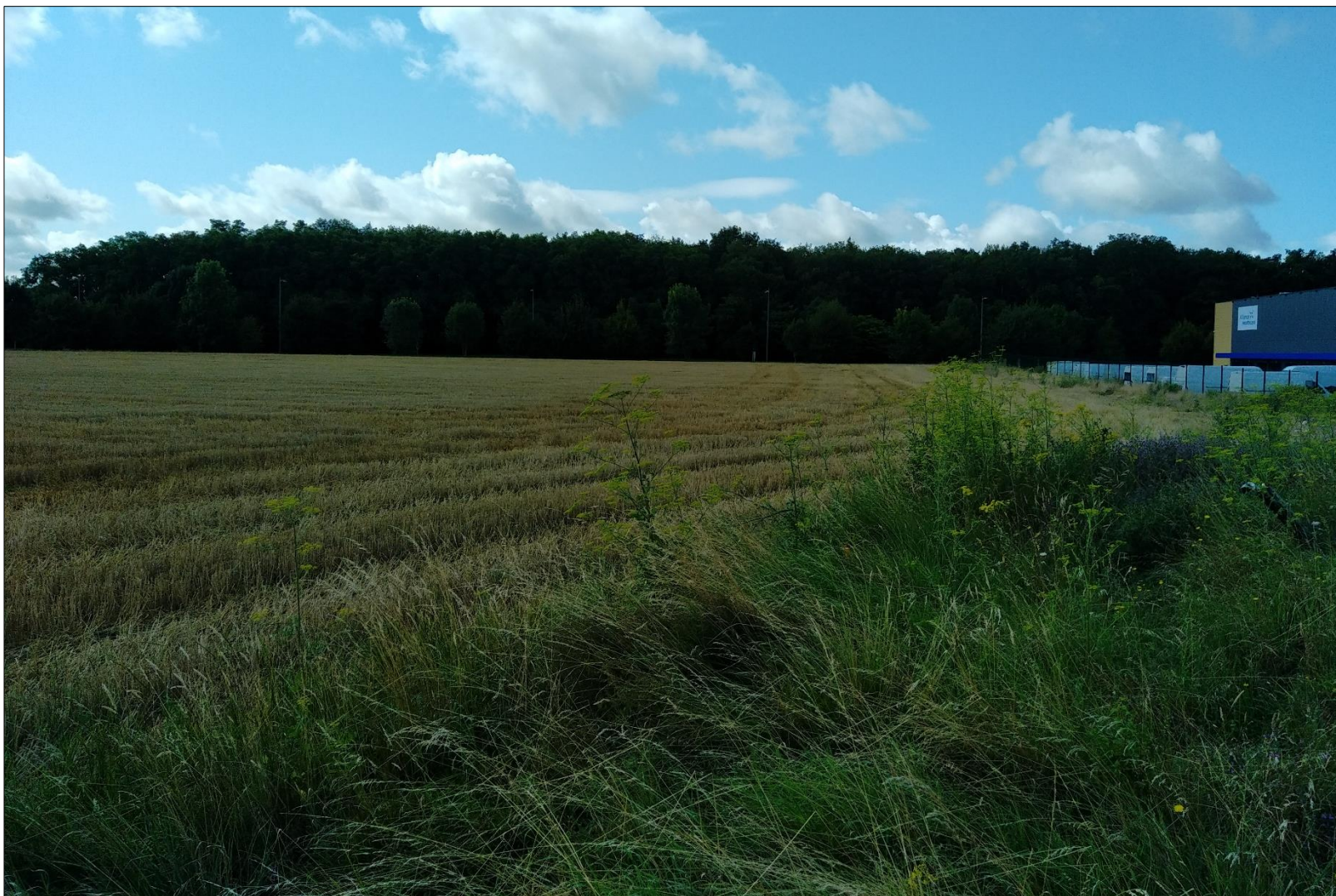
Figure 9 : Prise de vue n°9