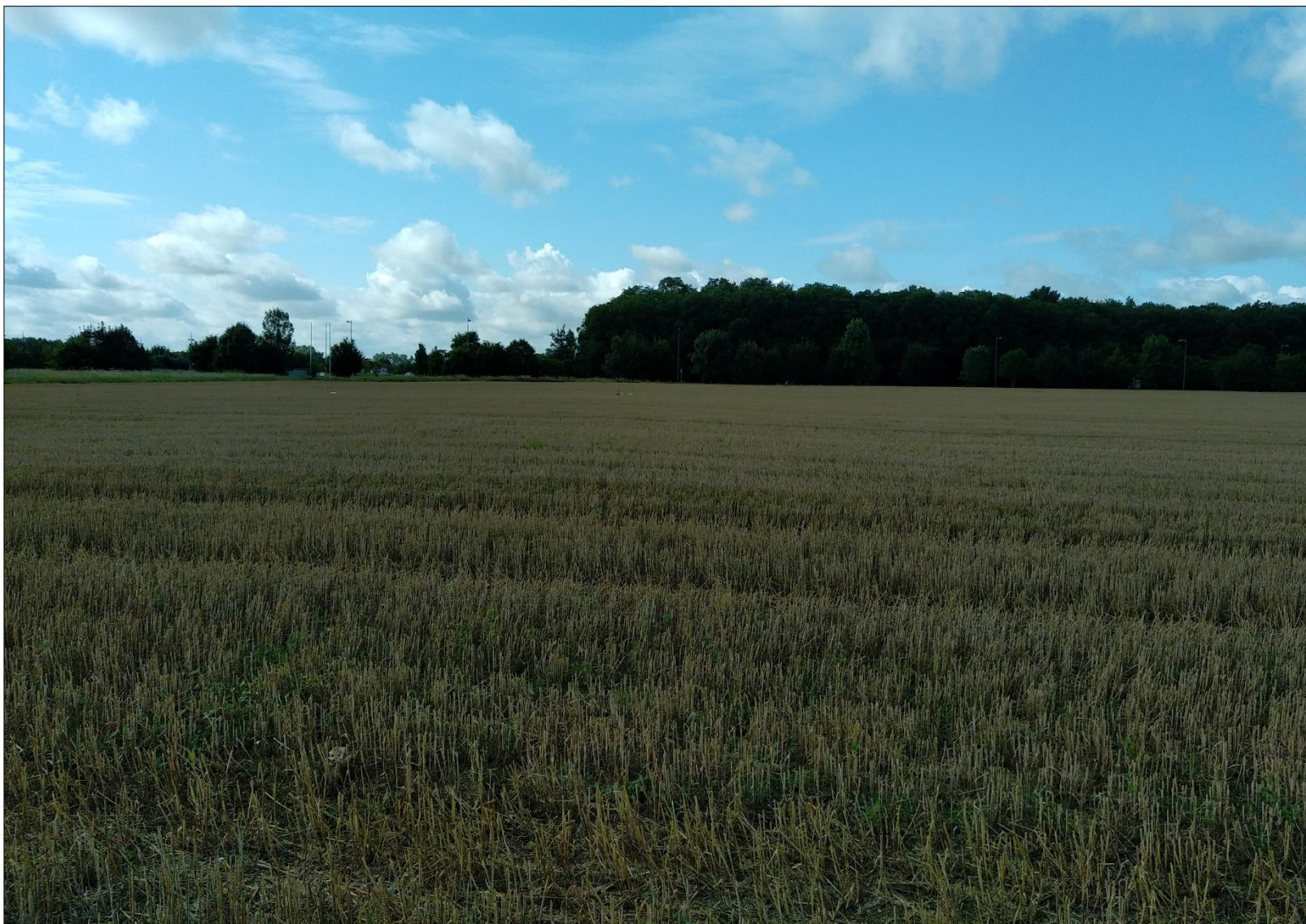
Figure 2 : Prise de vue n°2