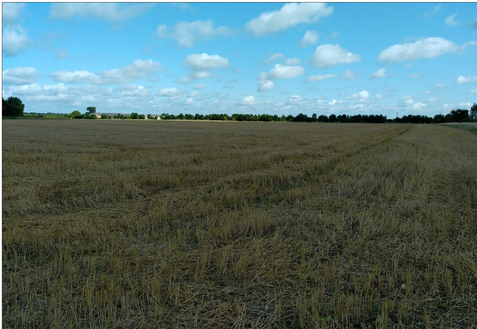
Figure 6 : Prise de vue n°6