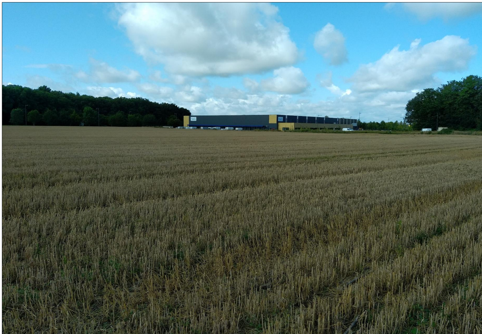
Figure 3 : Prise de vue n°3