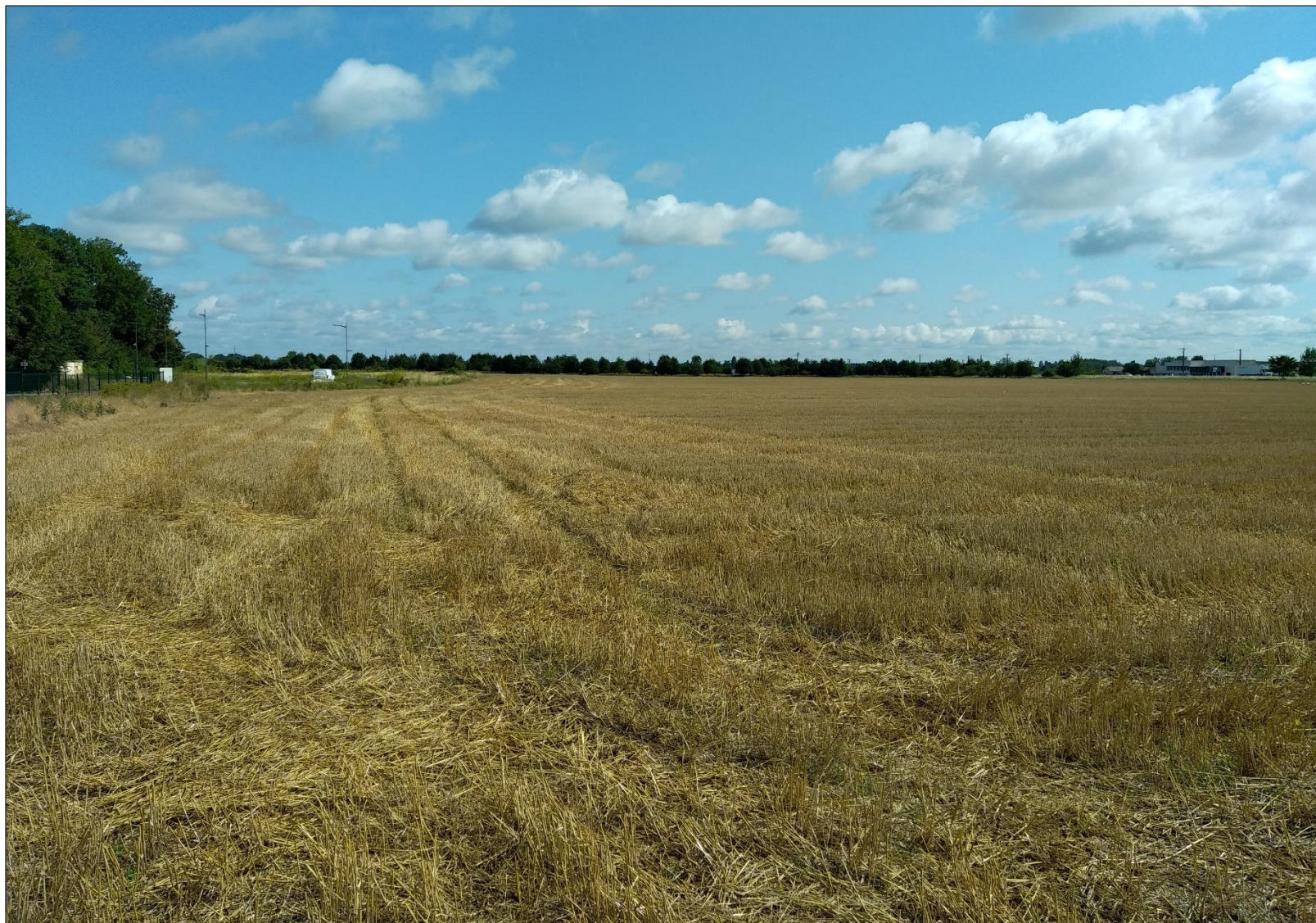
Figure 7 : Prise de vue n°7