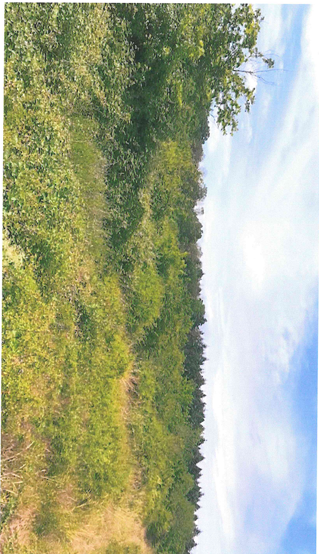
Photographie 1 de la parcelle C- prise le 26 juin 2021