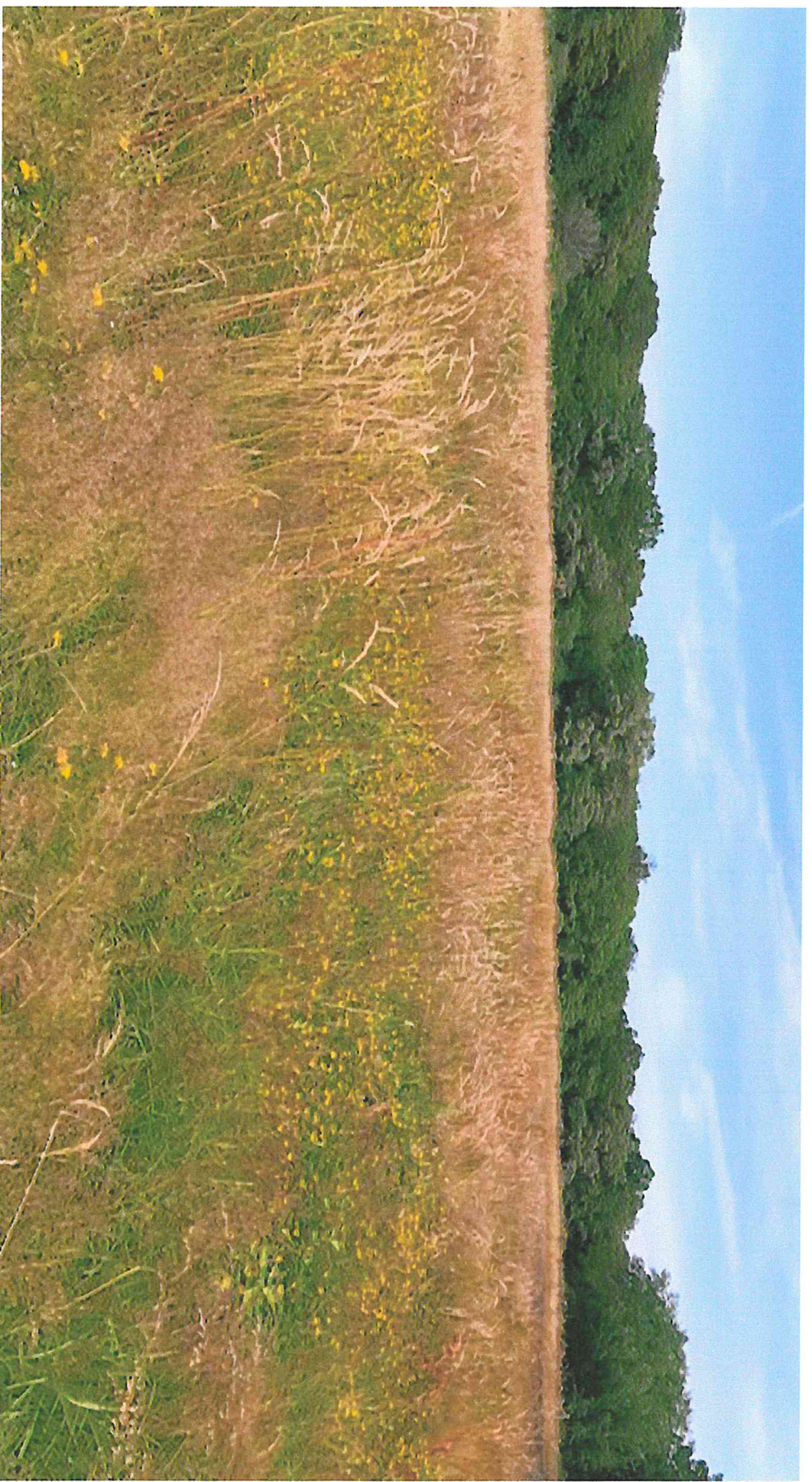
Photographie 3 de la parcelle B- prise le 26 juin 2021