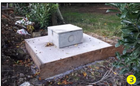
❷ Exemples d'aménagement de tête de forages dédiés à l'irrigation de cultures et aux besoins des cheptels (Photographie : GéoSen – Juil-20)

(D'après l'Arrêté ministériel du 11-sept-03 modifié)