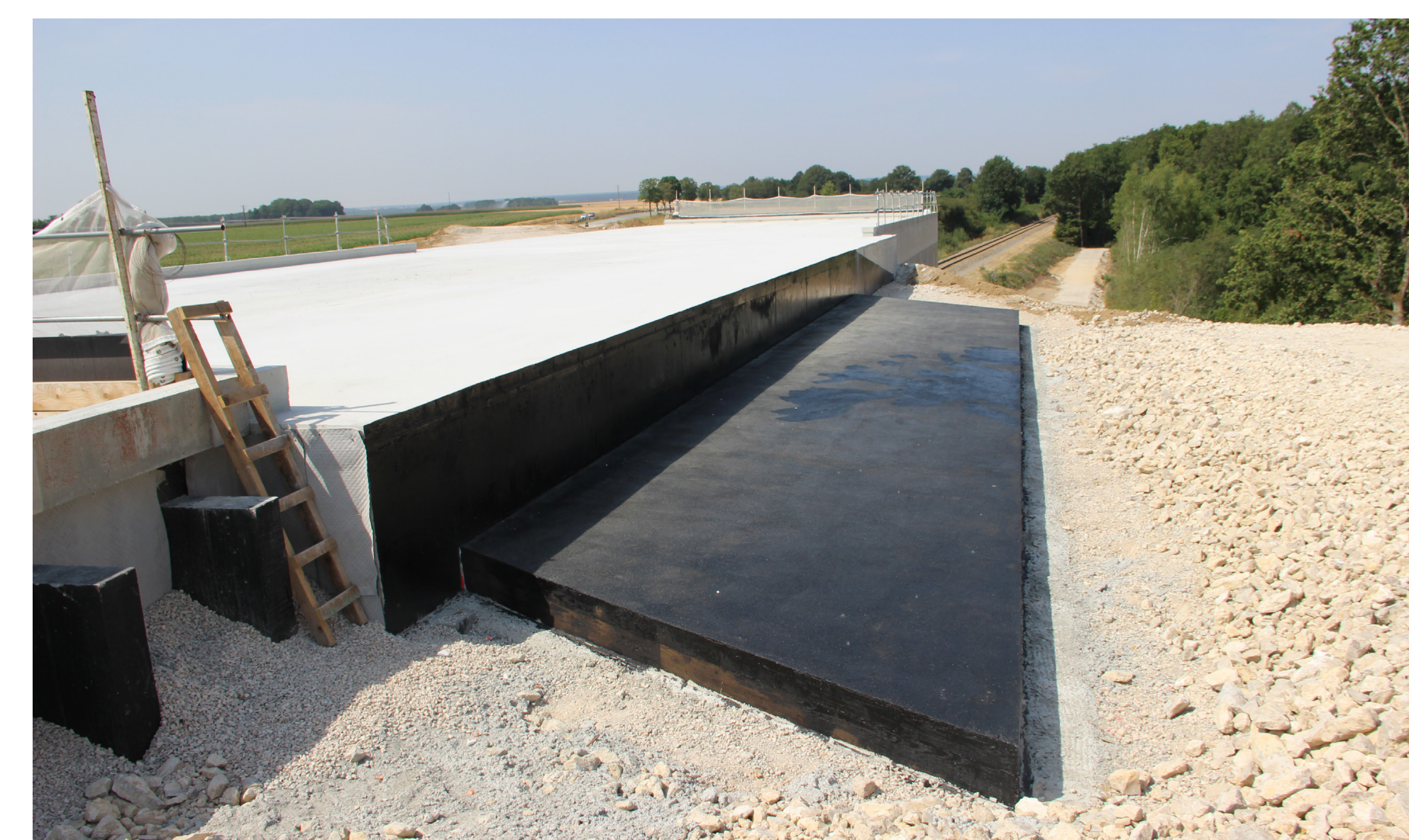
La dalle de transition, permettant la liaison entre l'ouvrage et les remblais, est réalisée.