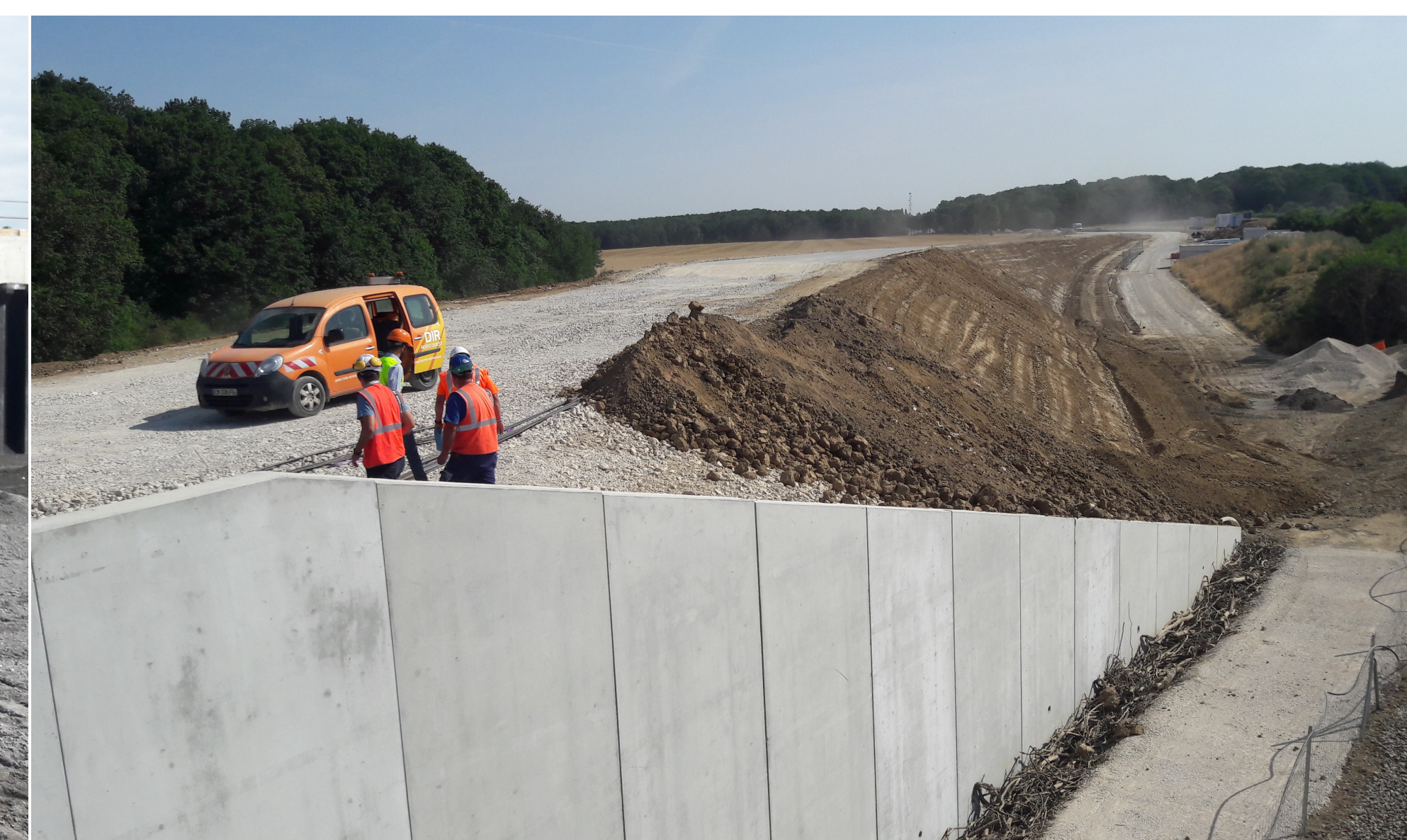
Les remblais proches de l'ouvrage, reposant sur les inclusions rigides, sont installés.