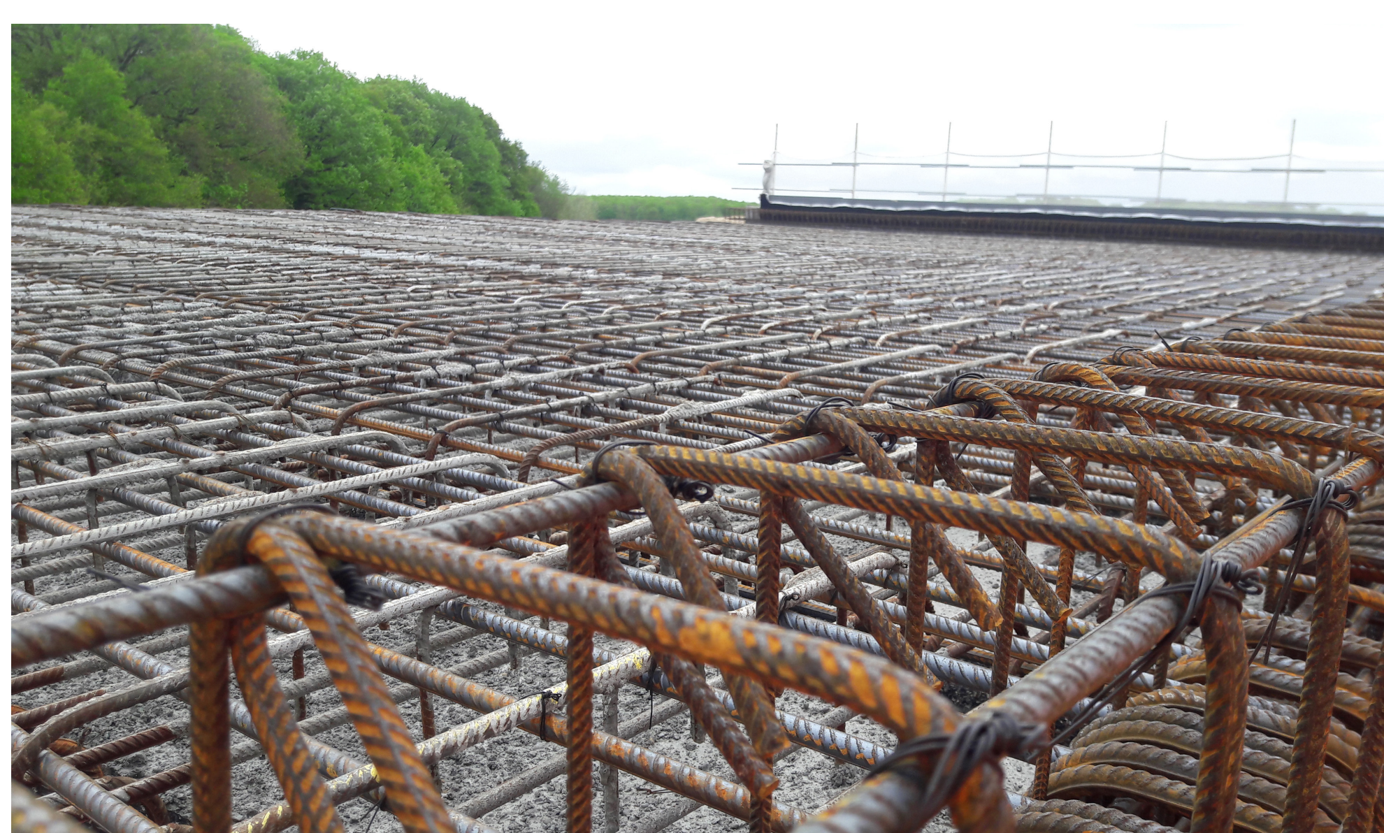
Ferrailage du tablier avant bétonnage