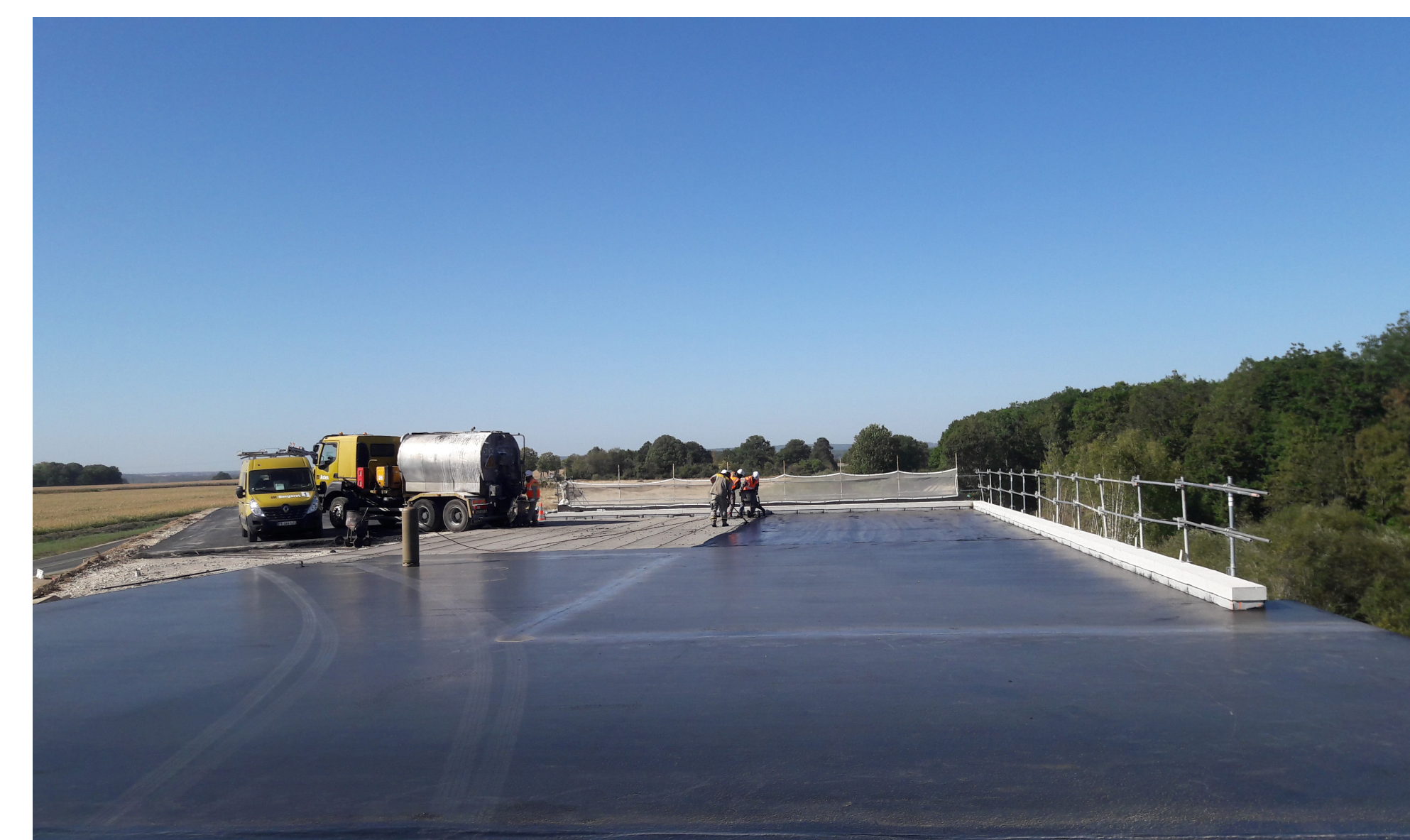
Revêtement de l'ouvrage