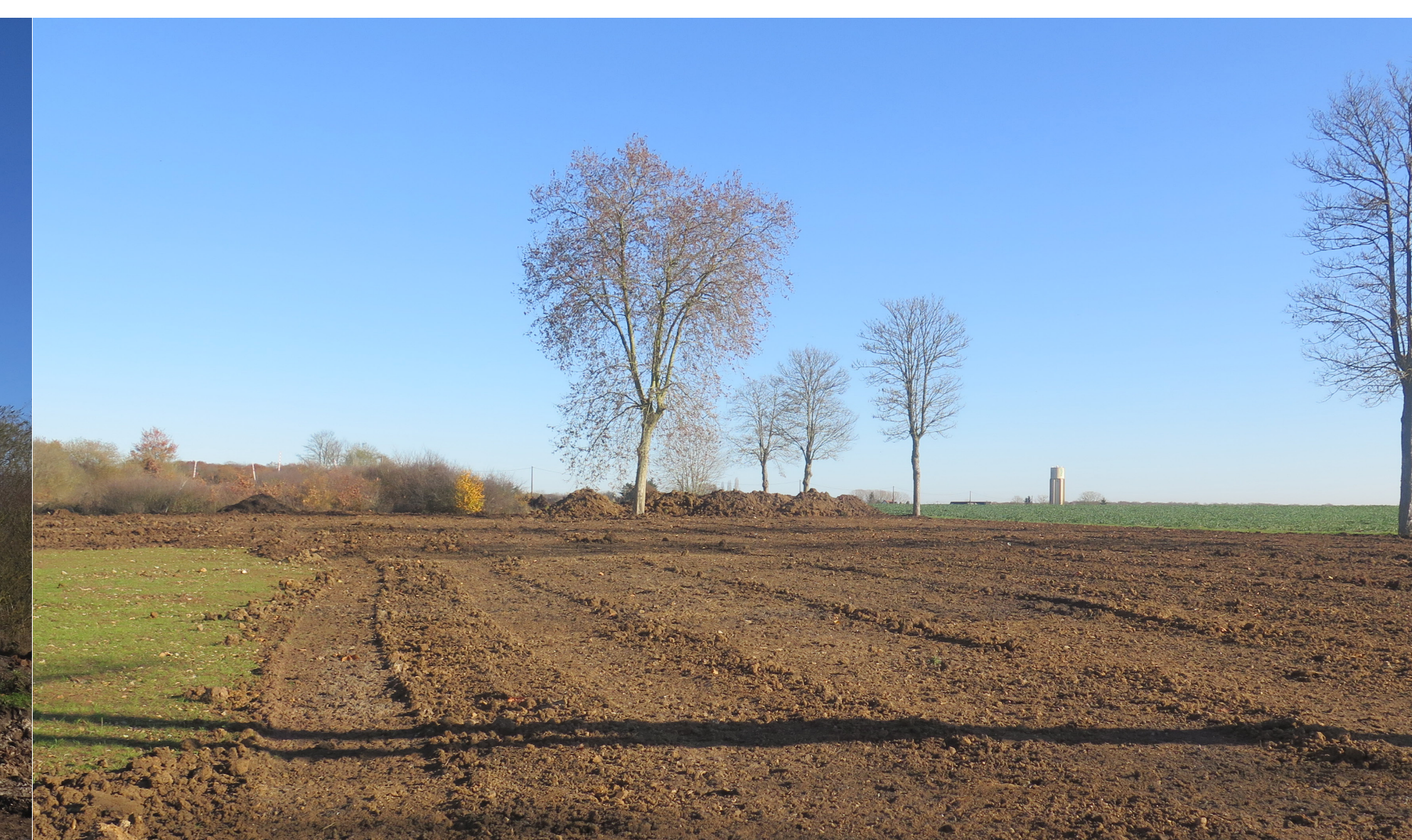
Remise en terre des parcelles