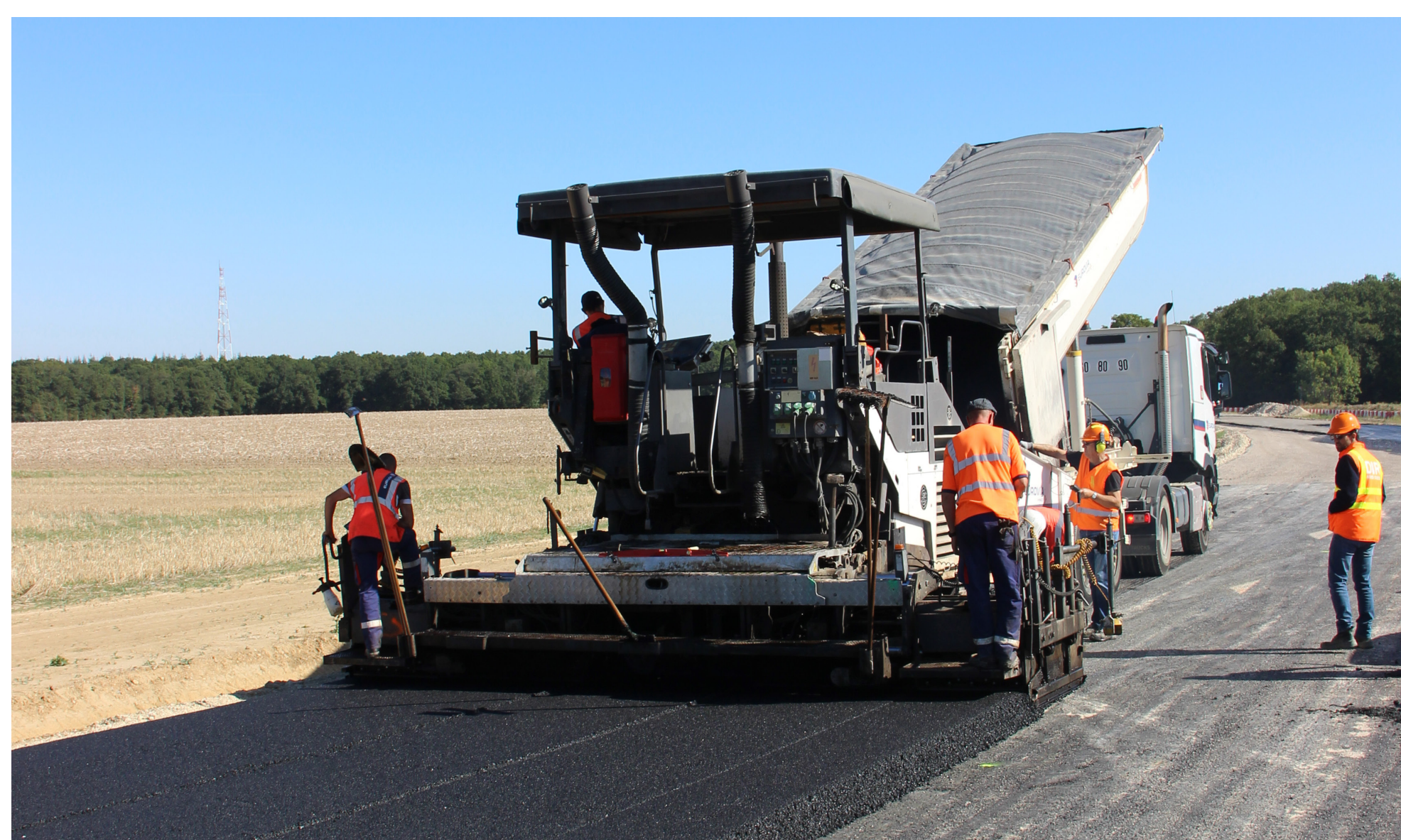
Réalisation de la chaussée