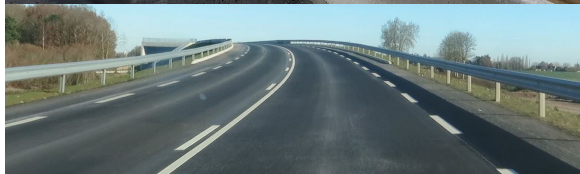
Glissières bétons, glissières et signalisation