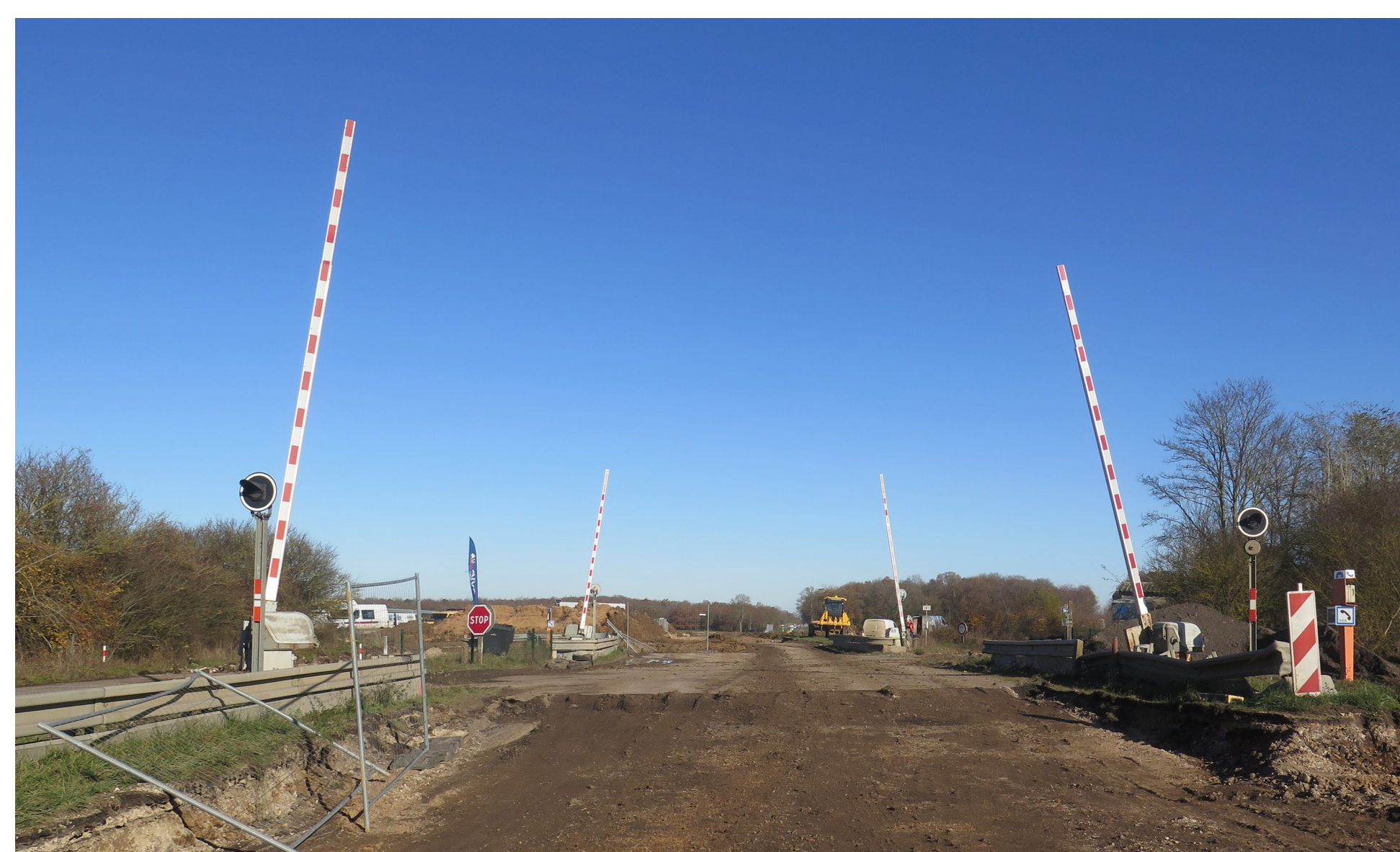
Déconstruction de l'ancienne RN 10