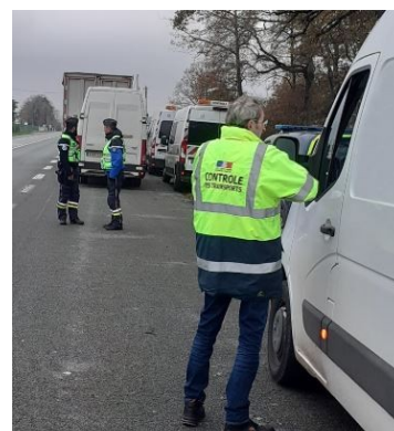
Contrôle du 01/12/2023 sur la RD910 SORIGNY (37)

Neuf opérations de contrôle ciblé sur le territoire régional ont été organisées par la DREAL Centre-Val de Loire, en collaboration avec les forces de l'ordre, l'URSSAF et l'inspection du travail.