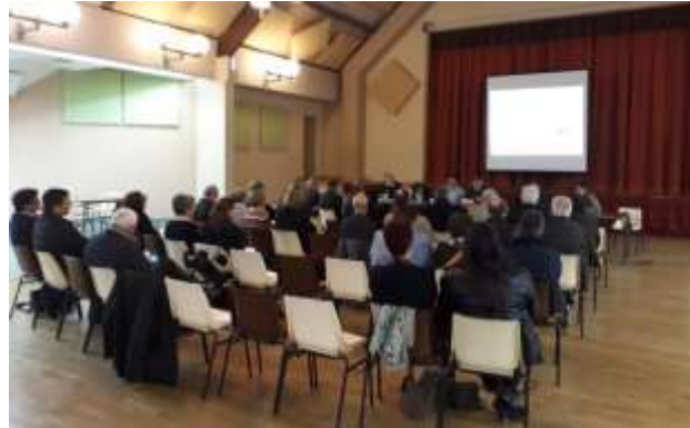
« Groupe mobilité » à Aigurande - Pays de la Châtre en Berry.

Selon un principe similaire, mais adapté au contexte, chaque territoire a également organisé un focus group avec quelques habitants représentatifs de situations différentes, invités à participer à une « conversation » dirigée, autour des questions et enjeux de mobilité au quotidien.