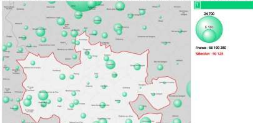
1 Population municipale (historique depuis 1876), 2015