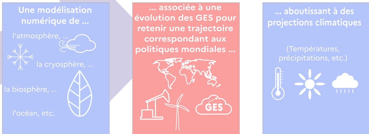
Figure 2 : Des modèles climatiques aux projections climatiques

Ces résultats peuvent ensuite être utilisés afin d'évaluer les impacts du changement climatique pour un territoire, la manière avec laquelle la modification d'un paramètre climatique peut le perturber.