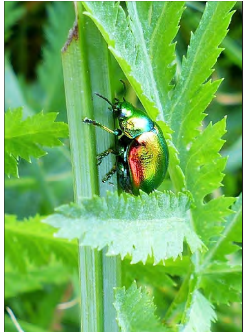
Figure 7. – Chrysolina graminis , une espèce classée dans la catégorie « Menacée au niveau régional ».