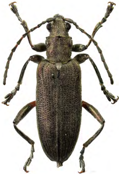
Figure 6. – Donacia cinerea , une espèce classée dans la catégorie « Menacée au niveau régional ». Taille : 8,5 mm.

Les espèces pour lesquelles nous possédons des données récentes en région Centre-Val de Loire sont les suivantes : Donacia aquatica (L.,