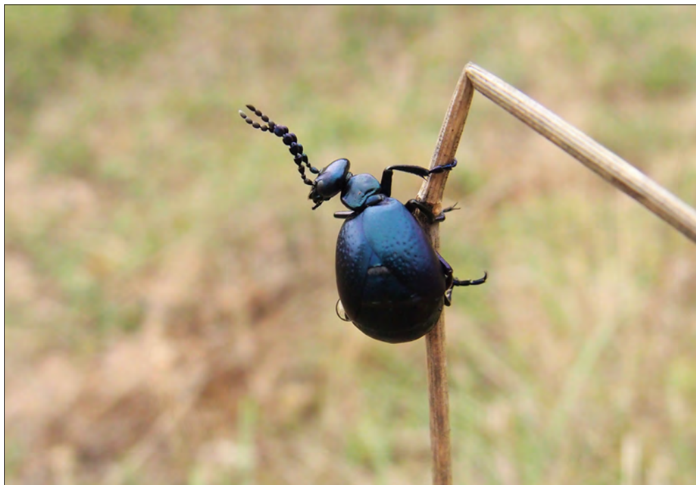
Figure 8. – Meloe autumnalis, une espèce classée dans la catégorie « Données insuffisantes ».