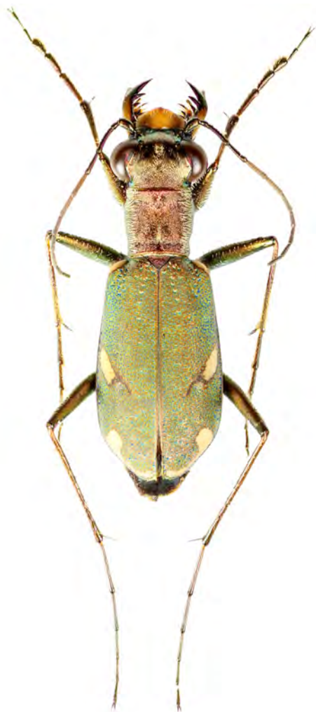
Figure 2. – Cylindera germanica , une espèce considérée disparue de la Région Centre – Val de Loire. Taille : 10,5 mm.

vallées du Rhône et de la Saône [BONADONA, 1971 ; COULON & PUIPIER in TRONQUET, 2014]. Il est cité de Beaugency pour le Loiret (ex coll. de Givenchy), cité par MALLET [1968], localité douteuse d'après MACHARD [1975], « bien qu'également connu autrefois de la forêt de Fontainebleau » (Seine-et-Marne). Il existe également, dans la collection Sainjon, pour le Loiret, des exemplaires étiquetés d'Orléans et de Gien. Calosoma maderae était aussi connu du département de l'Yonne [SAINTE-CLAIRE DEVILLE, 1935-1938]. Nous possédons