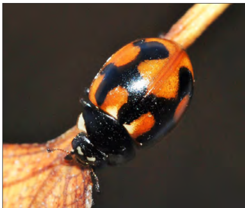
Figure 5. – Coccinella hieroglyphica , une espèce classée dans la catégorie « Menacée au niveau régional ».

Cette espèce, inapte au vol, est liée aux pelouses xériques et ne se trouve guère que dans les pelouses calcicoles en région Centre – Val de Loire. Ces milieux ont nettement régressé depuis soixante ans, du fait de la déprise agricole, et de nombreux sites ont évolué vers une fermeture par des petits ligneux (Cornouillers, Aubépines, Épine-vinette, Érable champêtre, Rosiers, Prunelliers...). L'examen des collections