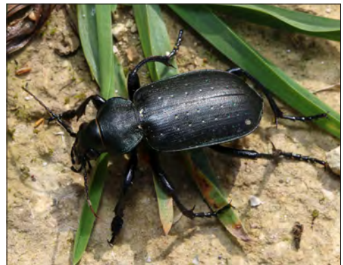
Figure 4. – Calosoma auropunctatum , une espèce classée dans la catégorie « Menacée au niveau régional ».

Dans la région, les données historiques concernent les communes d'Orléans et de Beaugency (seconde moitié du xix e siècle et début xx e siècle) dans le Loiret [MACHARD, 1968; SECCHI et al. , 2009]. Il était également présent dans les champs et les vignobles, à Mer et à Sérès [FROBERVILLE, 1898 in MACHARD, 1989]. L'espèce aurait également été observée en Eure-et-Loir [LA PERRAUDIÈRE, 1911].