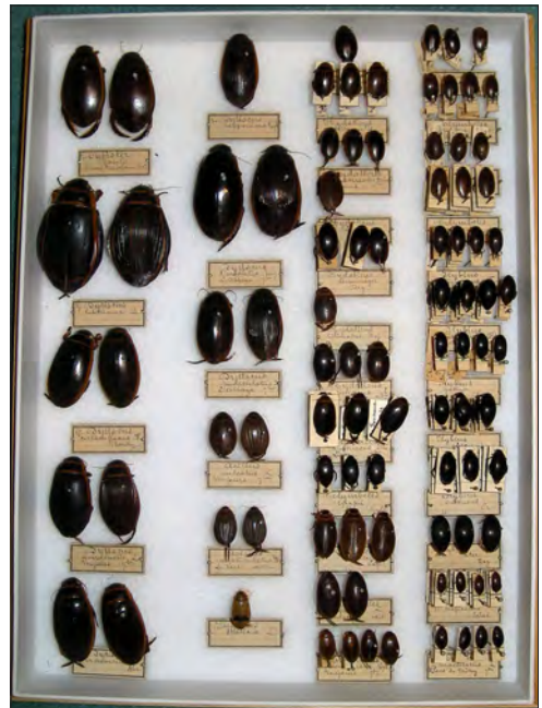
Figure 1. – Collection historique de Coléoptères Dytiscidés (collection Aster Peuvrier, 1857 – 1936).