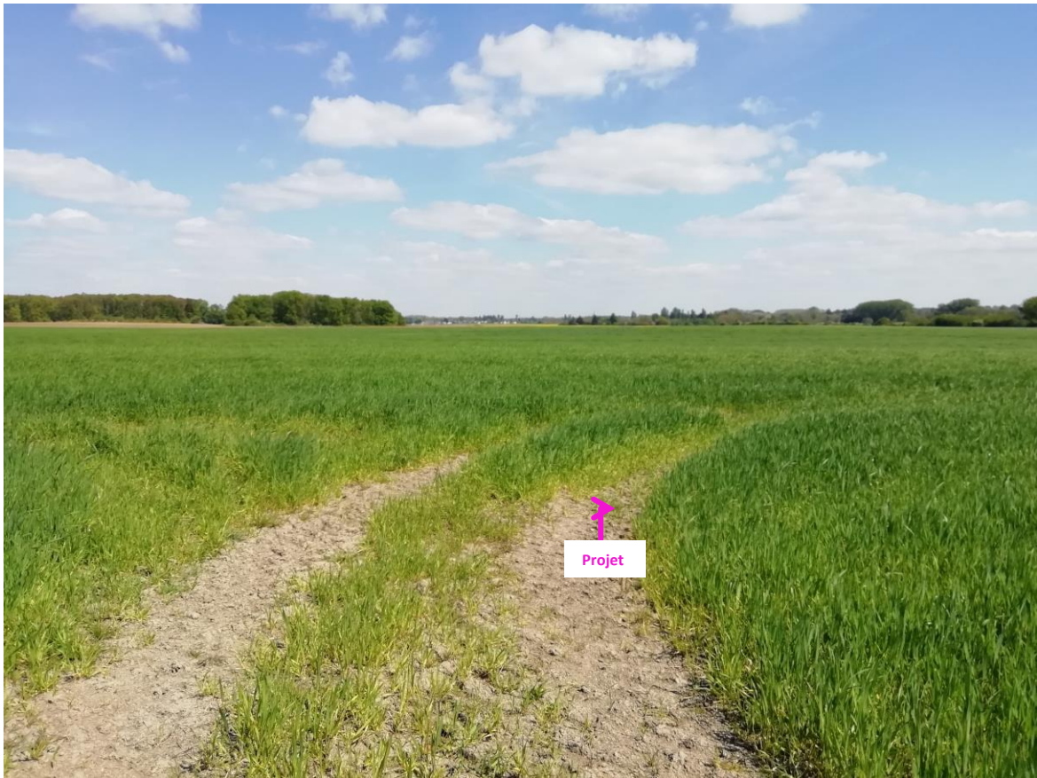
Photographies du 23/04/2024 permettant de situer le projet dans son paysage lointain