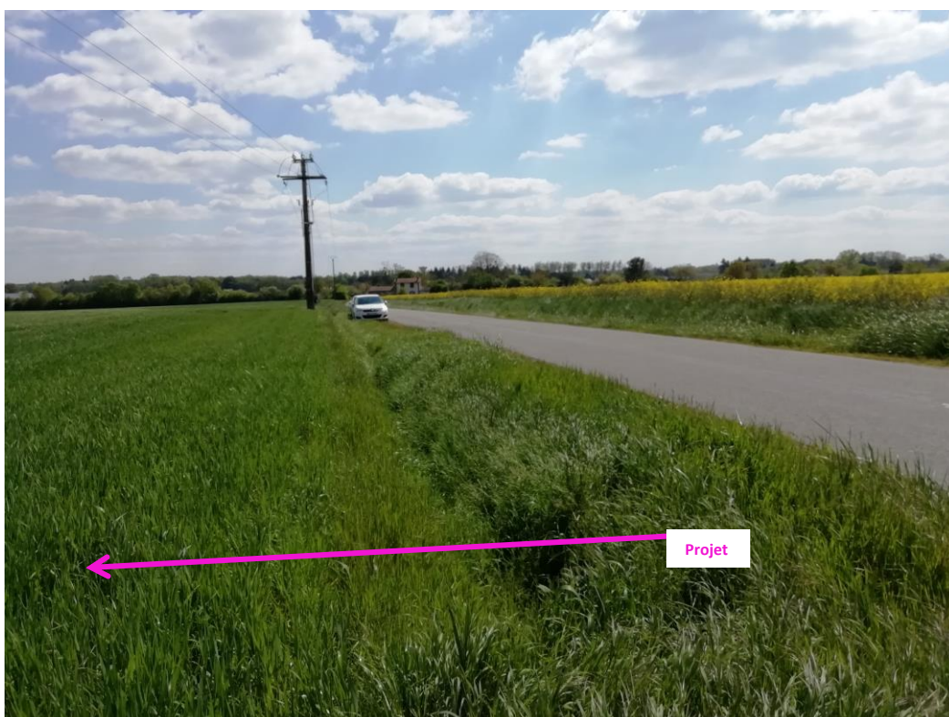
Photographies du 23/04/2024 permettant de situer le projet dans son paysage lointain