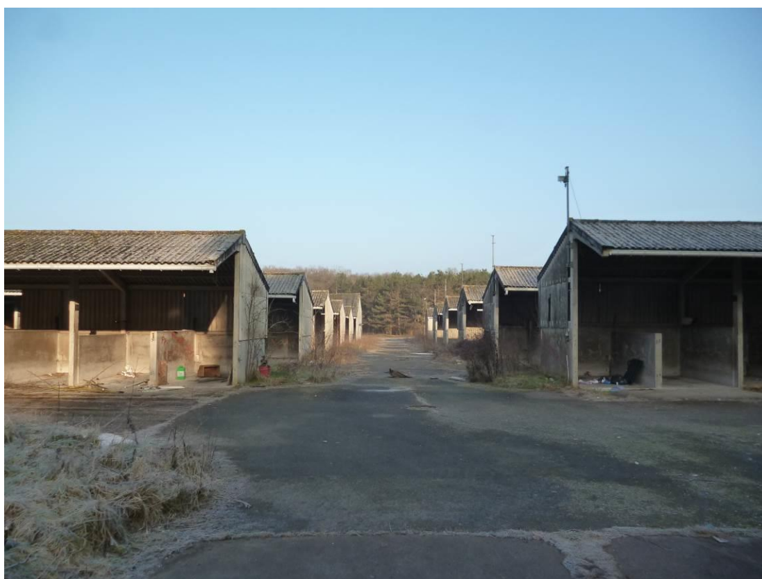
Vue H : Vue des bâtiments vers le nord de la parcelle