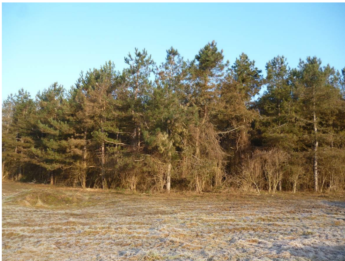
Vue E : Vue vers le nord