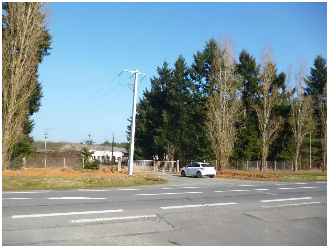
Vue I : Vue de l'entrée du site depuis l'autre côté de l'avenue