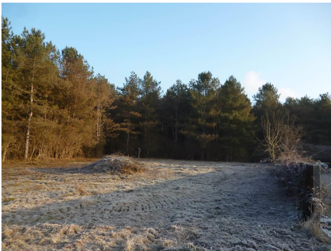
Vue F : Vue vers le nord-est depuis le centre de la parcelle