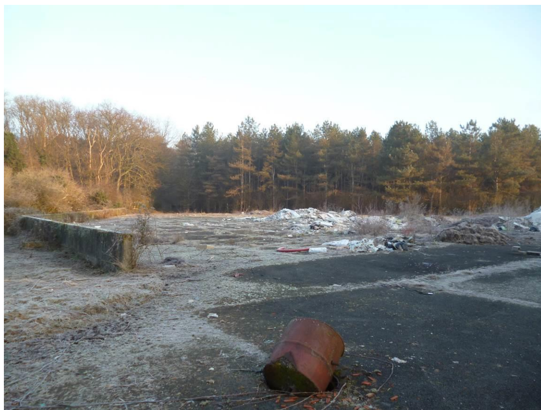
Vue D : Vue vers le nord-est de la parcelle depuis la limite de propriété ouest