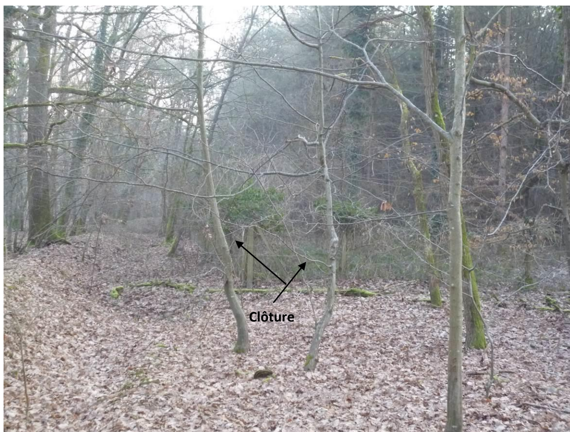
Vue K : Clôture de la limite de propriété nord de la parcelle