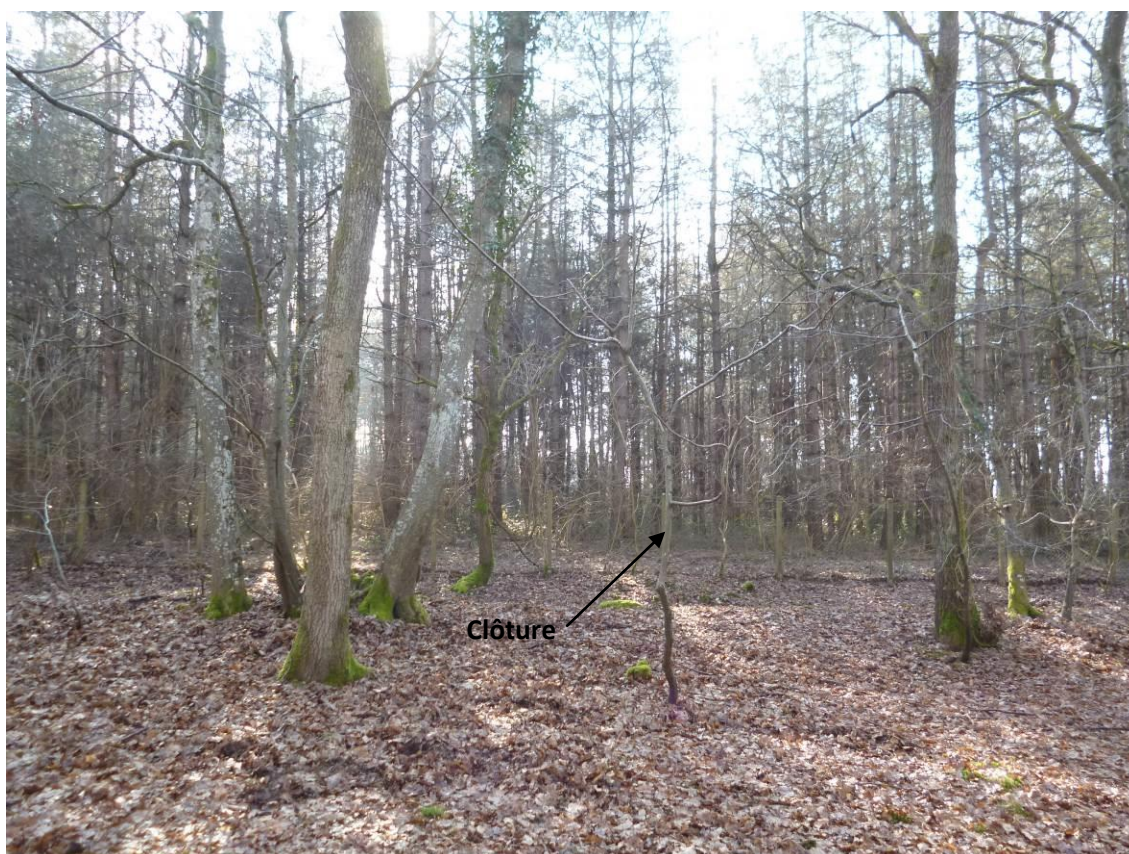
Vue L : Vue sur le site, orientée vers le sud, depuis la forêt