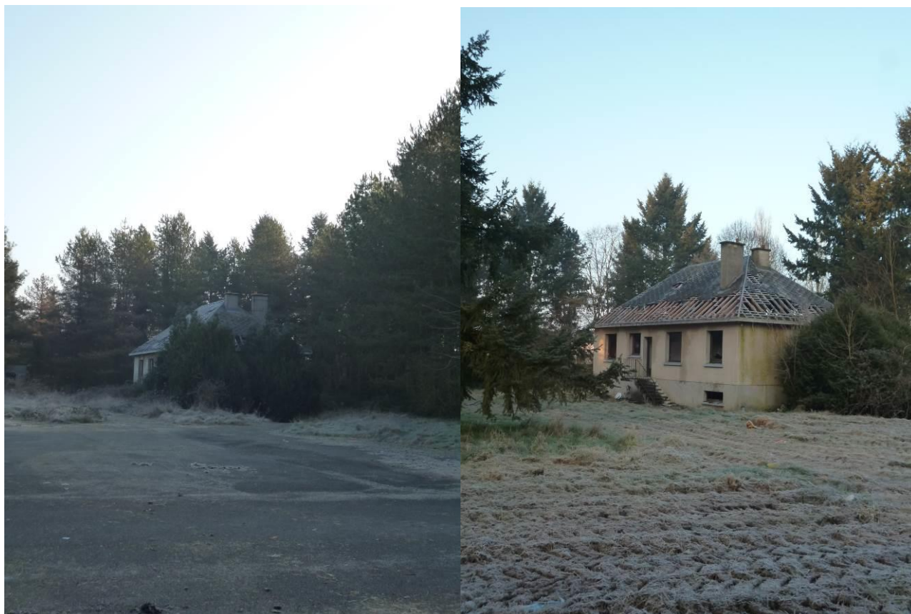
Vues B : Vue depuis l'entrée vers l'ouest (B 1 à gauche) et l'est (B 2 à droite)