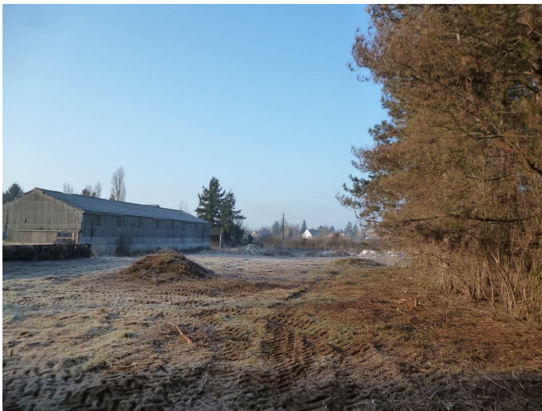
Vue G : Vue vers le nord-est depuis le centre de la parcelle