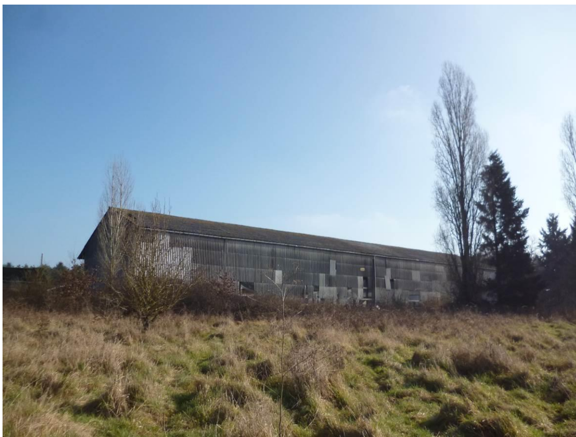
Vue J : Vue de l'arrière du bâtiment ouest depuis la parcelle voisine