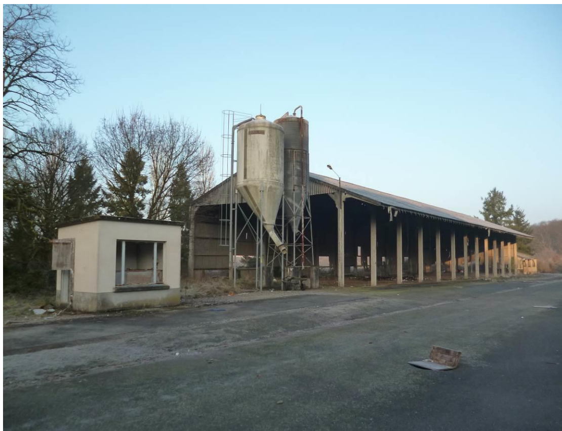
Vue C : Vue sur le hangar côté ouest de la parcelle