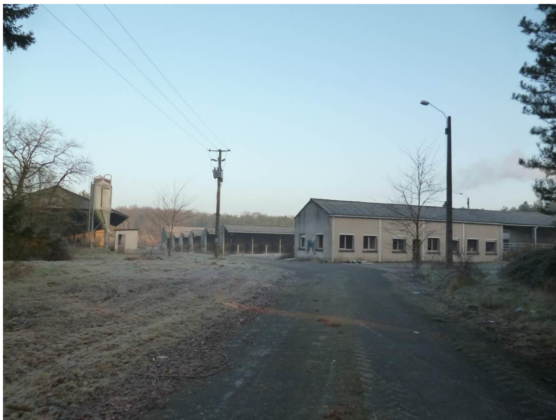
Vue A : Vue depuis l'entrée vers le nord de la parcelle