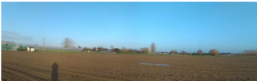
Panorama n°2 : vue du centre du projet vers l'ouest