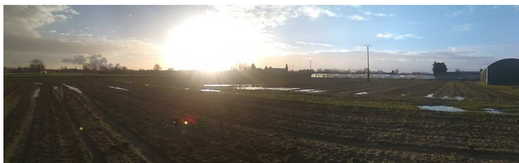
Panorama n°4 : vue du centre du projet vers le sud