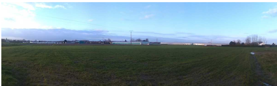
Panorama n°6 : vue du « coin » nord-ouest du projet vers le sud-est