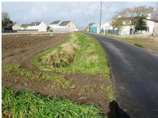
Photo n°9 : Exutoire du bassin versant sud - fossé des eaux pluviales