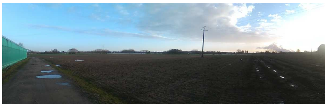
Panorama n°8 : vue du « coin » sud-est du projet vers le nord-ouest