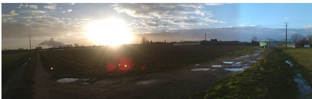
Panorama n°7 : vue du « coin » sud-ouest du projet vers le nord-est