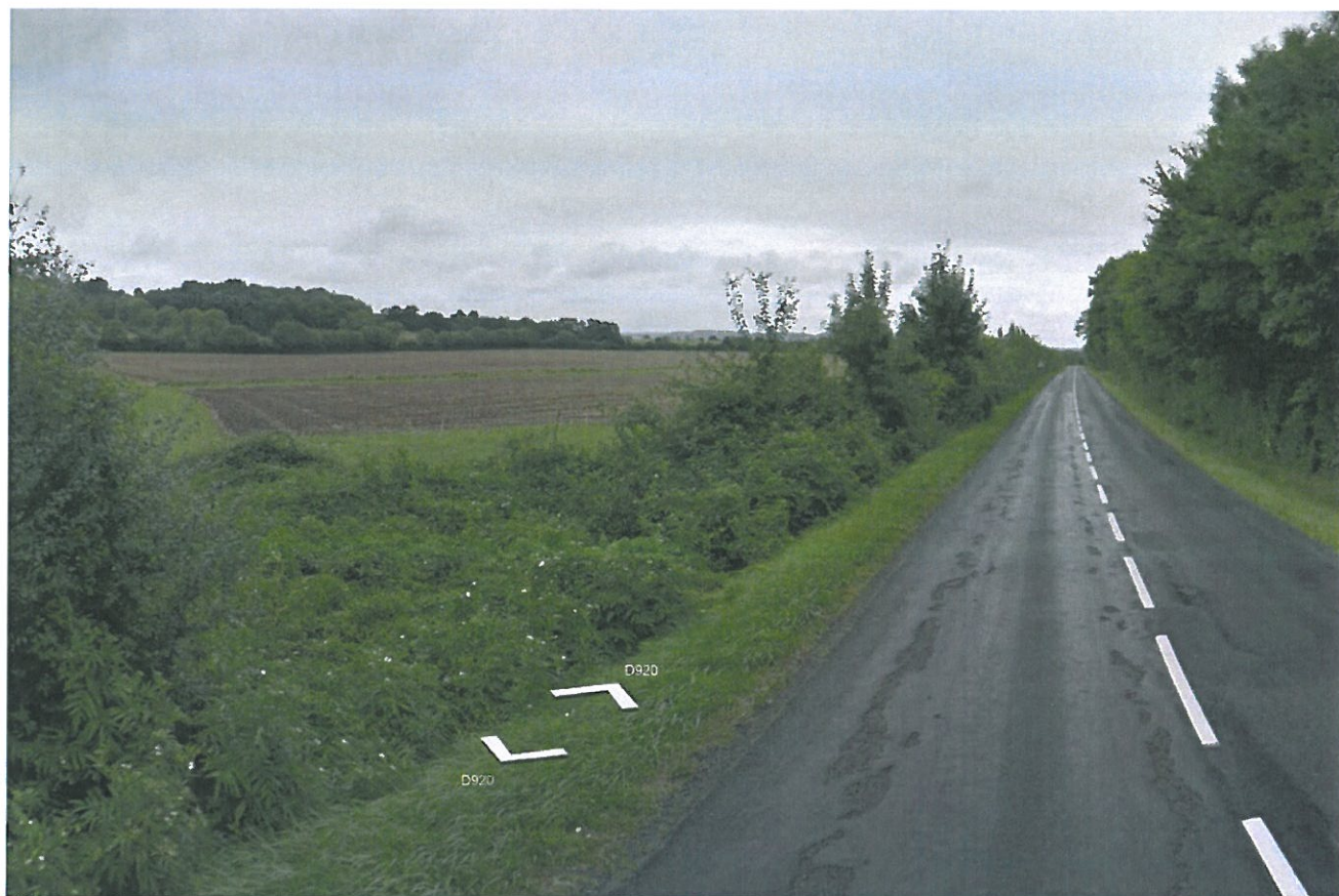
Prise de vue n°9