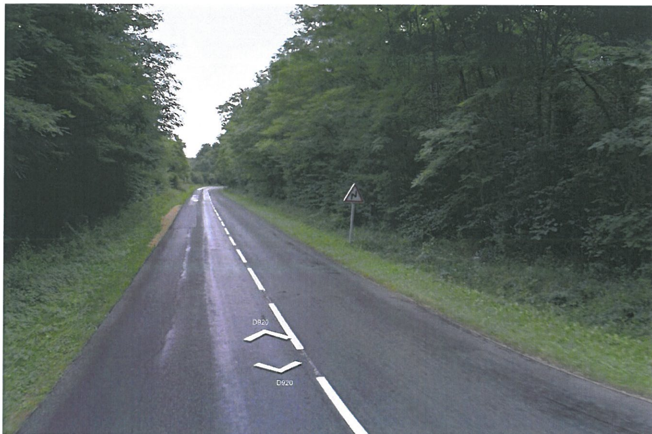
Prise de vue n°5