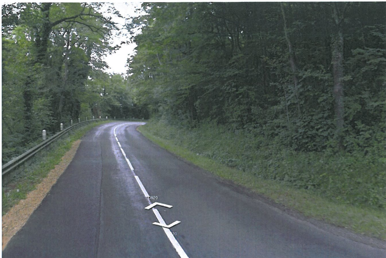
Prise de vue n°7