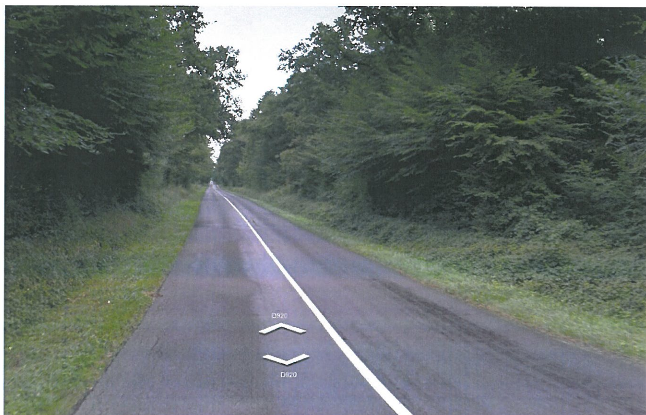
Prise de vue n°2