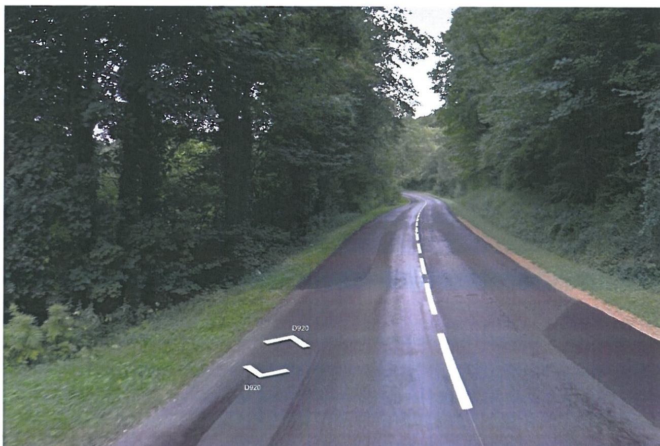
Prise de vue n°6