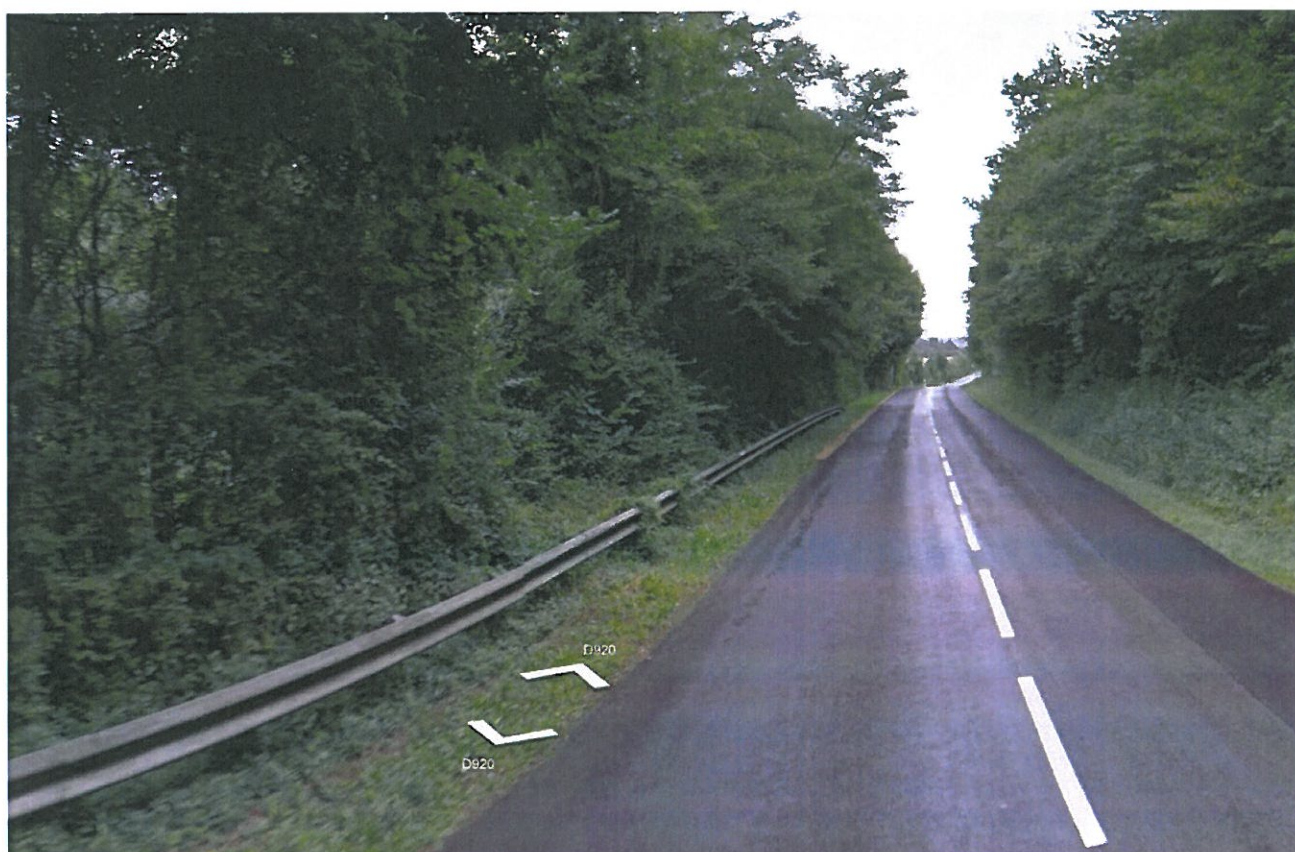
Prise de vue n°8