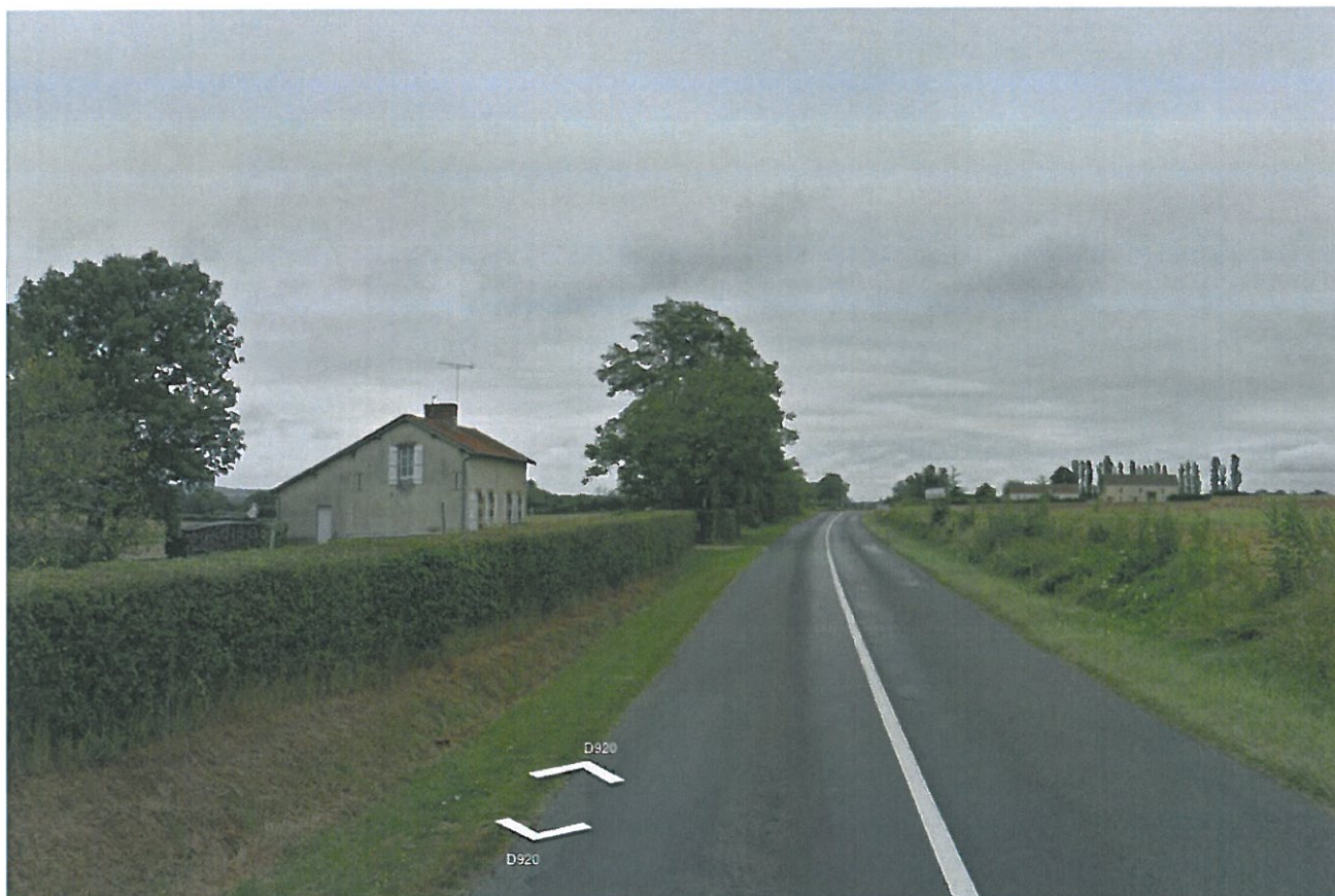
Prise de vue n°11