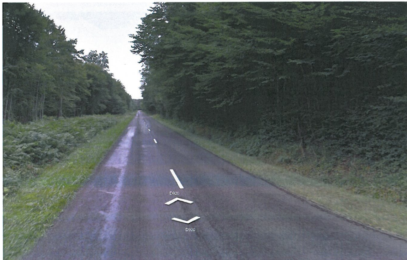
Prise de vue n°4