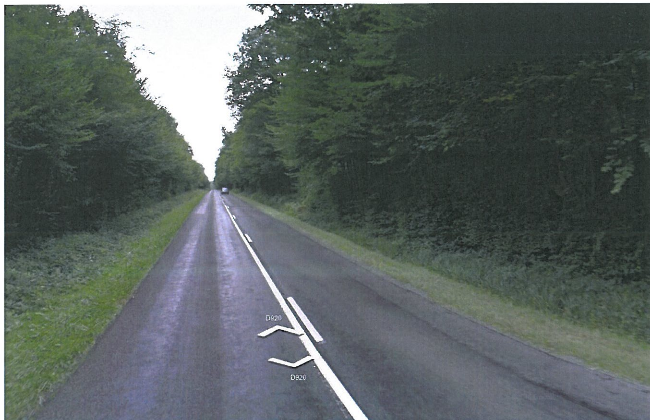
Prise de vue n°3