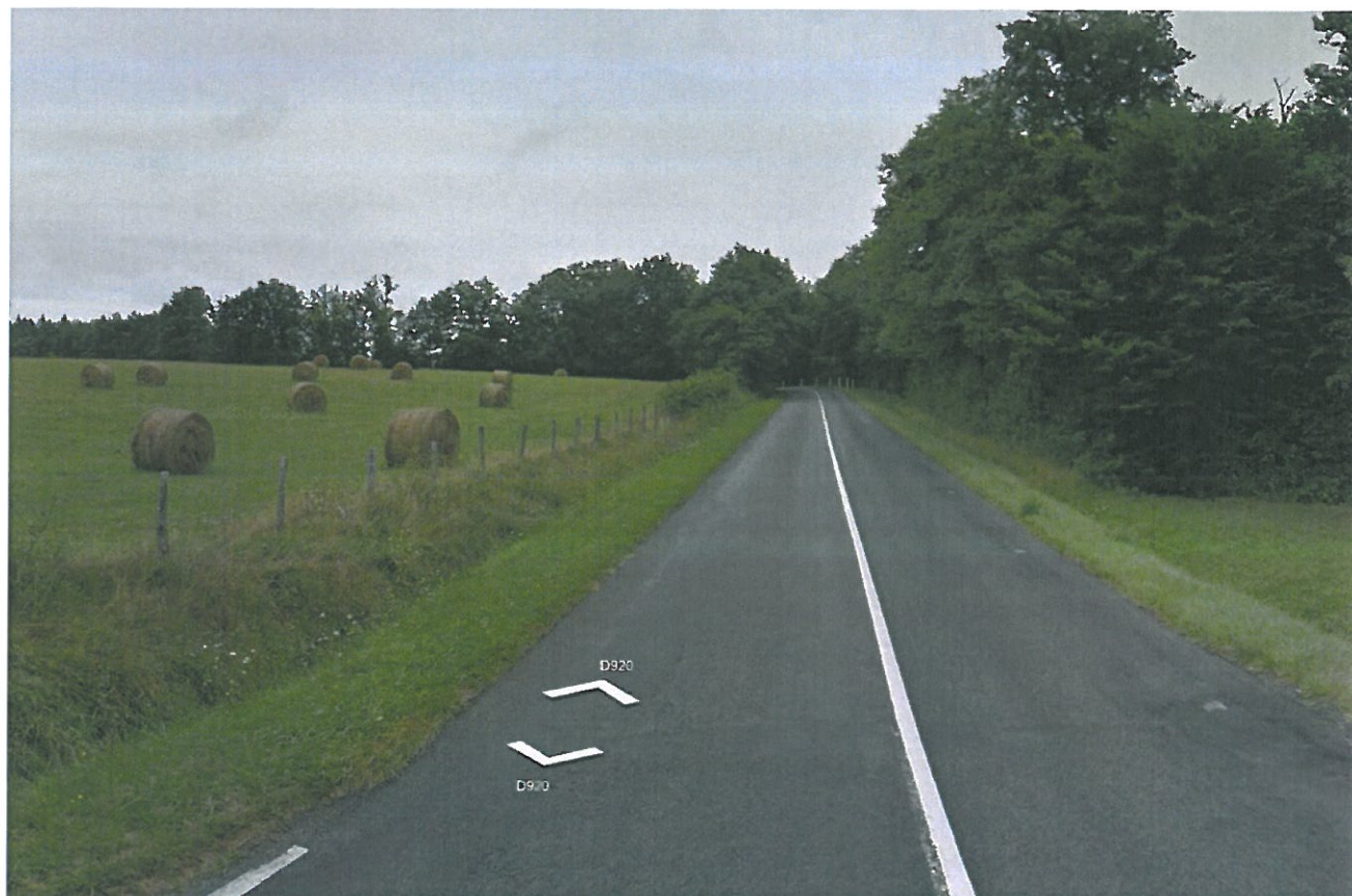
Prise de vue n°1