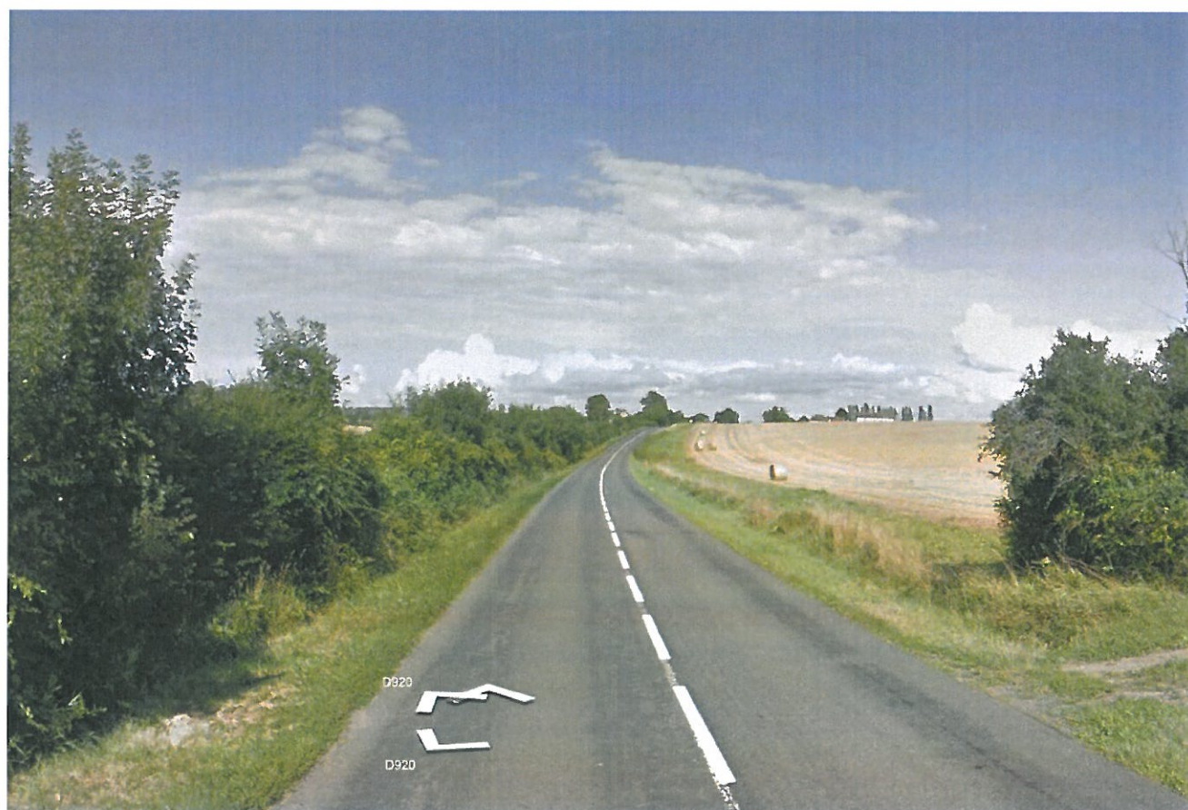
Prise de vue n°10