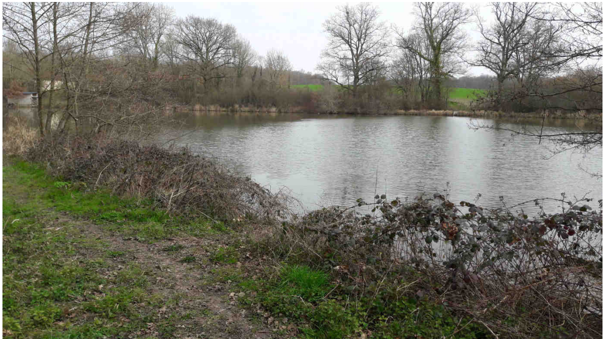
Photographie du 22/03/2016 permettant de situer le projet dans son paysage proche et lointain

Photographies datées de la zone d'implantation avec localisation cartographique des prises de vue