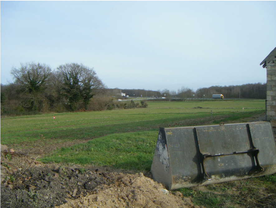
5 Vue lointaine nord est :