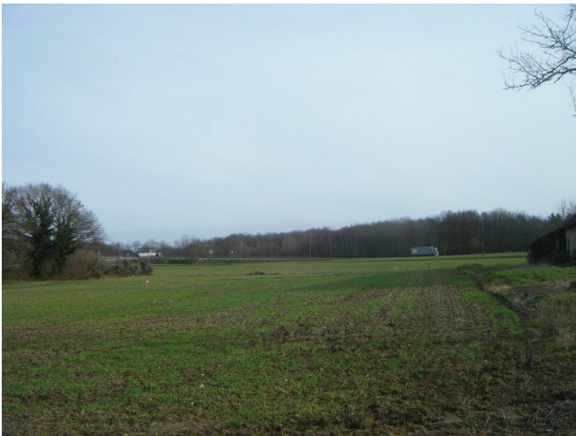
2 Vue est :