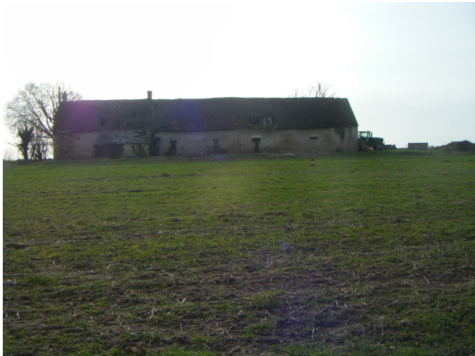
4 Vue sud :