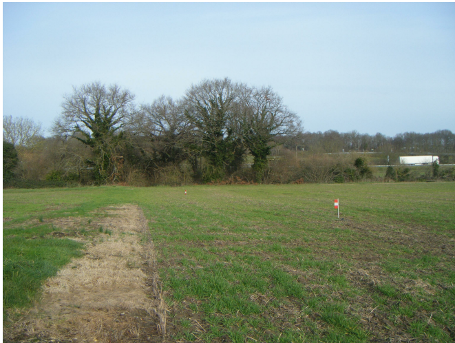
1 Vue nord :