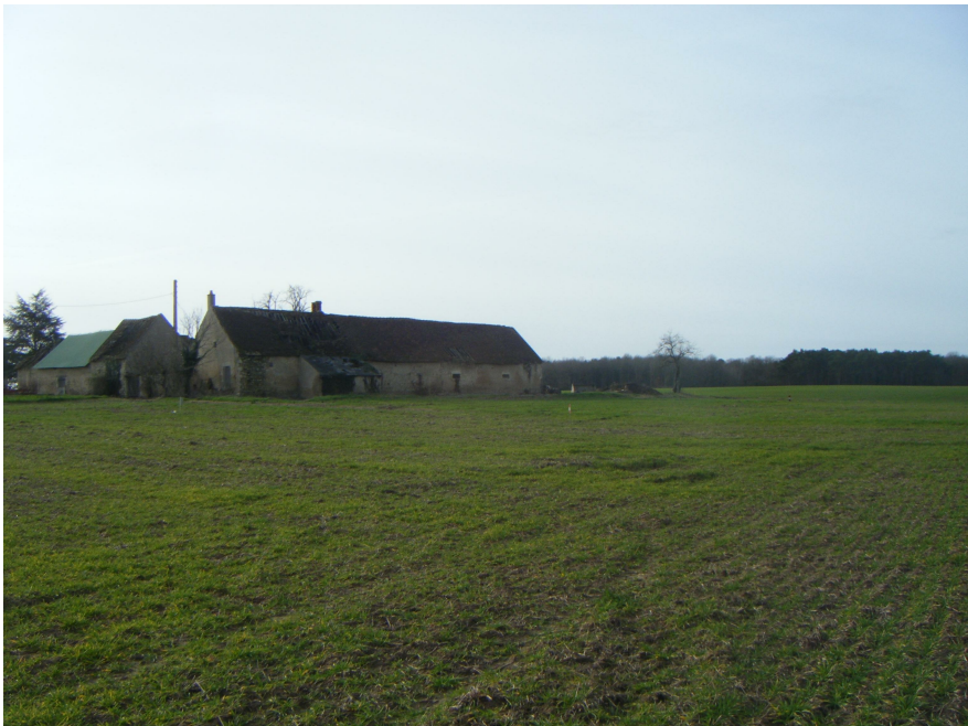
6 Vue lointaine sud ouest :