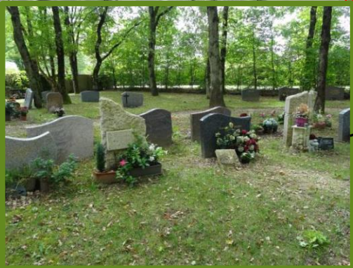
Zones des sépultures paysagères 1,7 ha ≈ 1500 sépultures