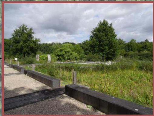
Jardin du Souvenir