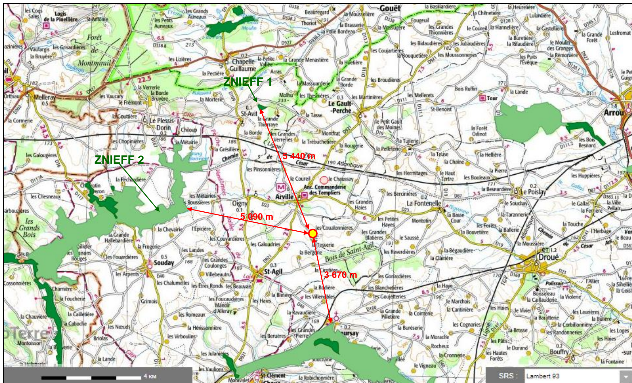
Situation du forage projeté par le G.A.E.C. JAC à LA THEVERIE (COUËTRON-AU-PERCHE – 41) par rapport aux ZNIEFF 1 et 2 définies pour la préservation du patrimoine naturel