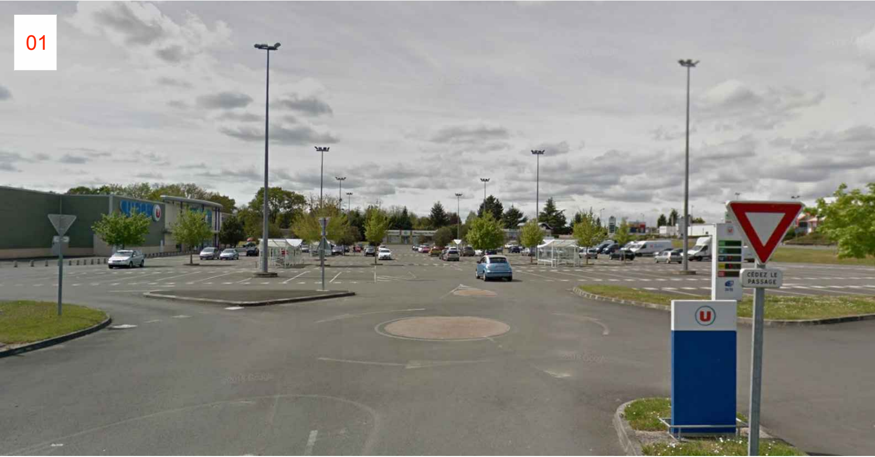
Repérage de la vue