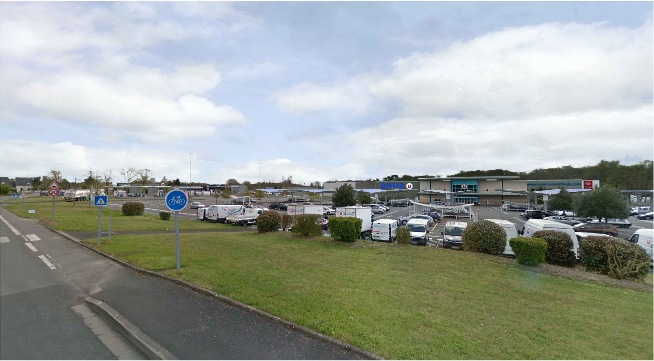
Repérage de la vue