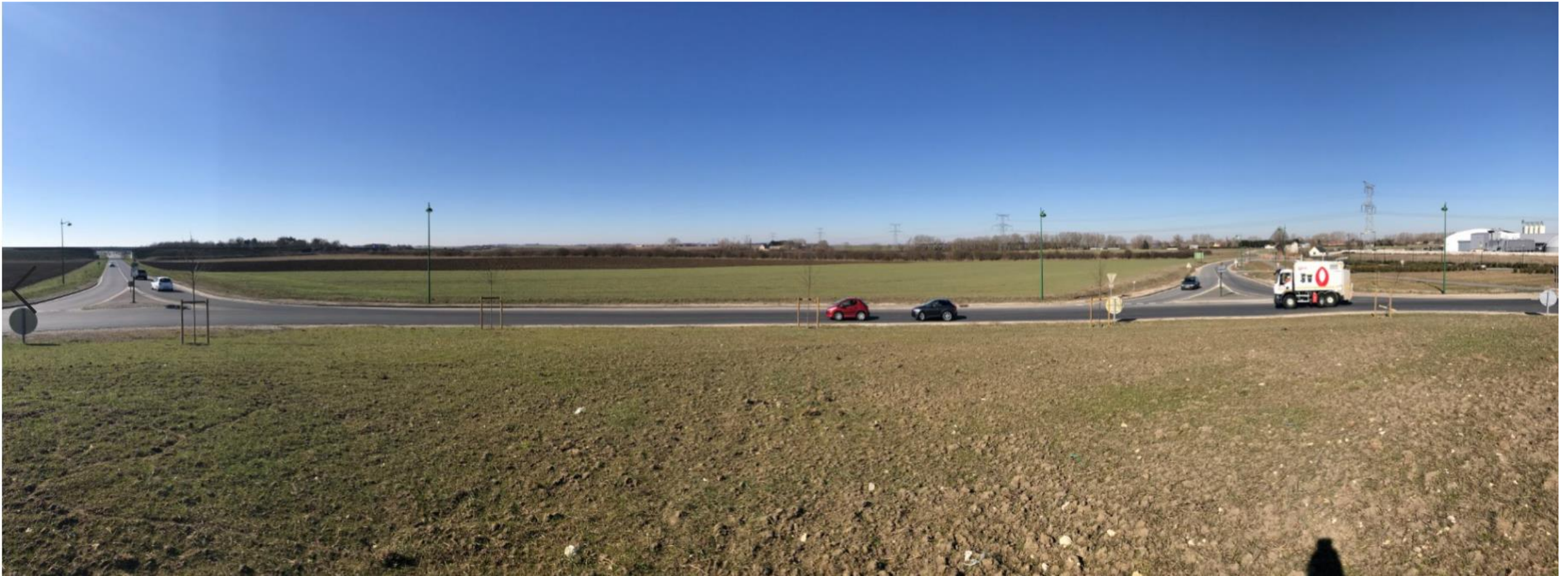
Prise de vue 2 – date : 25/02/2019