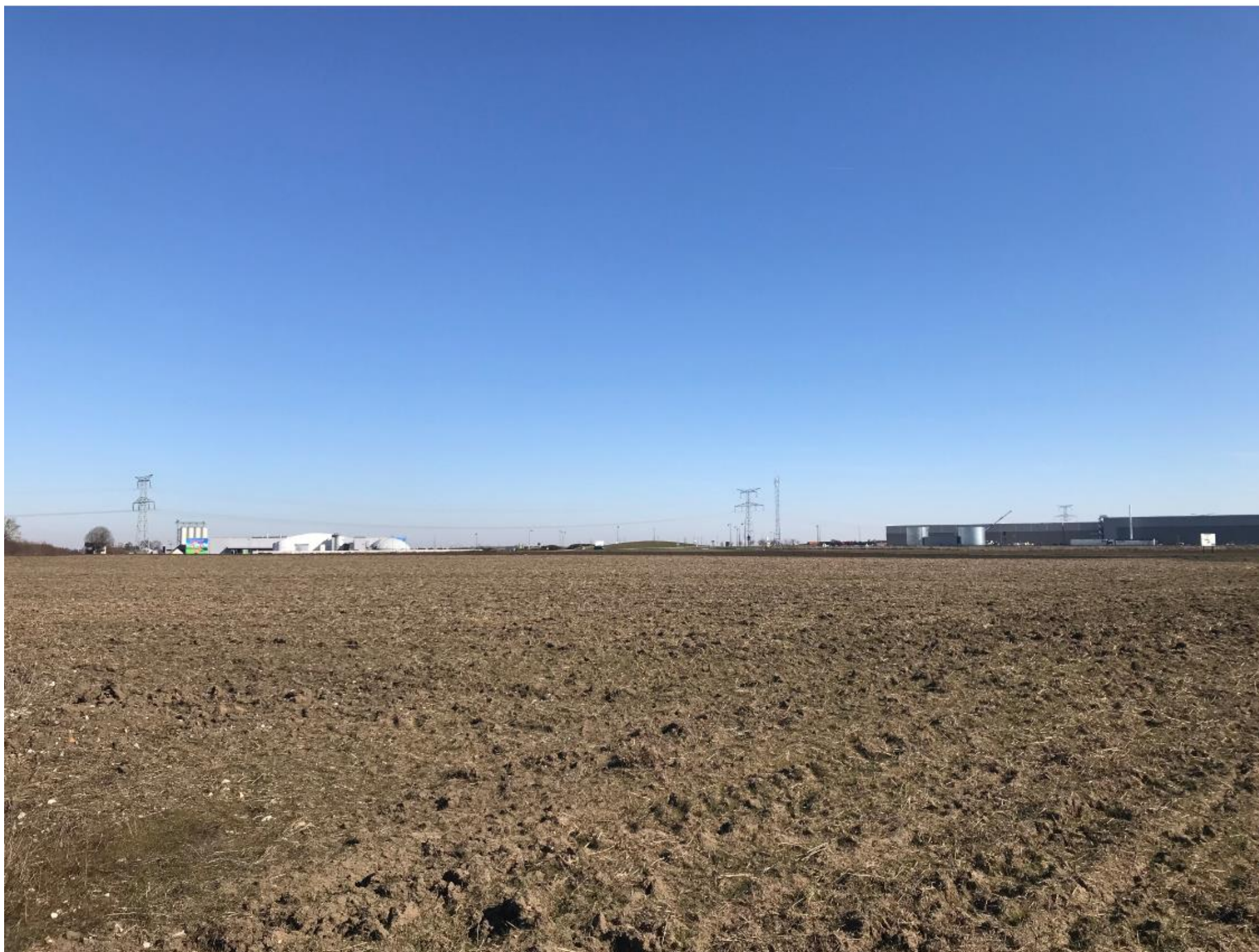
Prise de vue 4 – date : 25/02/2019