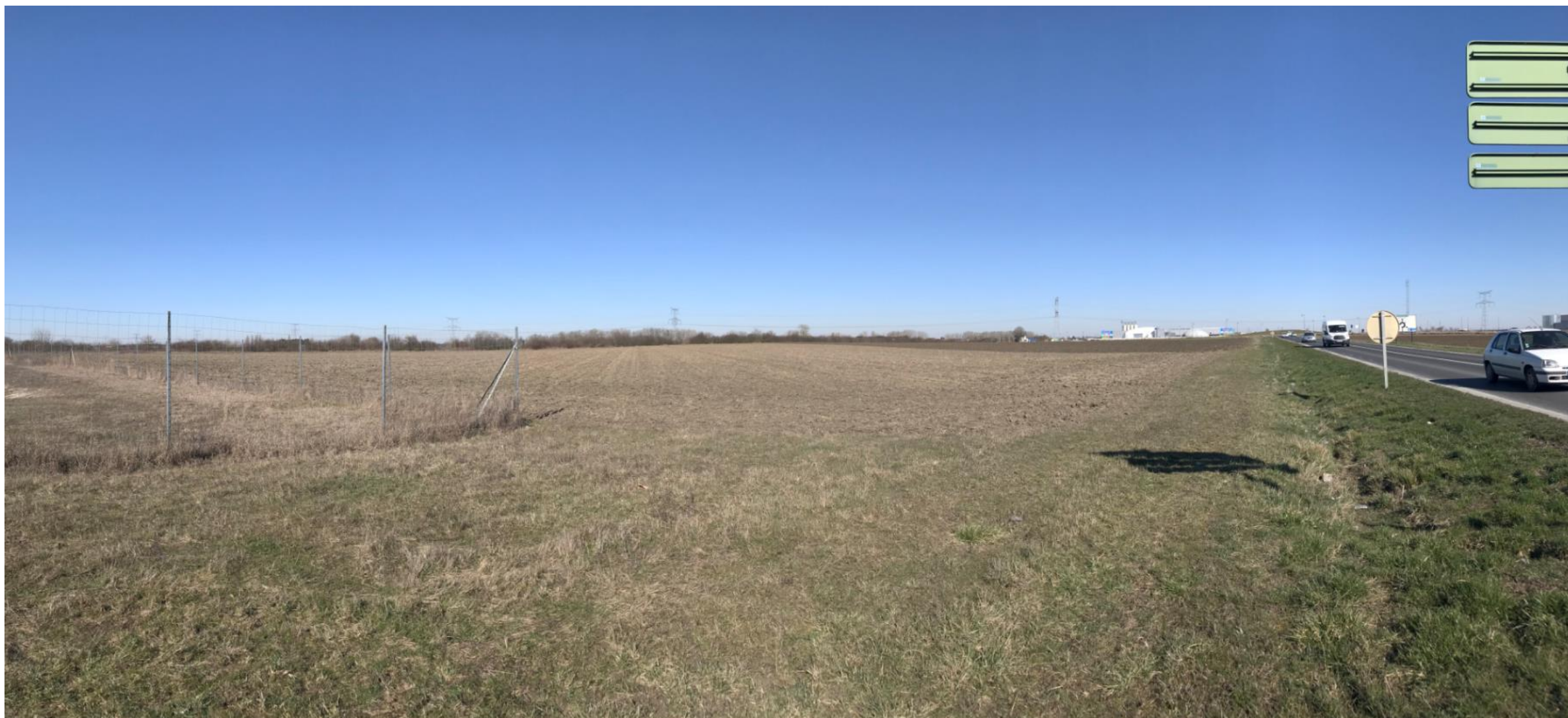
Prise de vue 3 – date : 25/02/2019