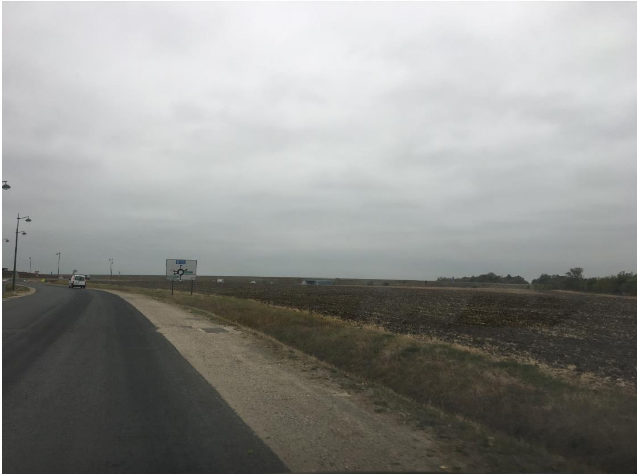
Prise de vue 1 – date : Octobre 2018