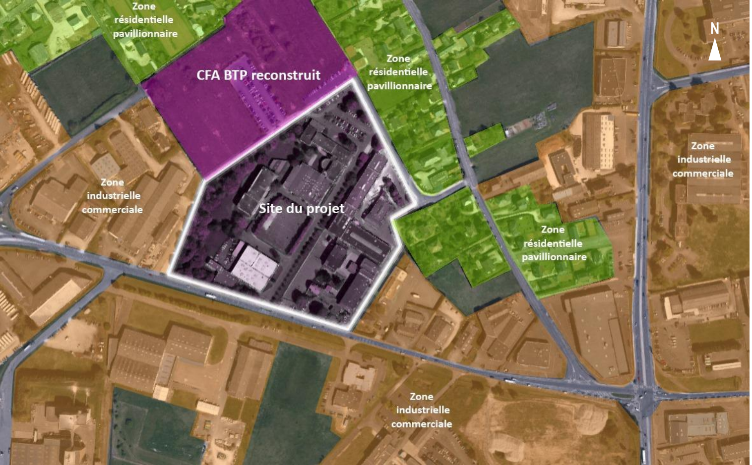
Occupation des sols