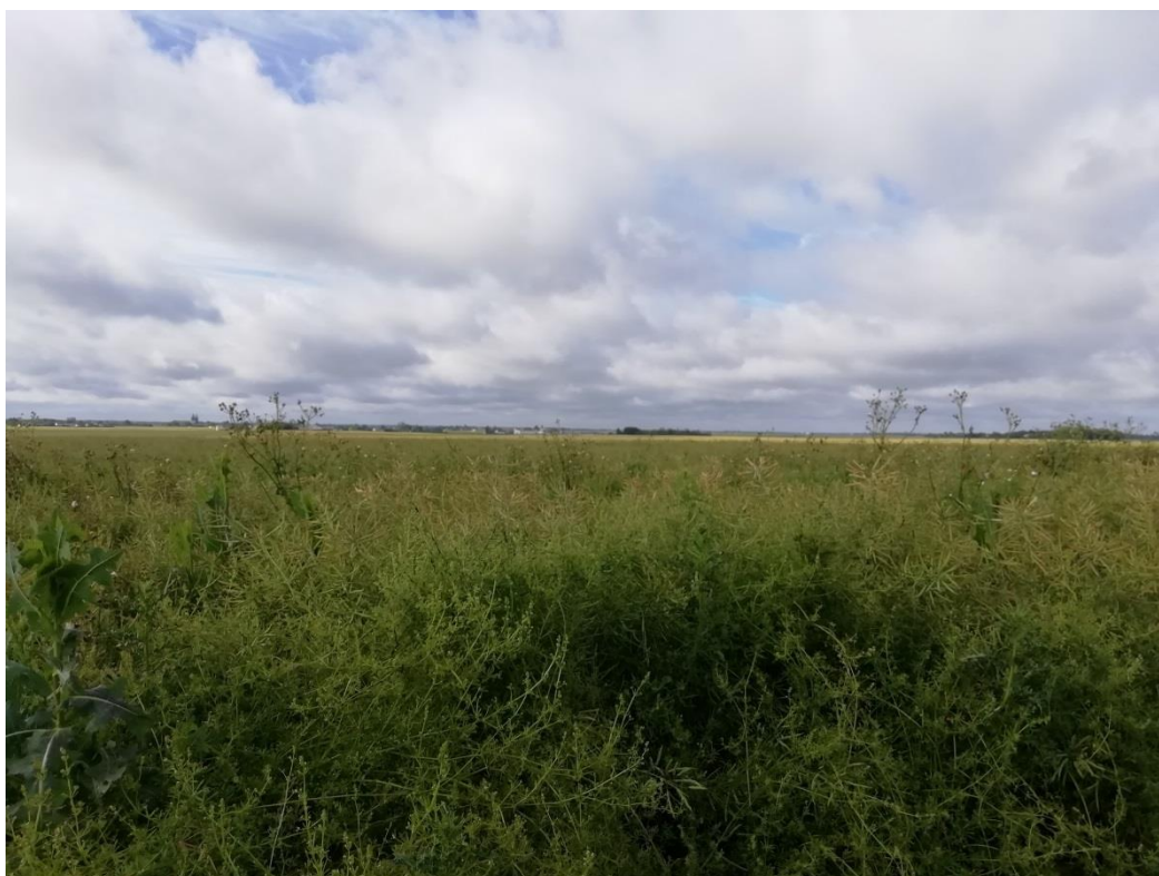
Photographie du 13/06/2019 permettant de situer le projet dans son paysage lointain, prise par la Chambre d'agriculture du Loiret