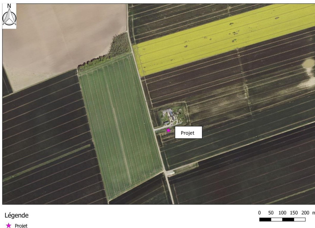
Photographie aérienne extraite du site Géoportail le 08 Août 2019 permettant de situer le projet (en rose) dans son environnement proche