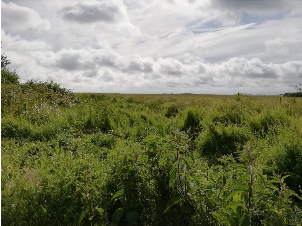
Photographie du 13/06/2019 permettant de situer le projet dans son paysage lointain, prise par la Chambre d'agriculture du Loiret

Photographies datées de la zone d'implantation avec localisation cartographique des prises de vue