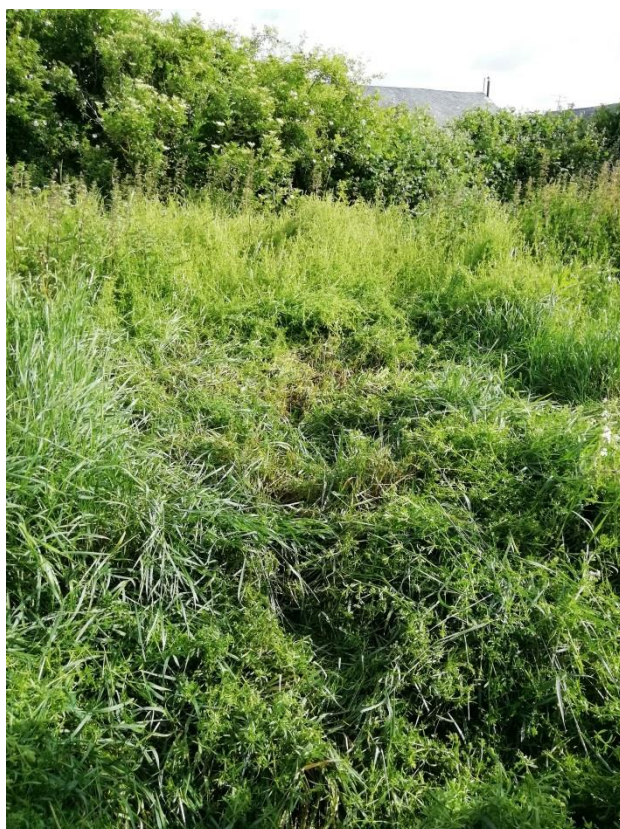
Photographie du 13/06/2019 permettant de situer le projet son environnement proche