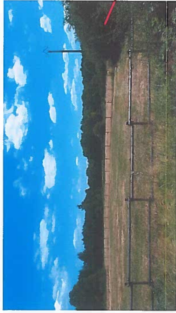
Prise de vue « rapprochée » :