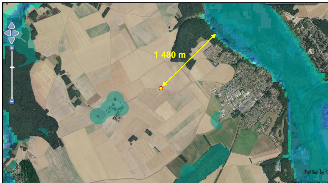
Situation du forage projeté à LA SENTE AUX PRES (PIERRES – 28) par rapport aux plans d'eau et aux zones humides potentielles recensées pré-localisées ou localisées (Extrait de : sig.reseau-zones-humides.org/ )