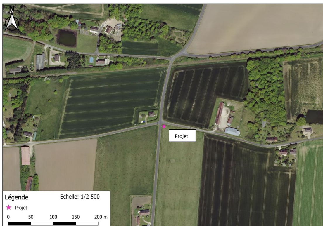
Photographie aérienne extraite du site Géoportail le 20 Août 2020 permettant de situer le projet (en rose) dans son environnement proche