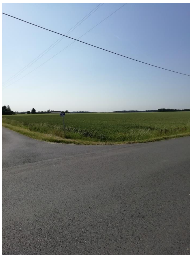
Photographie du 28/05/2020 permettant de situer le projet son environnement proche