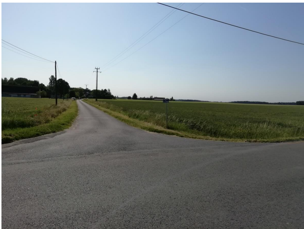
Photographie du 28/05/2020 permettant de situer le projet dans son paysage lointain