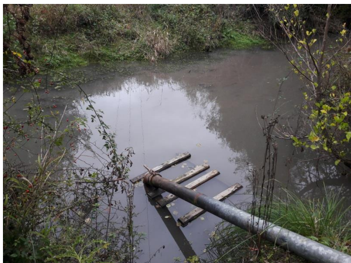
Installations de pompage de M.ROLLAND