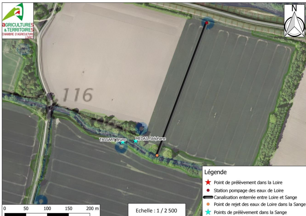
Figure 2a : Photographie aérienne des abords du projet de pompage en Sange (1/2 500 ème)