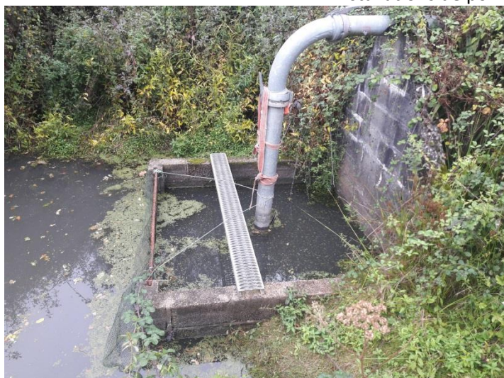
Installations de pompage de M.MEDAIL