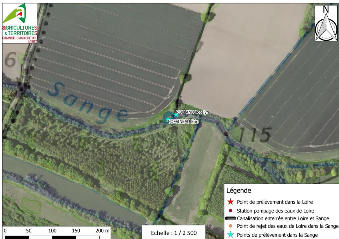
Figure 2b : Photographie aérienne des abords du projet de pompage en Sange (1/2 500 ème)