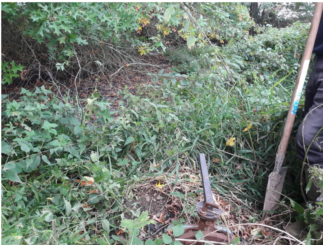
Photographie du 02/10/2017 permettant de présenter le projet de la CUMA de Sully-sur-Loire (Point de rejet dans la Sange)