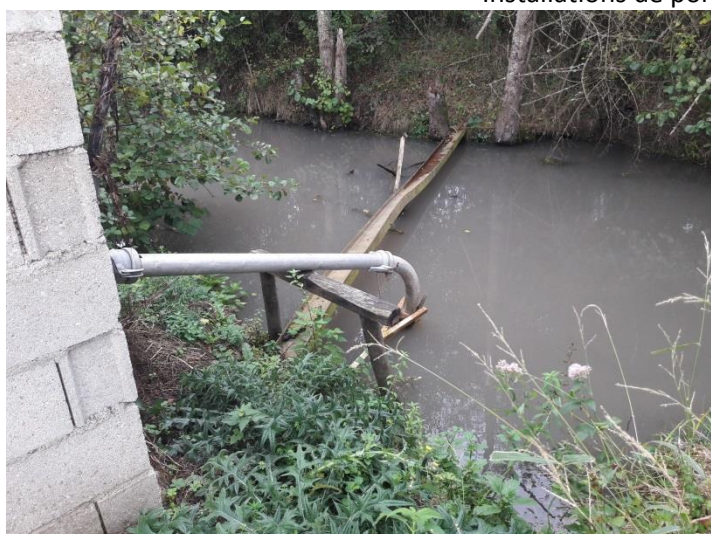
Installations de pompage de M.COFFINEAU