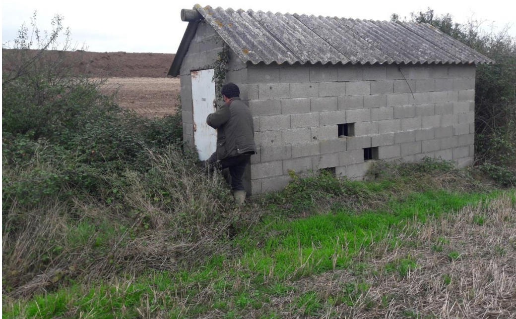
Photographie du 02/10/2017 permettant de présenter le projet de la CUMA de Sully-sur-Loire (Station pompage des eaux de Loire)