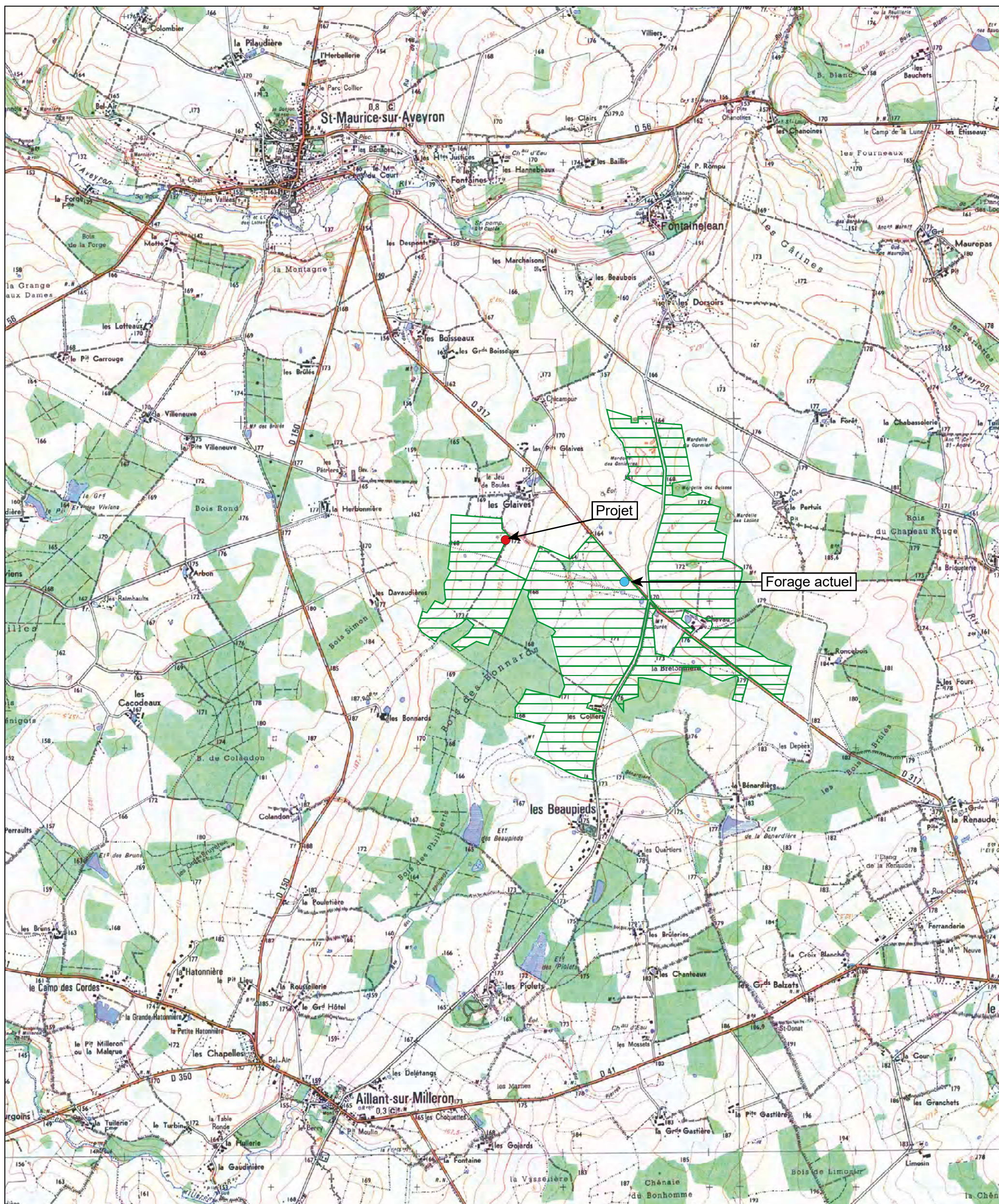
Annexe 2 Plan de situation