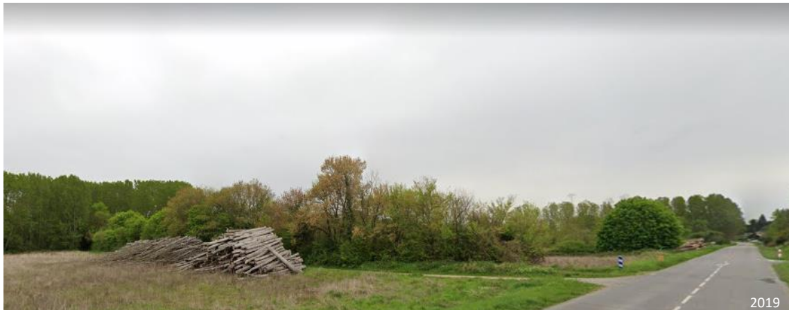
Figure 4 : Point de vue n° 2