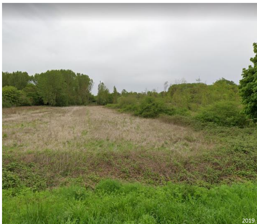
Figure 3 : Point de vue n° 1