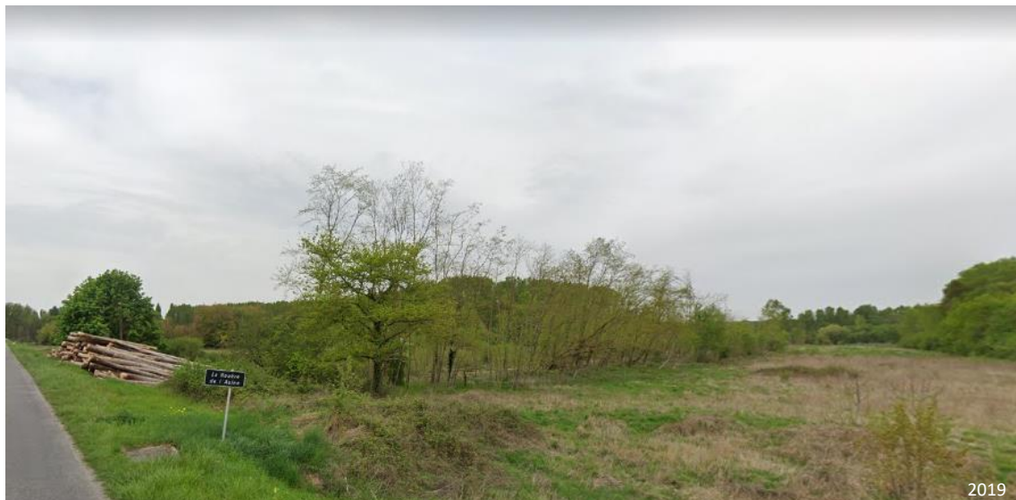
Figure 5 : Point de vue n° 3