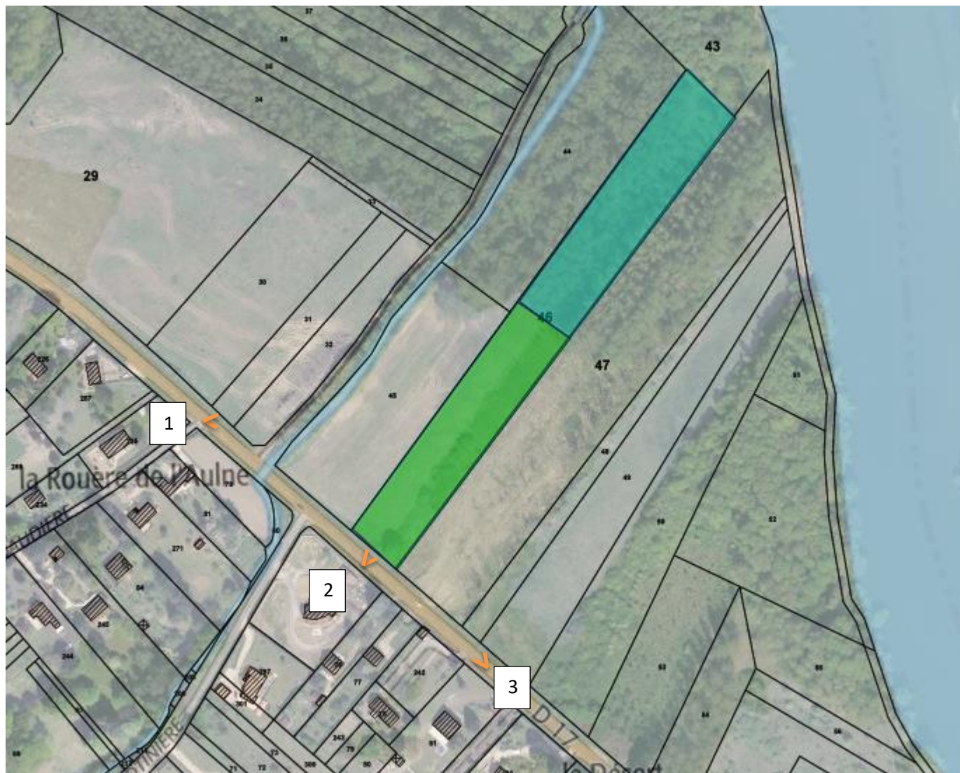
Figure 2 : Localisation des prises de vue pour une remise en situation des terrains dans les paysages proche et lointain