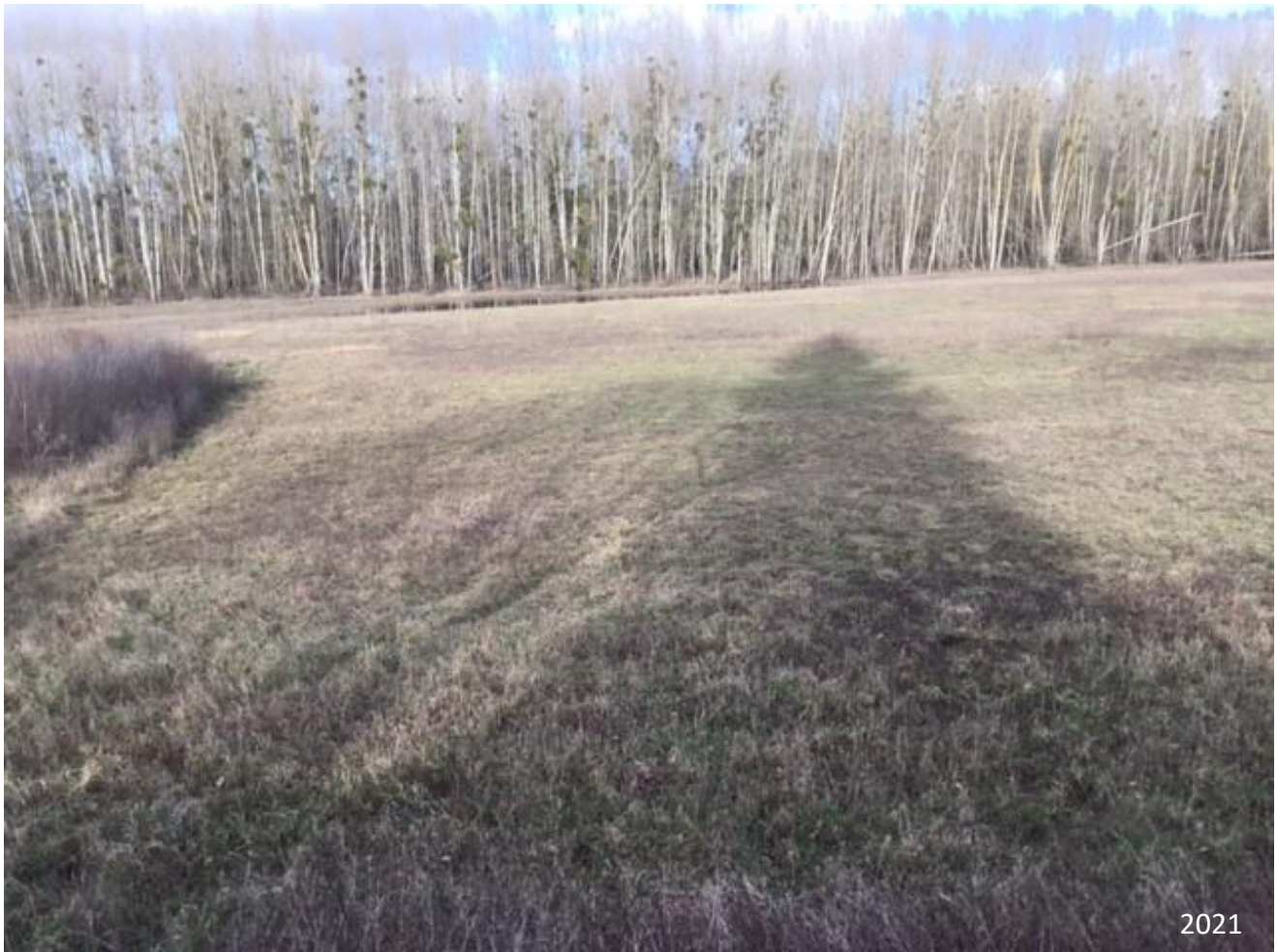
Figure 3 : Point de vue n° 1