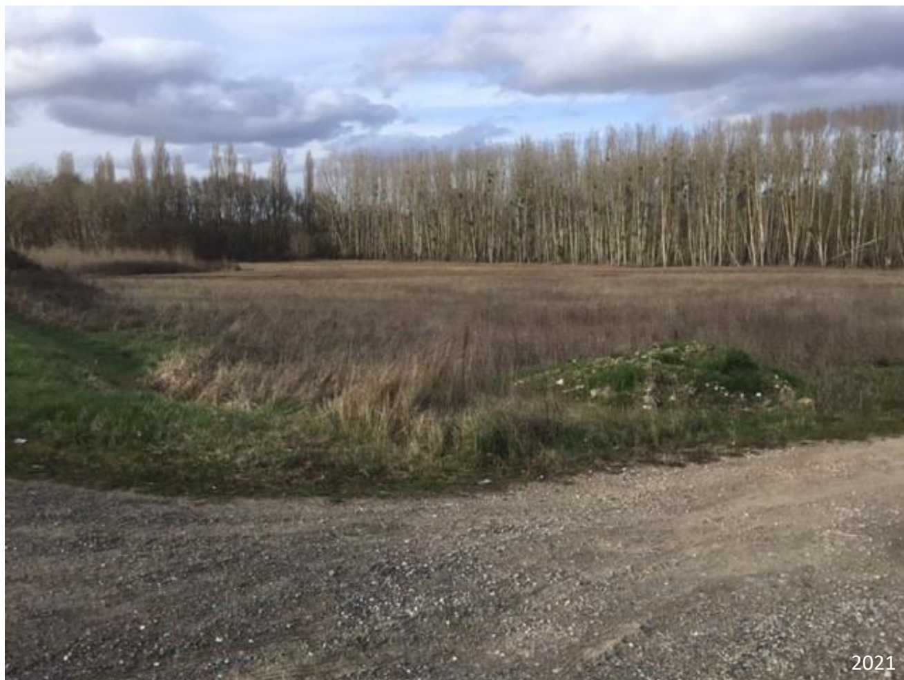
Figure 5 : Point de vue n° 3