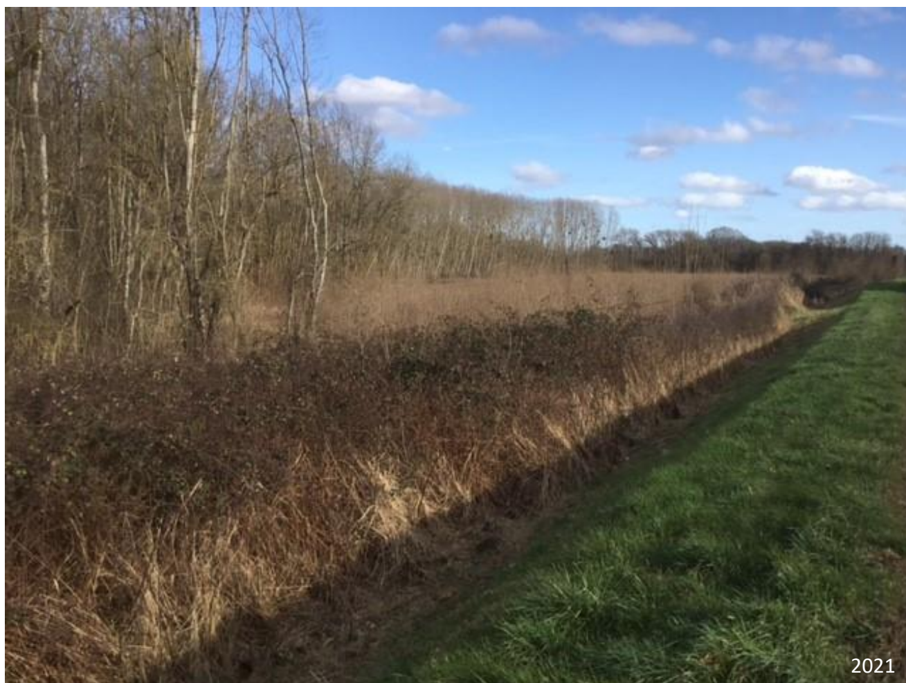
Figure 4 : Point de vue n° 2