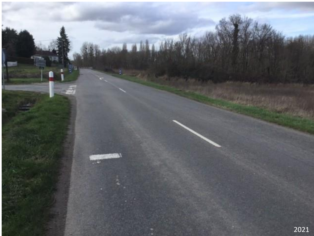
Figure 7 : Point de vue n° 5