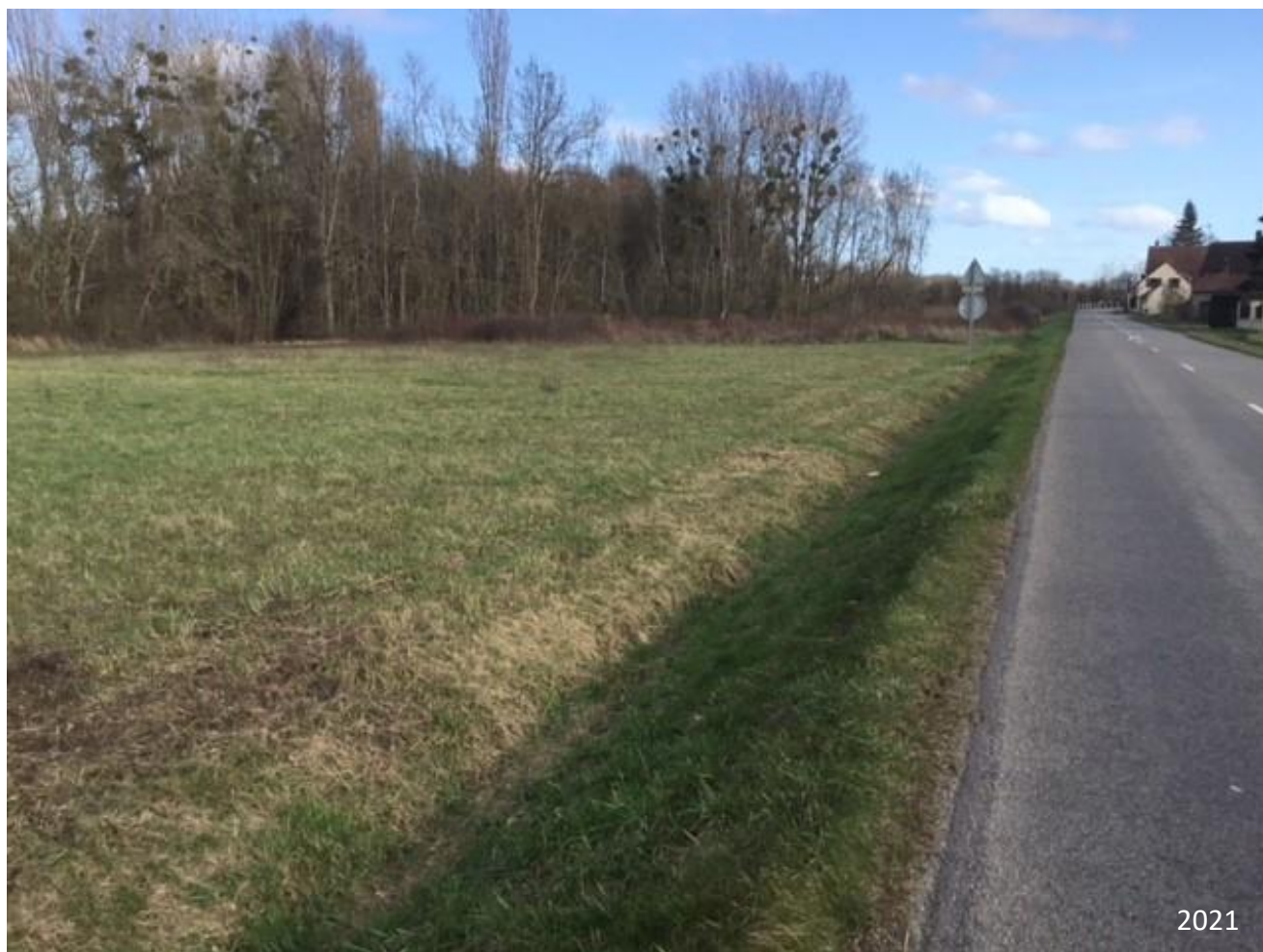
Figure 6 : Point de vue n° 4