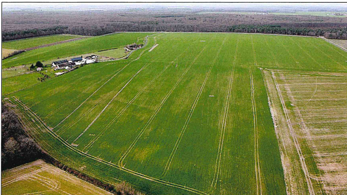
Photographie 3, vue d'ensemble - prise le 25 février 2021