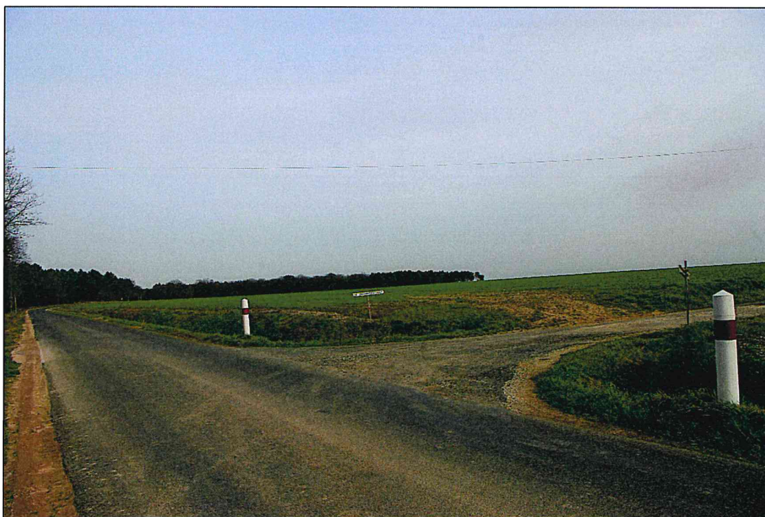
Photographie 2 de la parcelle YA-41 - prise le 25 février 2021