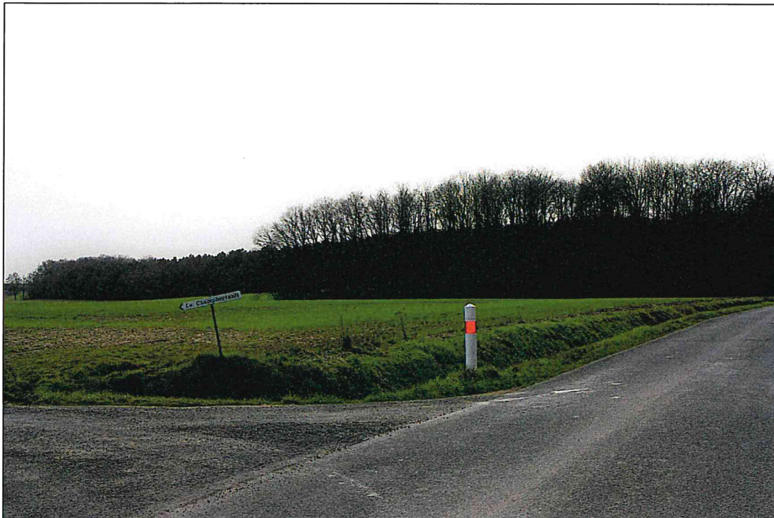
Photographie 1 de la parcelle YA-39 - prise le 25 février 2021