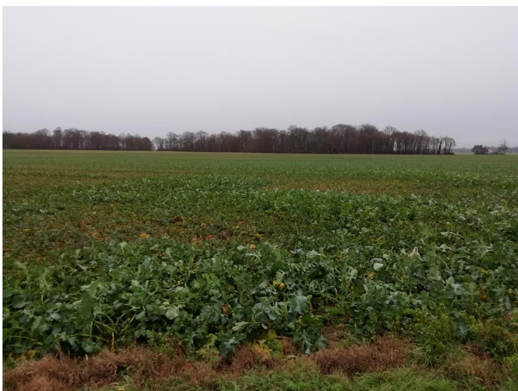
Photographies du 22/01/2021 permettant de situer le projet dans son paysage lointain, prise par la Chambre d'agriculture du Loiret