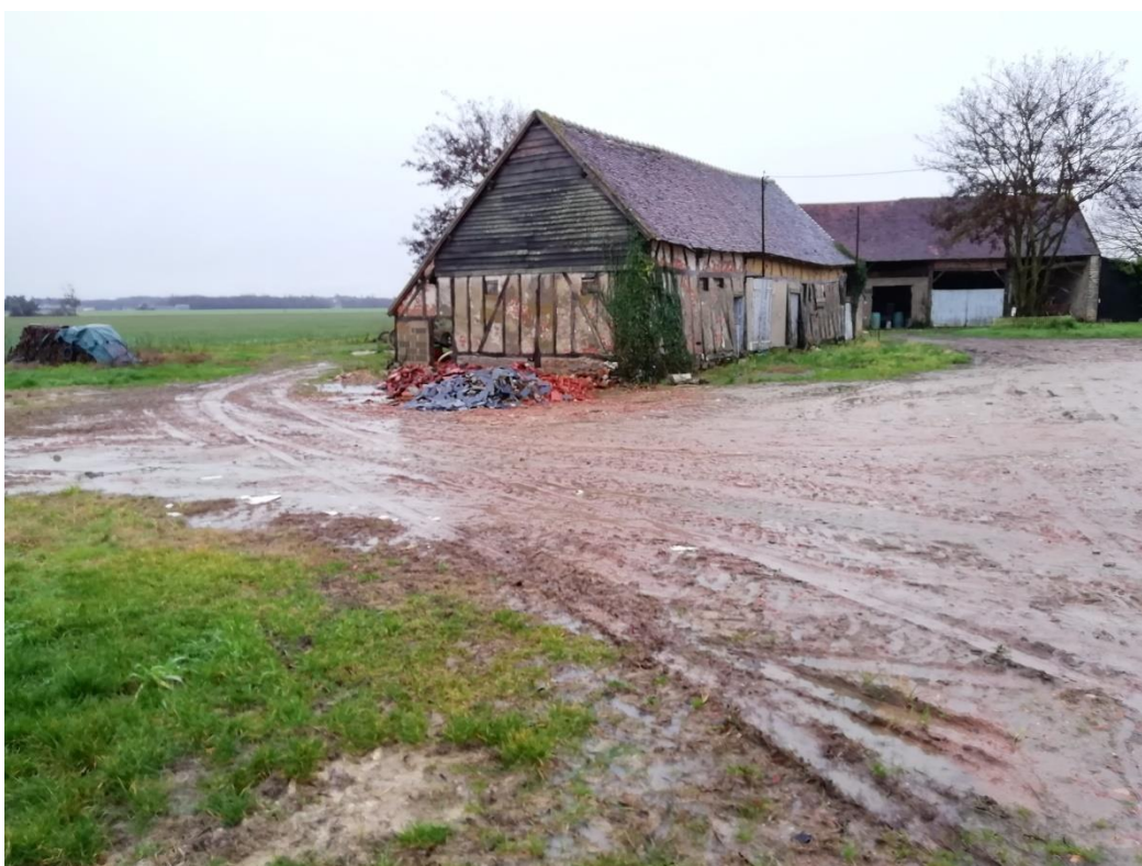
Photographies du 22/01/2021 permettant de situer le projet dans son paysage lointain, prise par la Chambre d'agriculture du Loiret