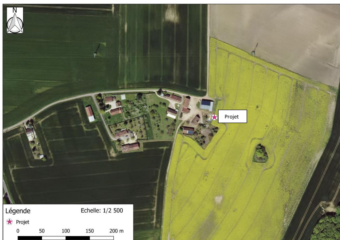
Photographie aérienne extraite de la BDORTHO IGN de 2015 permettant de situer le projet (en rose) dans son environnement proche