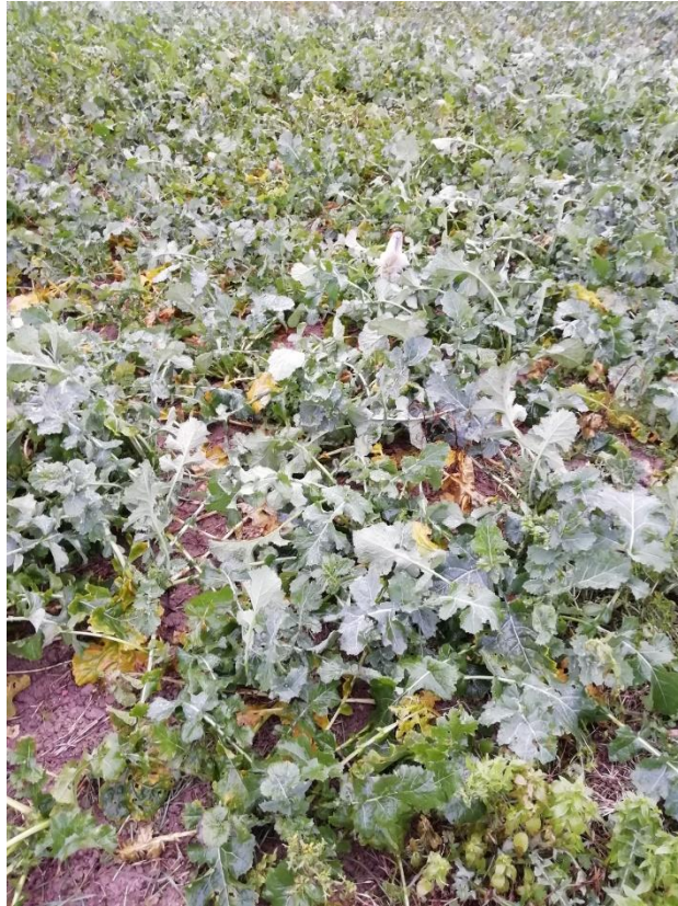
Photographie du 22/01/2021 permettant de situer le projet son environnement proche