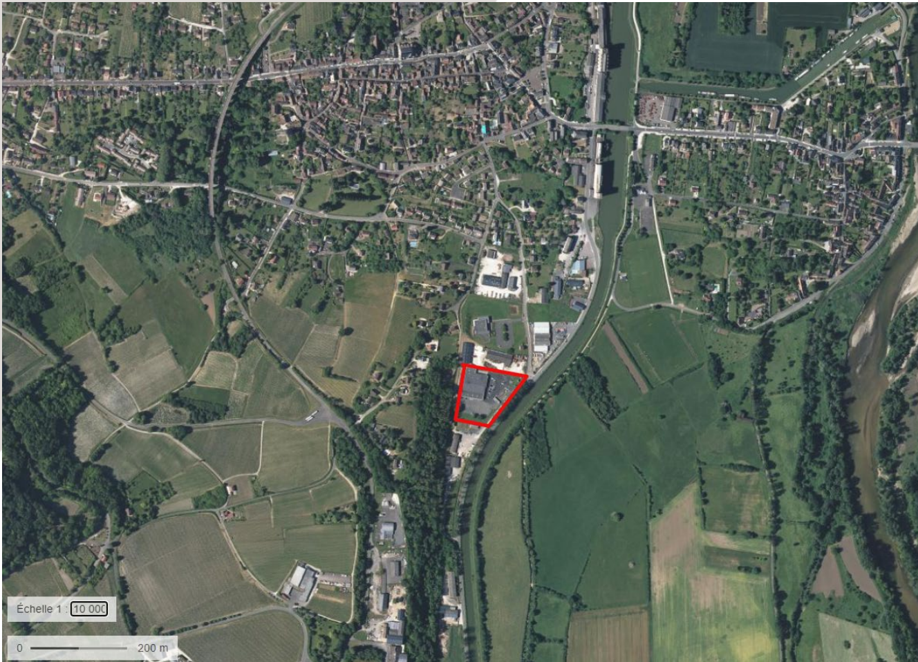
> Vue Aérienne éch: 1/10000