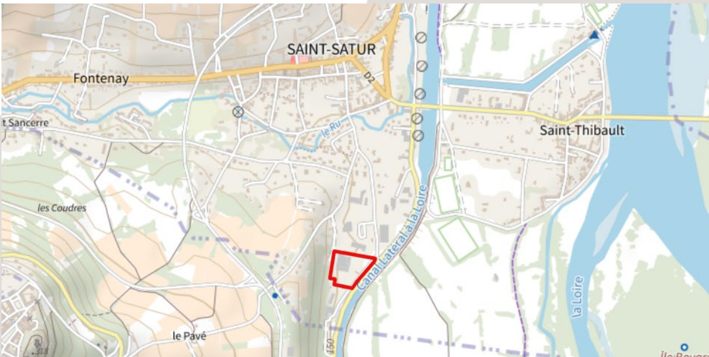
> Plan de situation éch: 1/16000