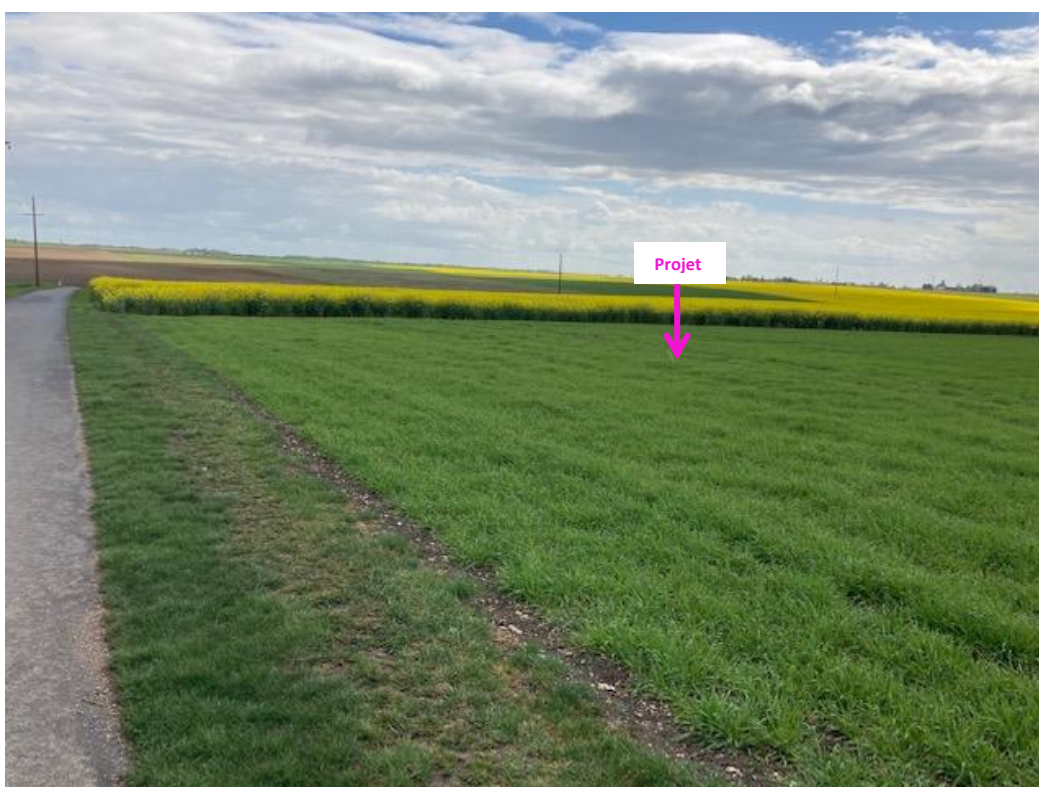
Photographies du 06/05/2021 permettant de situer le projet dans son paysage lointain