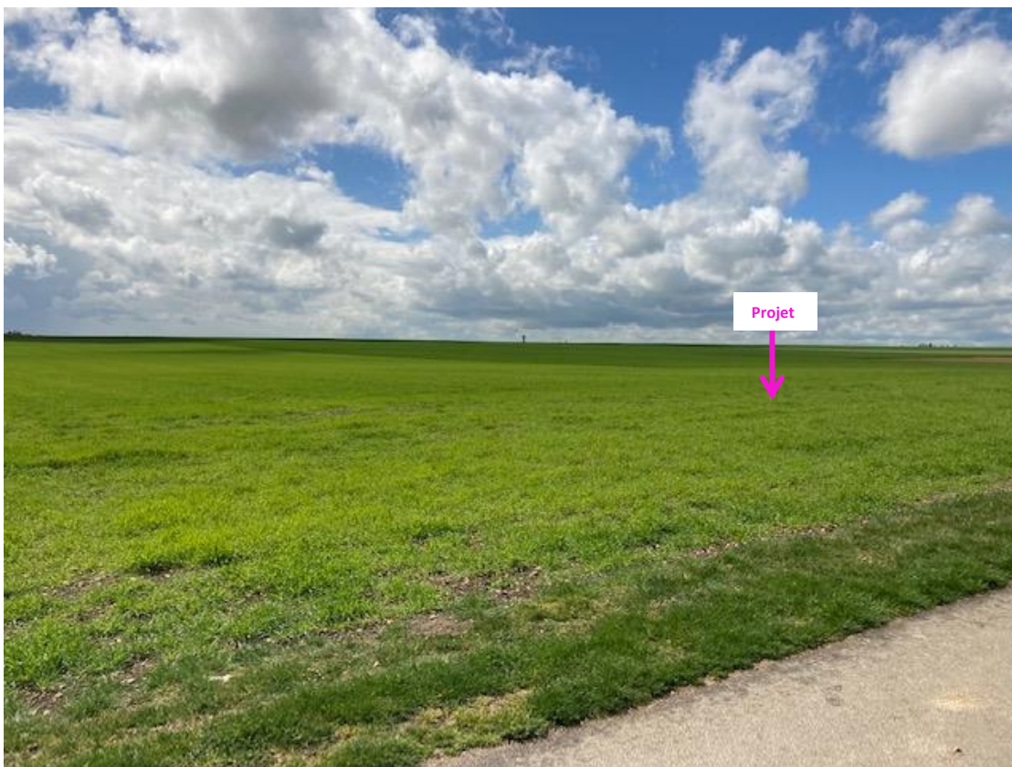
Photographies du 06/05/2021 permettant de situer le projet dans son paysage lointain