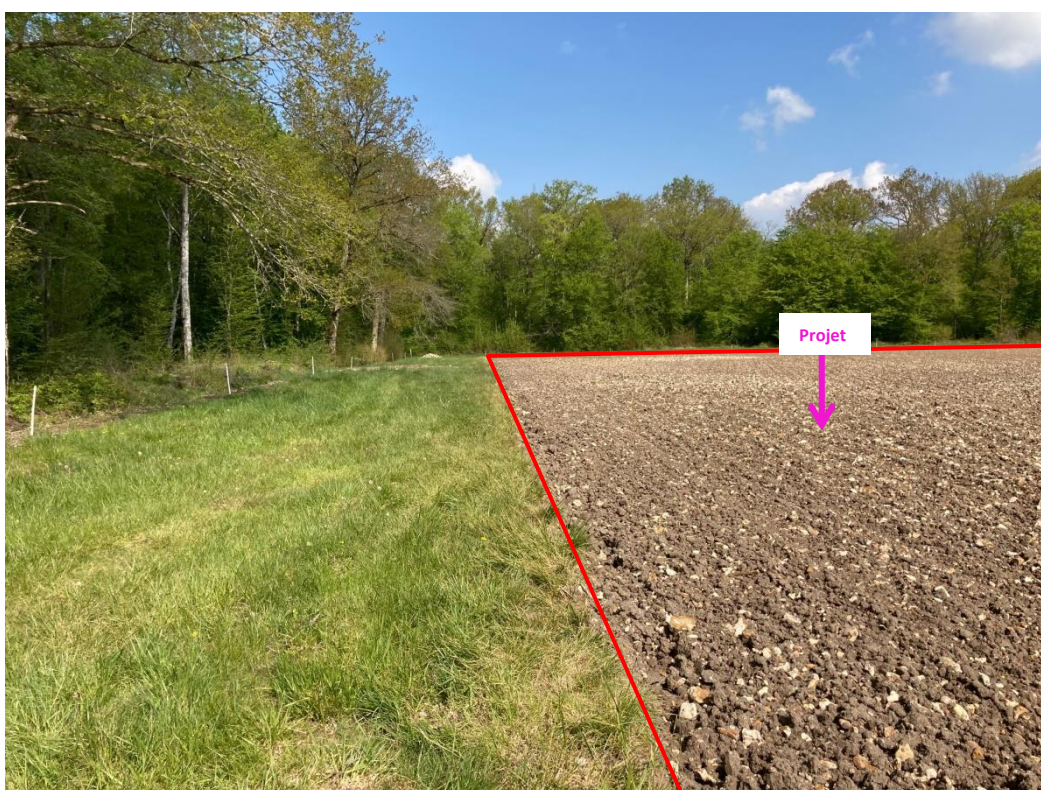
Photographies du 30/04/2021 permettant de situer le projet (parcelle dans les lignes rouges) dans son paysage