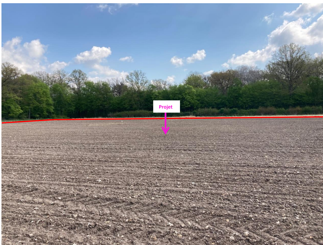
Photographies du 30/04/2021 permettant de situer le projet (parcelle dans les lignes rouges) dans son paysage