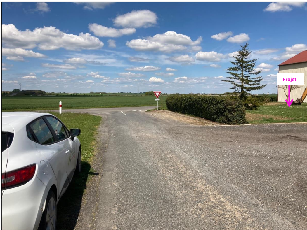
Photographies du 07/05/2021 permettant de situer le projet dans son paysage lointain