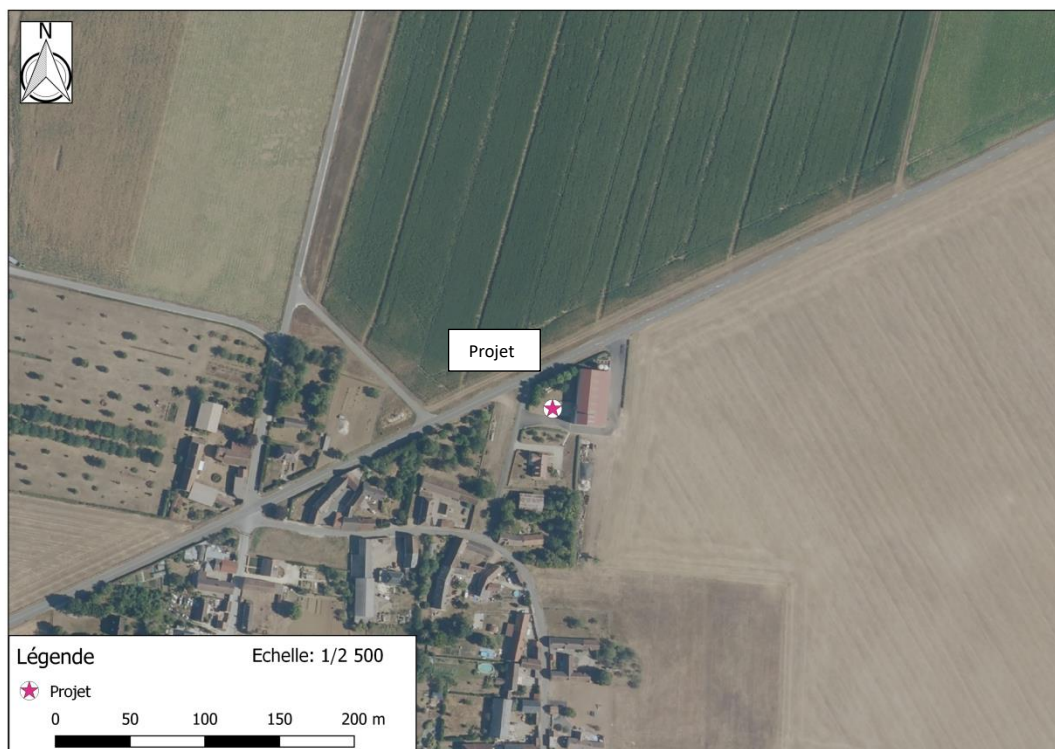
Photographie aérienne extraite de la BDORTHO IGN de 2015 permettant de situer le projet (en rose) dans son environnement proche