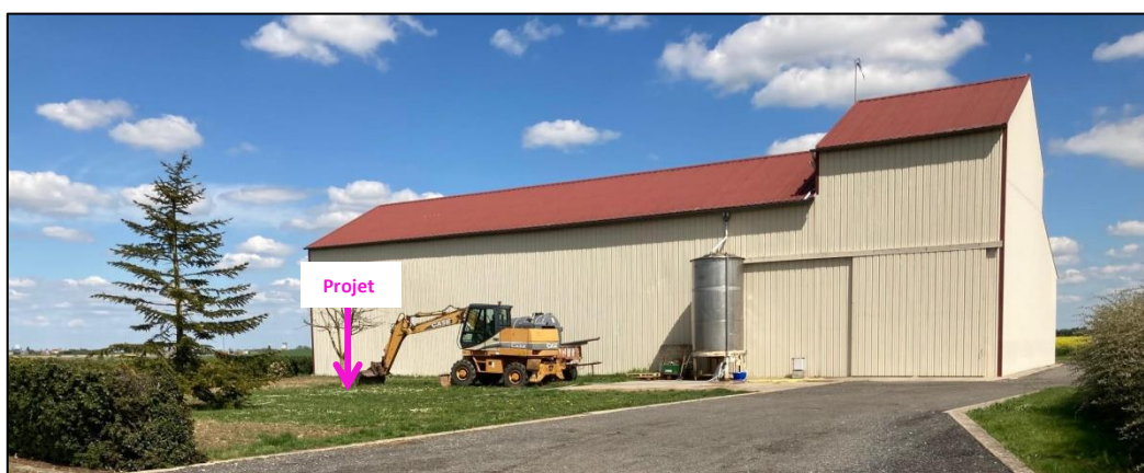
Photographies du 07/05/2021 permettant de situer le projet dans son paysage lointain