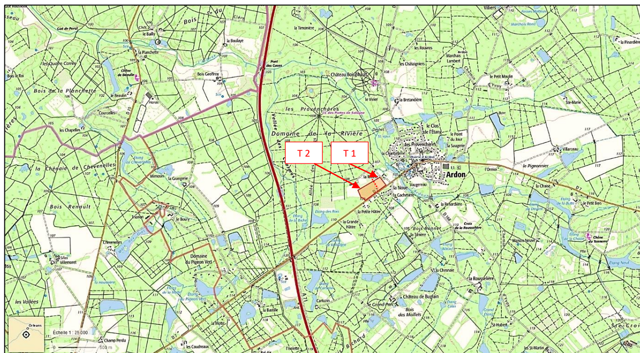
Figure 1 : Plan de situation au 1/25 000 du projet