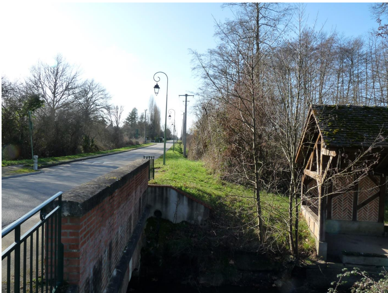
Photo 1 : Environnement lointain – Vue depuis l'Ardoux à l'entrée du bourg d'Ardon le long de la RD 7 en direction du projet