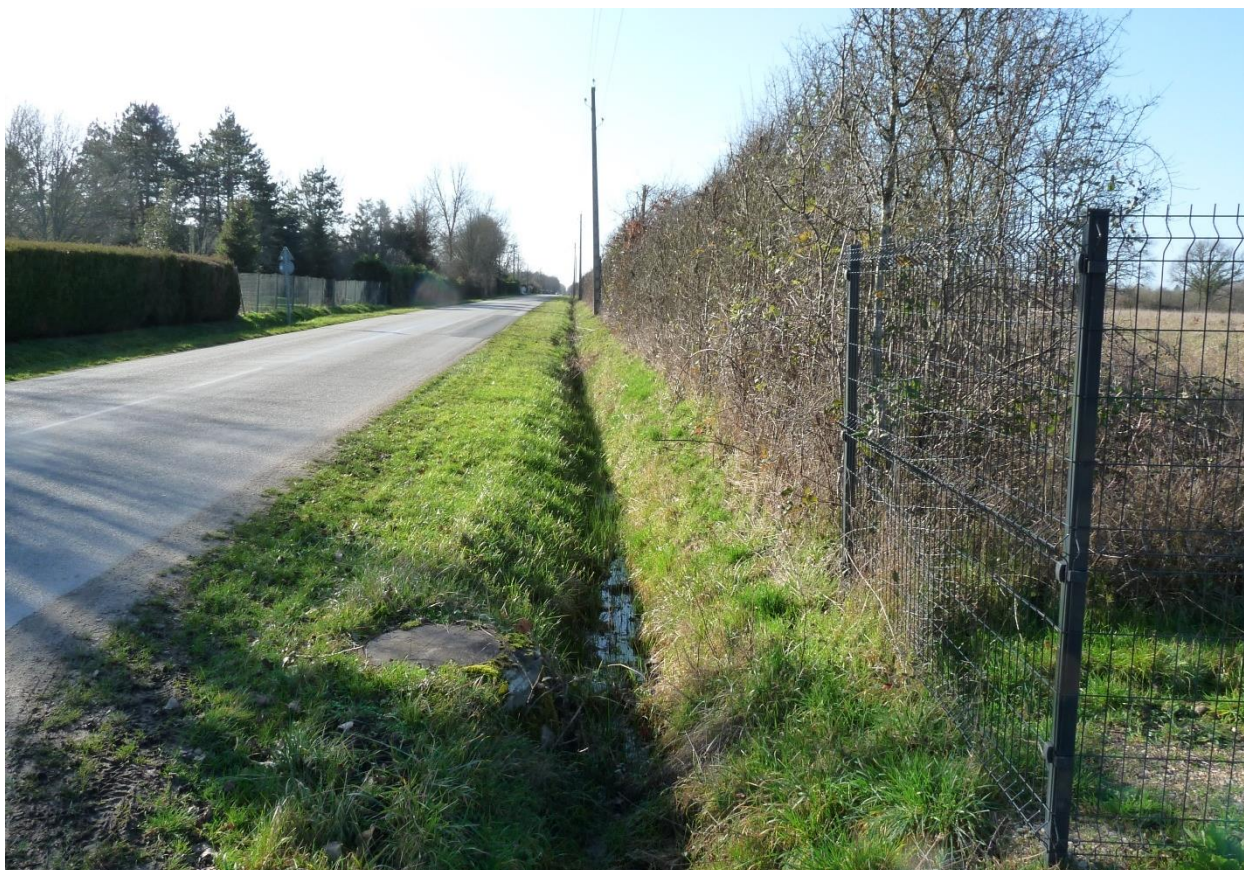
Photo 3 : Environnement proche – Vue depuis l'entrée de la propriété du Domaine de la Rivière sur la RD 7 en direction de l'ouest, longeant l'emprise du projet