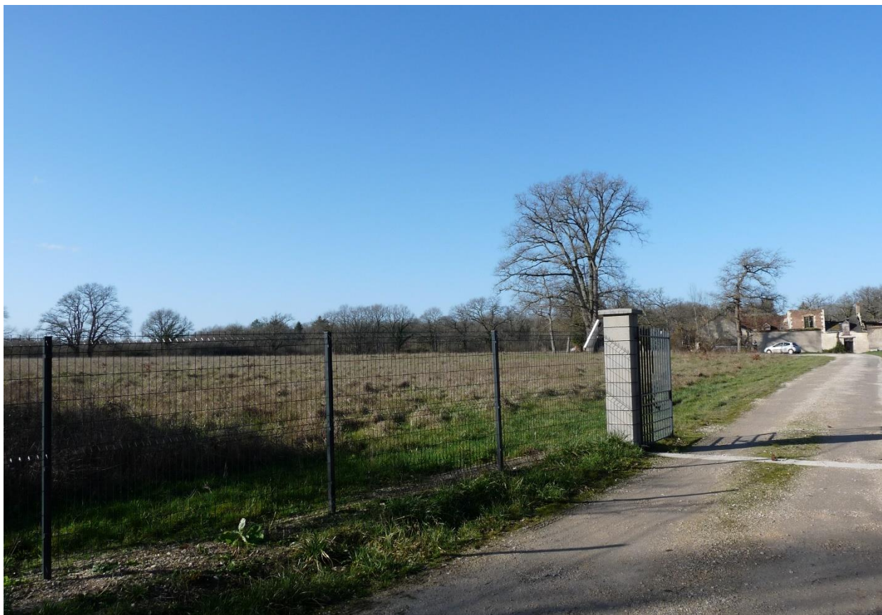
Photo 2 : Environnement proche – Vue depuis la RD 7 et l'entrée de la propriété du Domaine de la Rivière sur la tranche 1