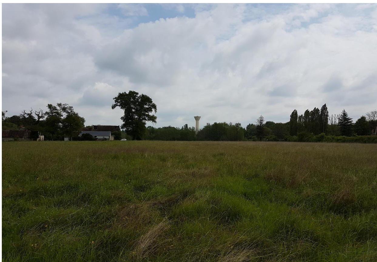
Photo 5 : Environnement proche – Vue depuis le centre de la tranche 1 sur l'emprise du projet et la ferme du Domaine de la Rivière en arrière-plan