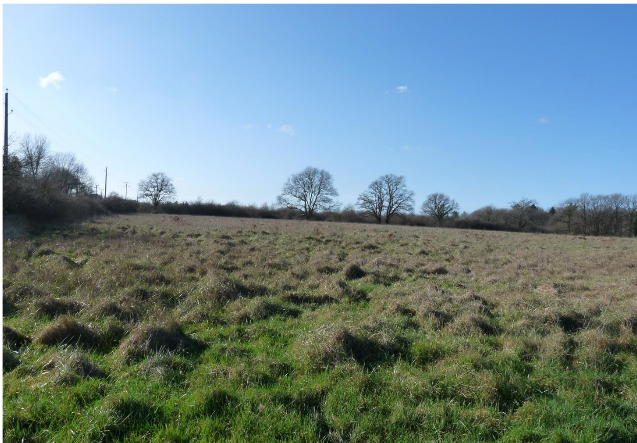
Photo 4 : Environnement proche – Vue depuis la voie d'entrée de la propriété du Domaine de la Rivière sur la tranche 1 et la tranche 2 en arrière-plan