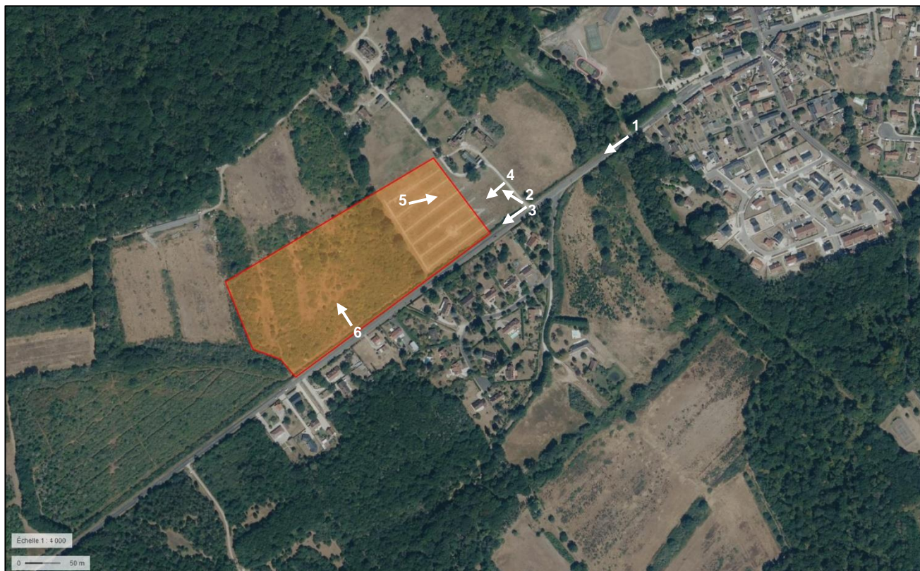
Figure 2 : Localisation des prises de vues sur l'emprise du projet