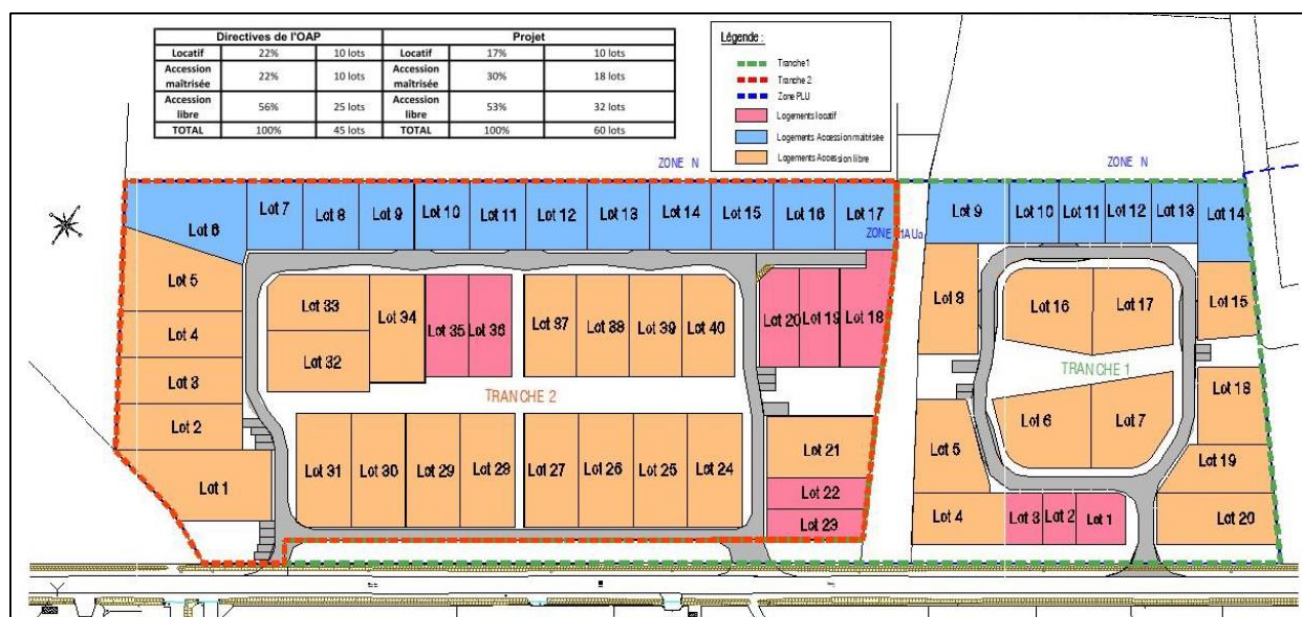
Figure 3 : Principes d'aménagement du projet global (tranches 1 et 2)