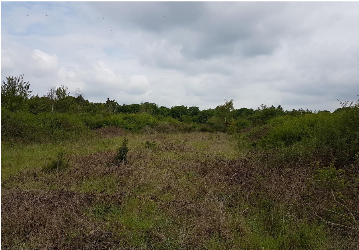
Photo 6 : Environnement proche – Vue depuis le chemin longeant l'emprise sur la tranche 2, occupée par une zone de fourrés (Source : IEA – mai 2019)