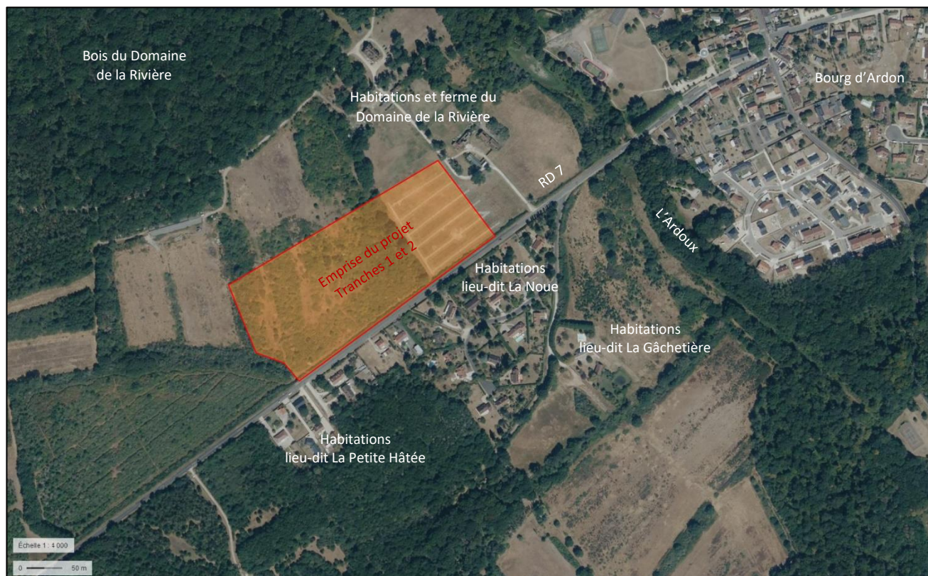
Figure 4 : Photographie aérienne des abords du projet, échelle du 1/4000