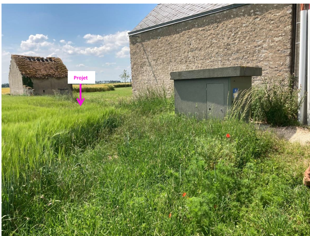
Photographies du 10/06/2021 permettant de situer le projet dans son paysage lointain