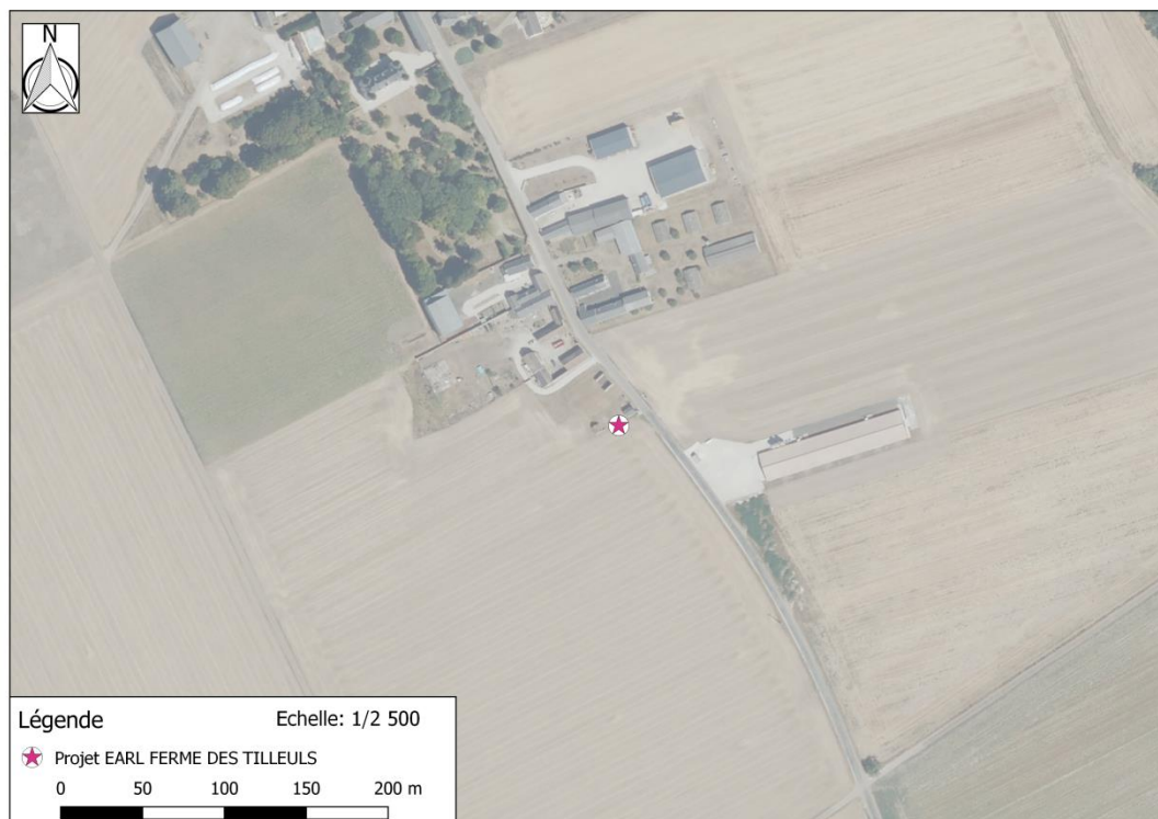
Photographie aérienne extraite de la BDORTHO IGN de 2015 permettant de situer le projet (en rose) dans son environnement proche