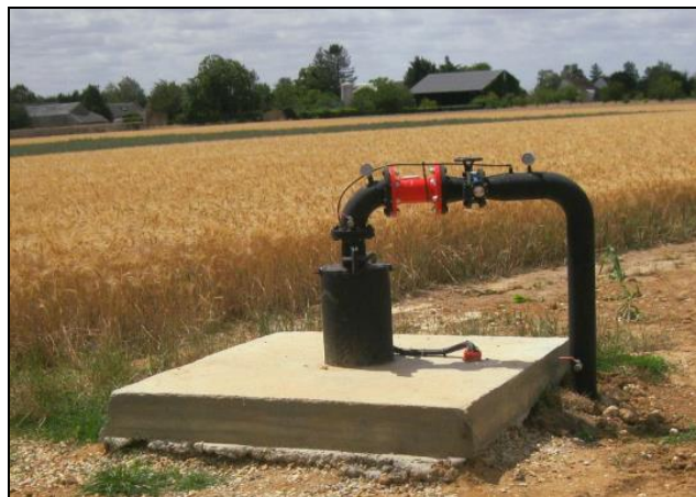
Exemple d'aménagement de tête de forage avec équipement d'hydraulique à l'exhaure dédié à l'irrigation de cultures