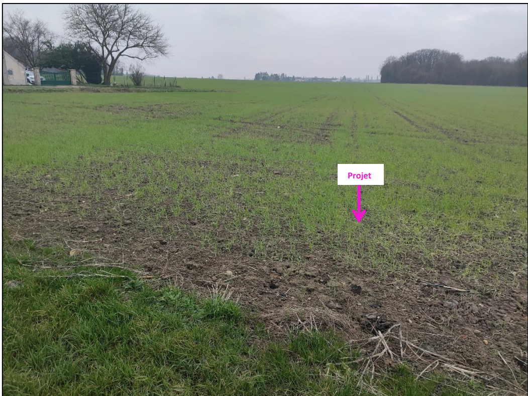
Photographies du 19/01/2022 permettant de situer le projet dans son paysage lointain