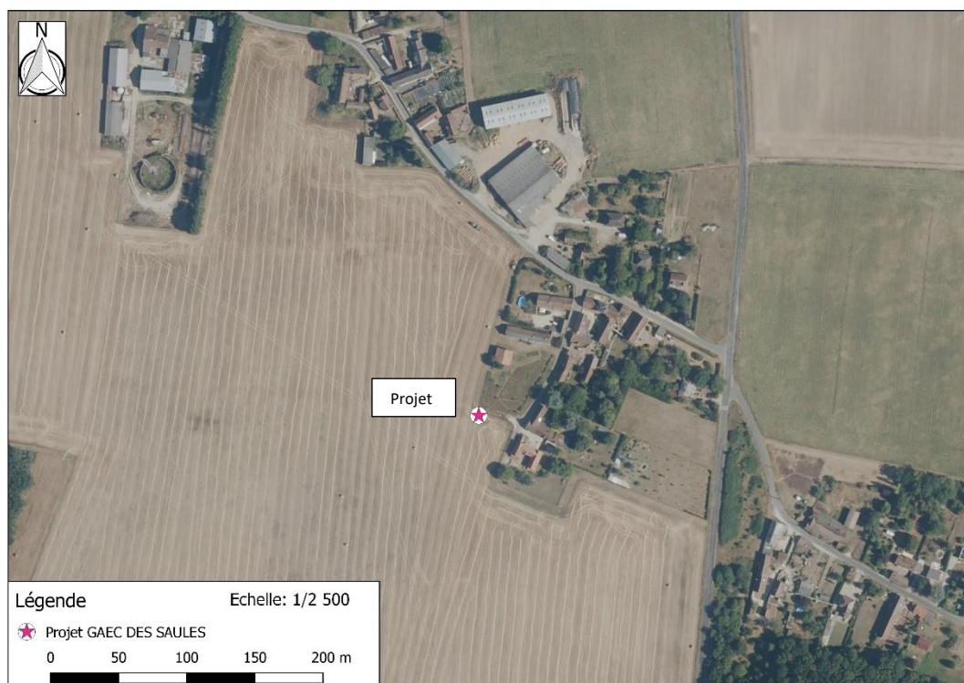
Photographie aérienne extraite de la BDORTHO IGN de 2015 permettant de situer le projet (en rose) dans son environnement proche