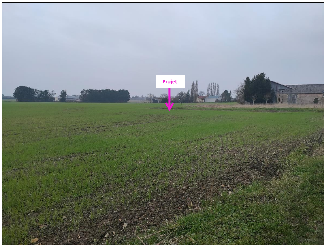
Photographies du 19/10/2022 permettant de situer le projet dans son paysage lointain